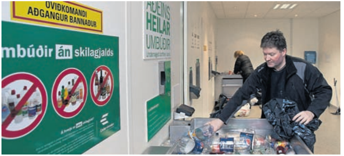
Íslendingar eru duglegir að skila drykkjarumbúðum í endurvinnslu.