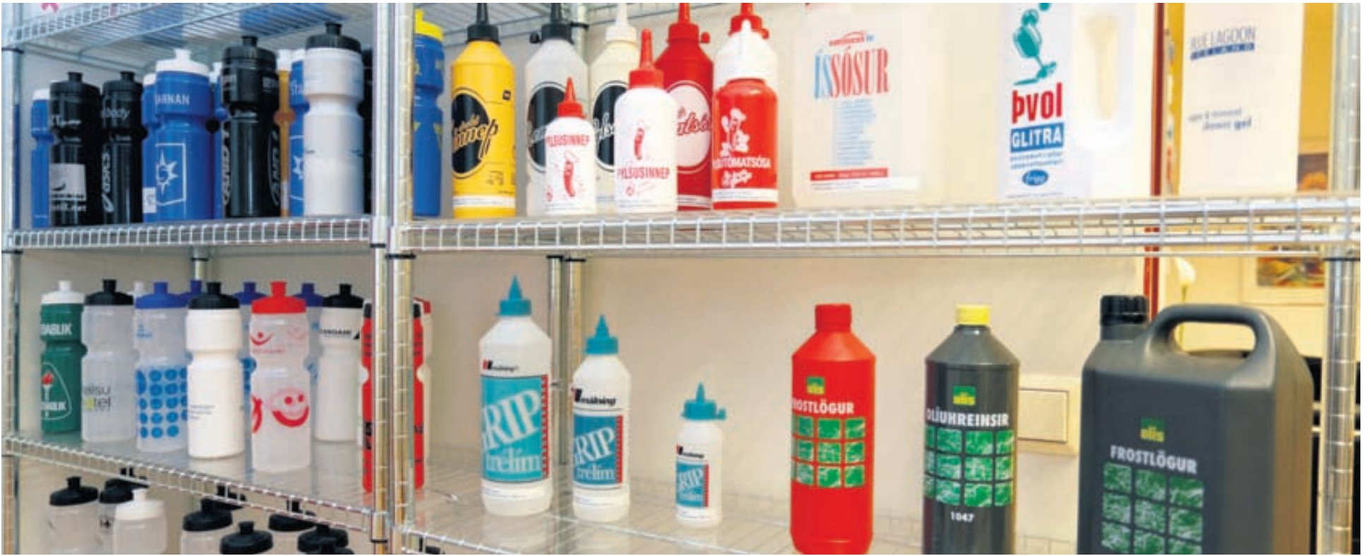
Sigurplast framleiðir plastumbúðir fyrir flest helstu matvælafyrirtæki landsins eins og SS, Vogabæ, Gunnars og Kjarnavörur.