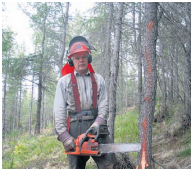
Gestur hefur starfað sem skógarhöggsmáður. Honum blöskraði hátt eldsneytisverð sem leiddi til þess að hann fann Blest-vélarnar sem endurvinnna olíu úr plasti.