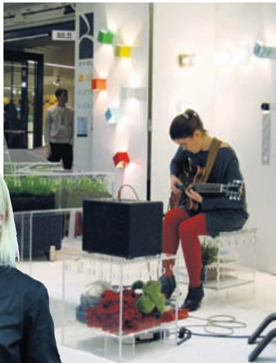
„Hani, krummi, hundur, svín“ ómaði um sýningarsalinn og vakti mikinn áhuga viðstaddra.