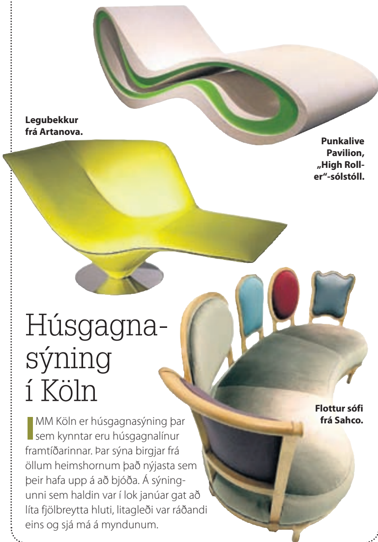
Legubekkur frá Artanova.