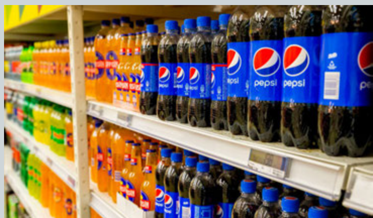
Við opnun Costco í lok maí mun koma í ljós í hversu miklu magni Costco mun selja drykkjarvörur frá íslenskum framleiðendum. FRÉTTABLAÐIÐ/VILHELM

„Þetta getur snúist upp í það að vera ógn fyrir íslenskar heildsölur og framleiðendur. Það hefur aftur á móti viðgengist að stóru aðilarnir hafa auðvitað verið að flytja inn vörur í samkeppni við heildsöluvar. Það sem ég held að menn séu að vanmeta er að þeir hafa mikið verið að horfa á matinn. Þetta mun auðvitað snerta hann mikið en jafnvel aðra geira enn meira.“