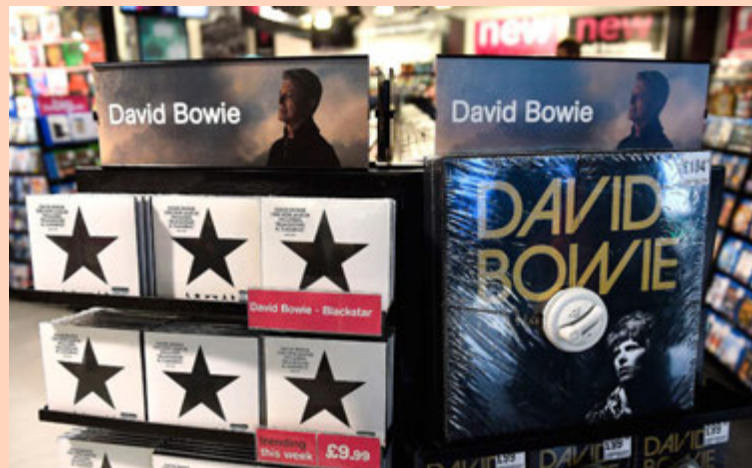
Blackstar, plata David Bowie, seldist vel hjá Spotify og iTunes í fyrra

Framleiðslu- og dreifingarkostnaður stafrænnar tónlistar er sáralítill. Áberandi er þó hversu makalaust illa hefur gengið að skapa tekjur af streymi tónlistar. Niðurhalið er að hverfa af markaðnum og framtíðin liggur í streymi, ýmist fríu streymi með auglýsingum eða áskrifarþjón-