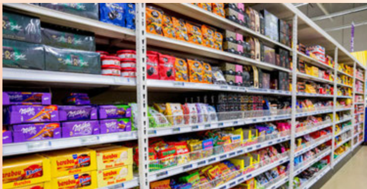
Ölgerðin á i viðræðum við Mars inc. um lækkun á innkaupsverði á salgæti.

Rekstrarfélag Tíu ellefu ehf. rekur 35 verslanir á höfuðborgarsvæðinu, í Reykjanesbæ og á Akureyri undir vörumerki 10-11. Fyrirtækið gerði í september 2014 samstarfssamning