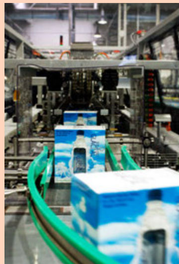
Icelandic Water Holdings rekur átöppunarverksmiðju í Ölfusi.