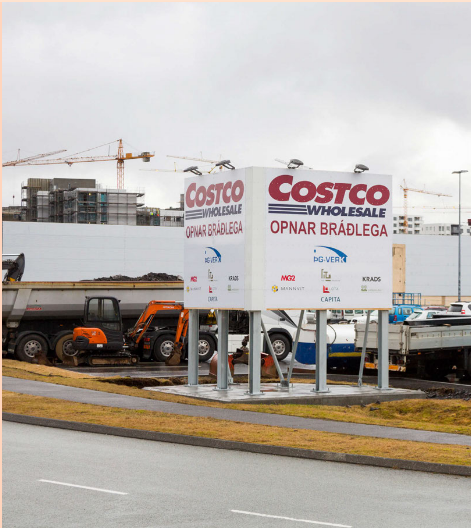
Stefnt er að opnun Costco í Kaupþúni í Garðabæ í lok maí næstkomandi.

Hagfræðideildin uppfærði í september síðastliðnum verðmat sitt á verslunarfyrirtækinu Högum. Í því var meðal annars bent á umfang bandaríska verslunarrisans sem velti jafnvirði um fjórtán þúsund milljarða króna árið 2015. Íslenski smásölumarkaðurinn var þá 400