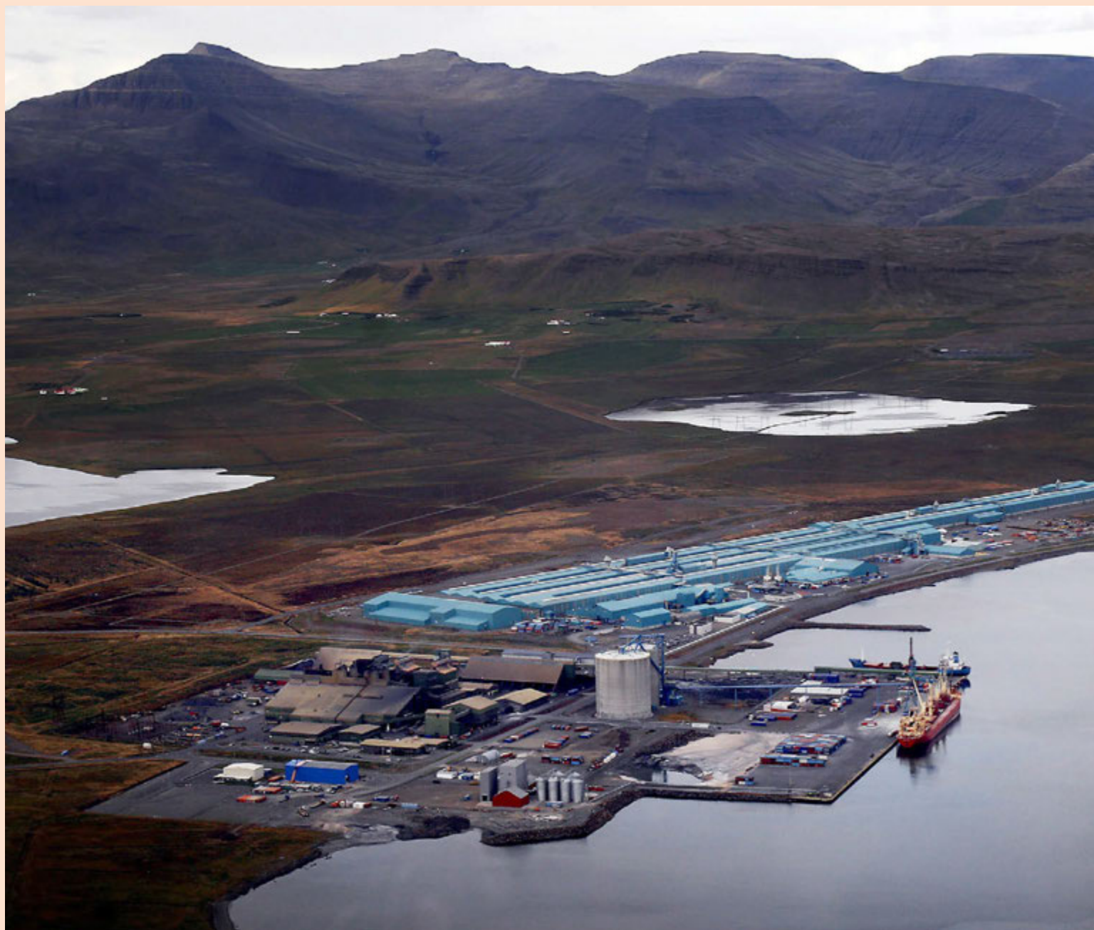
GMR hóf framleiðslu á Grundartanga árið 2013.

„Þetta fyrirtæki var stofnað fyrir fjórum árum og það er búinn að vera erfiður og langur uppbyggingsfasir. Erfiðari og lengri en menn ætluðu sér og það er margt sem spilar þar inn í. Heimsmarkaðsverð á stáli er þar langstærsti þátturinn,“ sagði Daði í samtali við Fréttablaðið. – hg