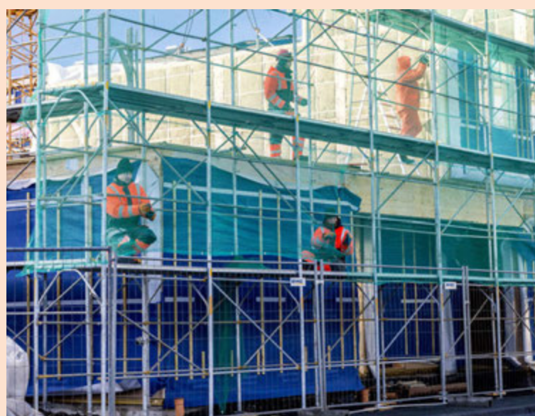
Byggja þarf að lágmarki átta þúsund íbúðir á næstu þremur árum til að halda í við fjólföldun.

Hagstætt efnahagsástand, fjólföldun, kaupmáttaraukning og gott aðgengi að fjármögnun eru á meðal