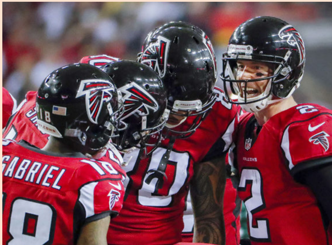
Lið Atlanta Falcons mætir New England Patriots í úrslitaleik NFL-deildarinnar á sunnudag.