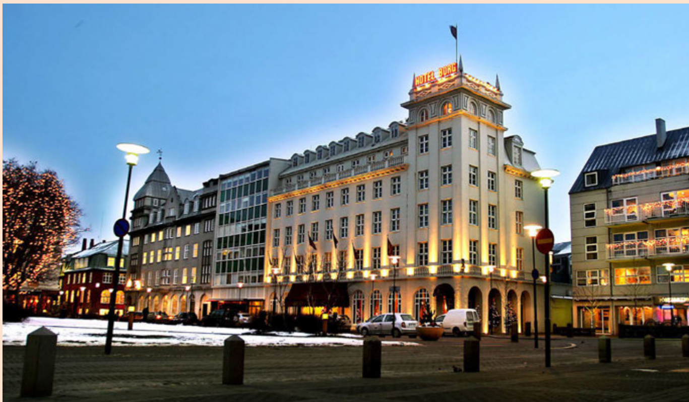
Hótel Borg er eitt af átta hótélum sem Keahótel reka. Samtals eru hótélín fimm talsins í Reykjavík og þrjú á Norðurlandi, meðal annars Hótel Kea og Hótel Norðurland.

Rekstur Keahótela hefur gengið afar vel á undanförunum árum. Hagnaður félagsins á árinu 2015 nam 263 milljónum króna og næstum tvöfaldaðist frá fyrra ári. Þá var velta hótélkeðjunnar tæplega 1,7 milljarðar króna og jókst um liðlega 500 milljónir króna frá árinu 2014. EBITDA-hagnaður félagsins – afkoma fyrir fjármagnsliði, skatta og afskriftir – var um 372 milljónir á árinu 2015, að því er fram kemur í síðasta birta ársreikningi, og hækkaði um meira en 200 milljónir á milli ára. Eignir