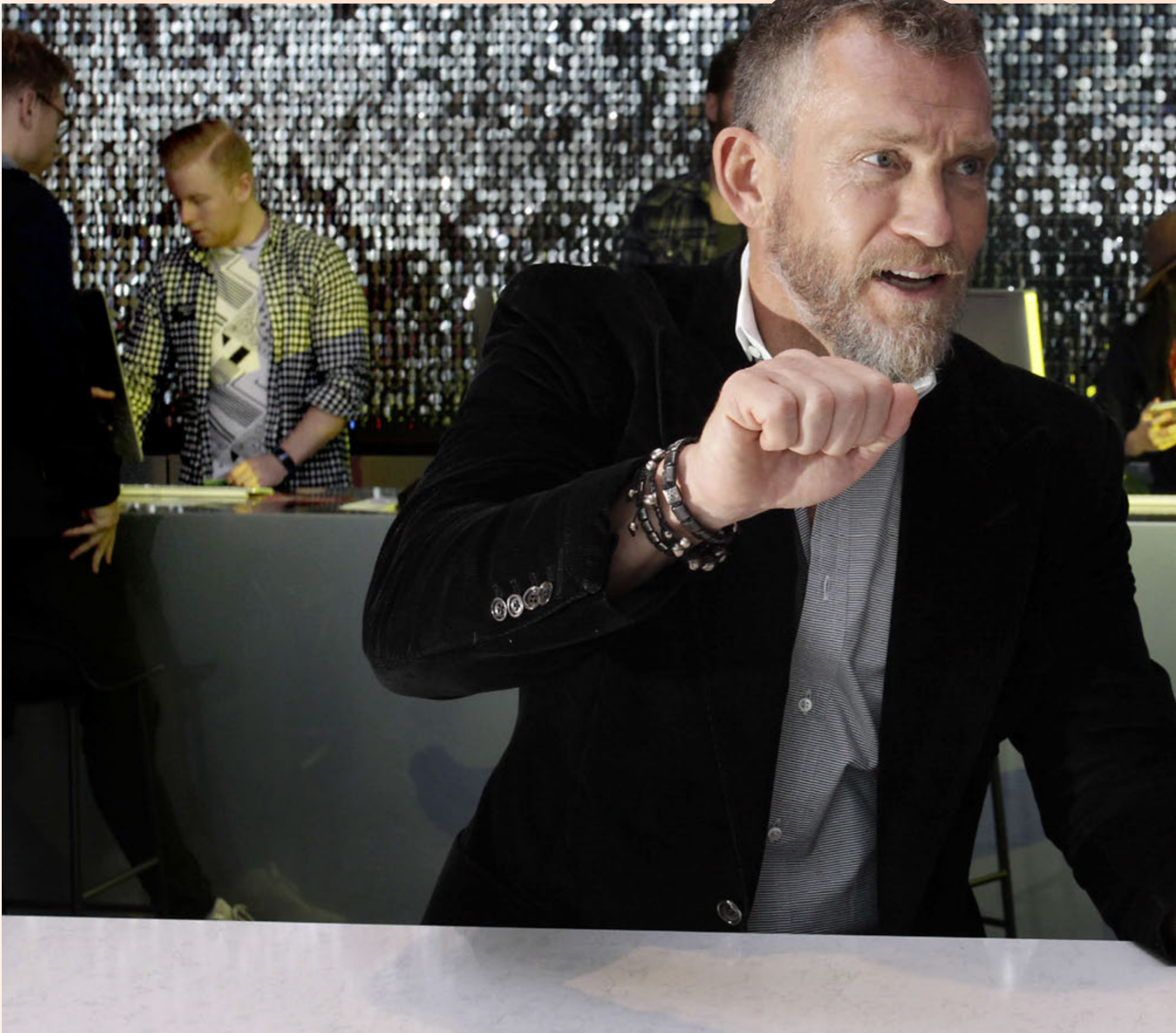
Björgólfur Thor Björgólfsson hóf fjárfestingarferil sinn sem frumkvöðull. Hann horfir nú aftur til upprunans og vill einbeita sér að því að búa til nýja hluti með skemmtilegu fólki.