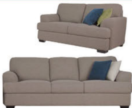
Calais 3 og 2 sæta sófar