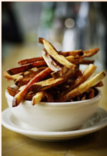
Samstaða er um að lækka tolla á frönskum kartöflum.