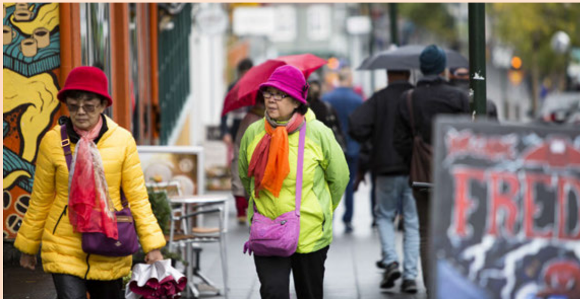
Capacent veltir þeirri hugmynd upp að hverjum ferðamanni verði skylt að dvelja í að minnsta kosti einn mánuð á Íslandi til að takmarka innstreymi erlends gjalddeyrir og ofris krónunnar.

Meðalfjöldi starfa hjá móðurfélaginu var 249 á árinu 2015, samanborið við 270 árið áður. Heildarlaun og þóknarir til stjórnenda samstæðunnar á árinu 2015 námu 1,3 milljónum dollara, tæplega 149 milljónum króna. – sg