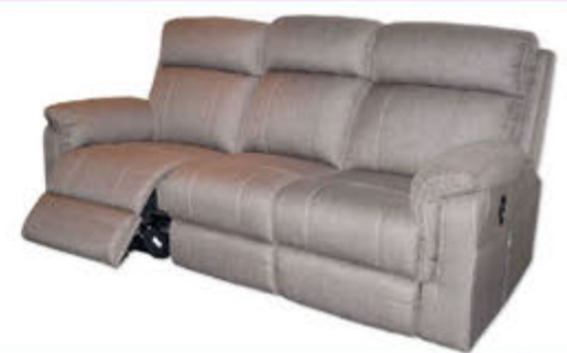
Bronson rafdrifinn hægindasófi