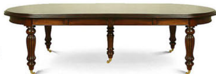
Flute Leg borðstofuborð