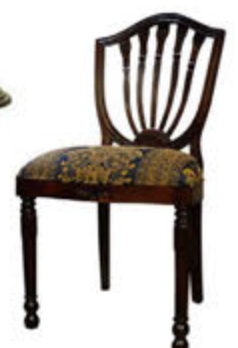
Hyper Wide stóll