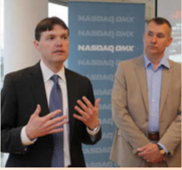
Fyrsti dagur Regins í Kauphöllinni.