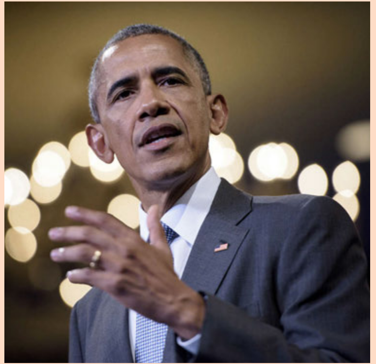
Utanríkisstefna Baracks Obama Bandaríkjaforseta í peningamálum er talin valda verðhjöðnun með því að neyða ríki til stífari peningamálstefnu.

Suður-Kórea öll núna með verðbólgu vel undir tveimur prósentum (sem er verðbólgu markmið seðlabanka bæði Suður-Kóreu og Japans) og þess vegna eru góð rök fyrir því að öll löndin þrjú ættu að hafa lausbeisladri peningamálstefnu og þar af leiðandi veikari gjaldmiðla en nú er raunin.