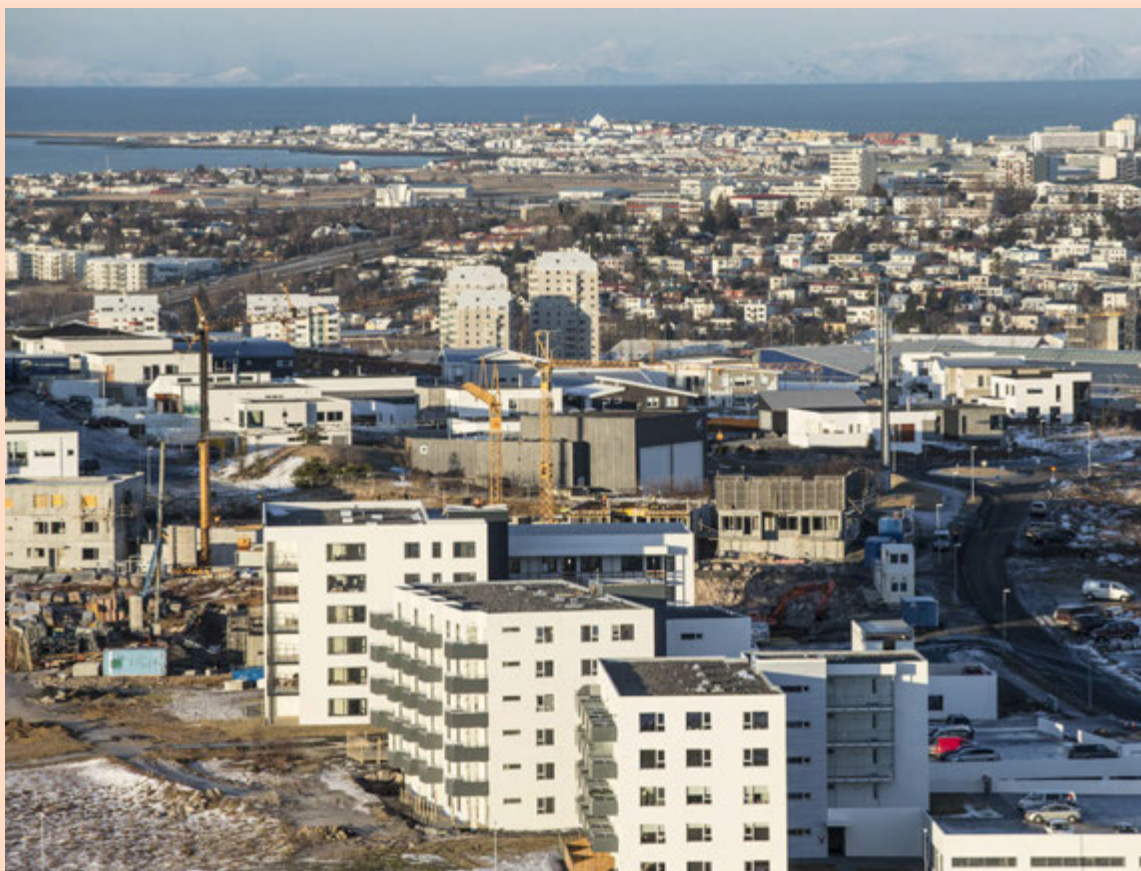
Samkvæmt lýsingu Íbúðalánasjóðs á eignasafninu eru 2/3 af eignunum í þéttbýli á suðvesturhorninu. Moody's telur að sala eignanna muni styrkja stöðu Íbúðalánasjóðs og styrkja afkomu á næstu árum.

Netfang auglýsingadeildar auglysingar@markadurinn.is Veffang visir.is