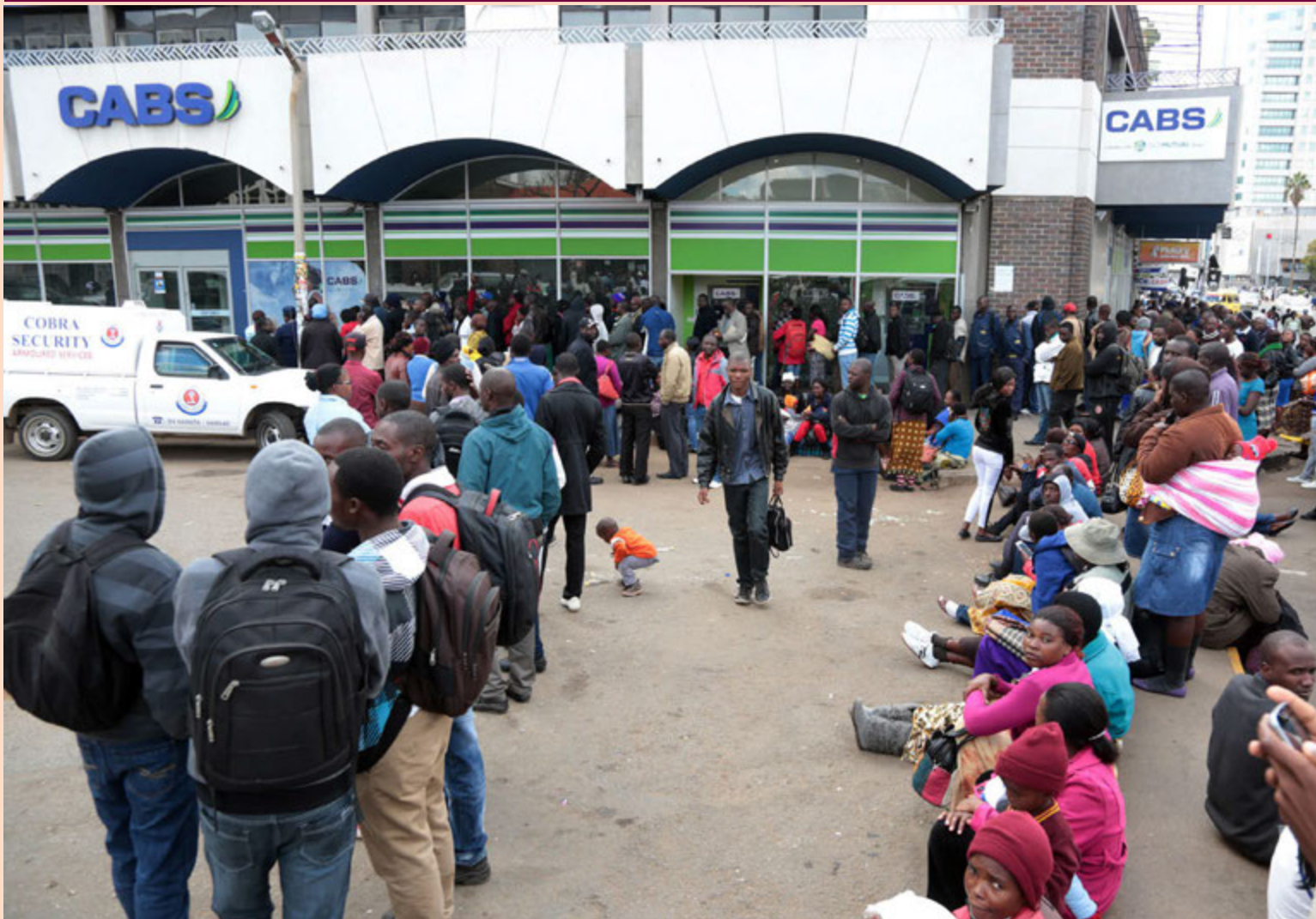
Mikill skortur er á reiðufé í Simbabve. Viðskiptavinir þurfa að standa í löngum röðum við banka til þess að taka út peninga. Sumir bankar gefa ekki út meira en sem nemur 50 Bandaríkjadöllum á dag. Seðlabanki landsins mun eysa vandann með því að gefa út skuldabréfi í október.