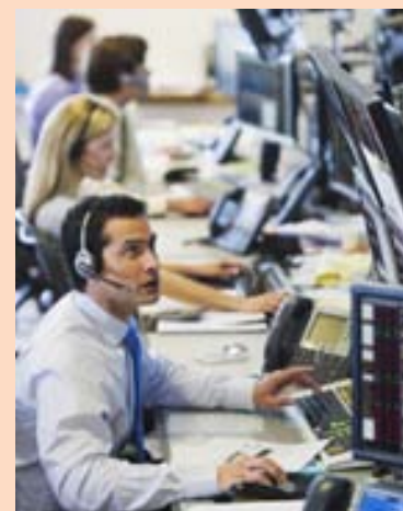
Á WALL STREET AGS telur hagkerfið standa frammi fyrir hættu.