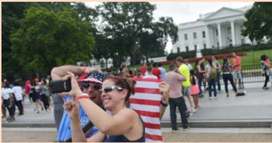
Í HÁTÍÐARSKAPI Bandaríkjamenn héldu þjóðhátíðardag sinn hátíðlegan á laugar- daginn. Heimildir herma að stjórnarskrá Bandaríkjanna hafi ekki verið undirrituð fyrir en 2. ágúst 1776, þótt lokið hafi verið að skrifa hana 4. júlí sama ár. Því eru skiptar skoðanir á því hvort 4. júlí sé rétti dagurinn fyrir Banda- ríkjamenn að fagna.