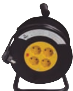
Kapalkefli 15 mtr 4.190