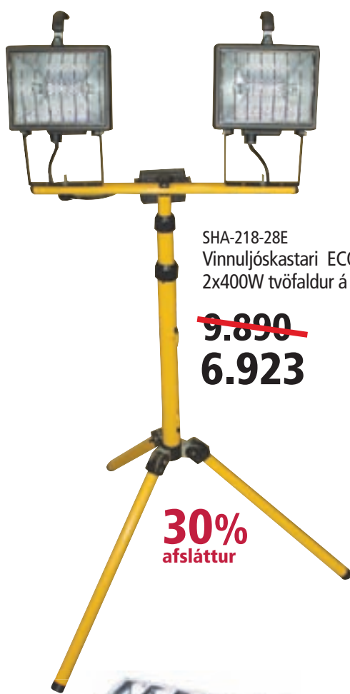
SHA-218-28E Vinnuljósastari ECO perur 2x400W tvöfaldur á fæti