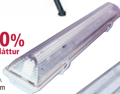
LG118C T8 lampi Loftljós flúor rakap. 1x18w 67,5x11,2cm