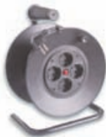
Kapalkefli Wis-SCR2-30 30 metrar 4.890

Reykjavík Kletthálsi 7 Opið virka daga kl. 8-18, laug. 10-16 Reykjanesbær Fuglavík 18 Opið virka daga kl. 8-18