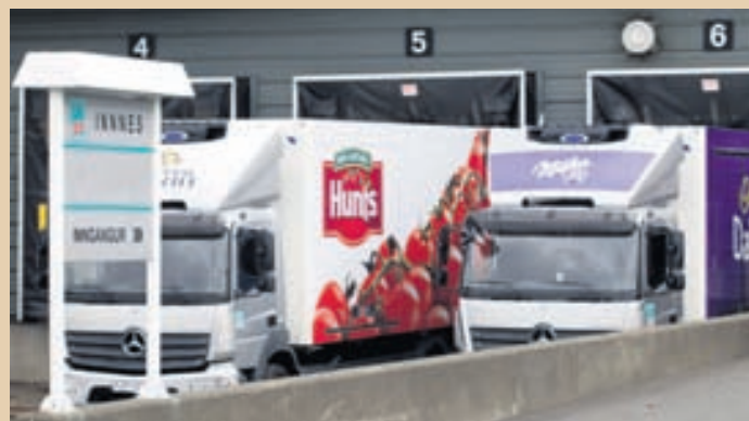
KEYPTU BÚR Heildverslunin Innnes keypti Búr. Tilkynnt var um sölu um miðjan síðasta mánuð.

Samkaup hf., Kaupfélag Vestur-Húnavetninga og Kaupfélag Steingrímsfjarðar seldu Innnesi um miðjan september hlut sinn í Búri ehf., dótturfélagi Samkaupa. Búr ehf. var stofnað árið 1995 og sérhæfir sig í innlendum og innfluttum vörum á ávaxta- og grænmetismarkaði. Í tilkynningu vegna kaupanna sagði að Búr ehf. byði upp á yfir 400 vörulíði að staðaldrí í ferskum ávöxtum og grænmeti. Íslensk framleiðsla nemur um þriðjung af sölu fyrirtækisins.