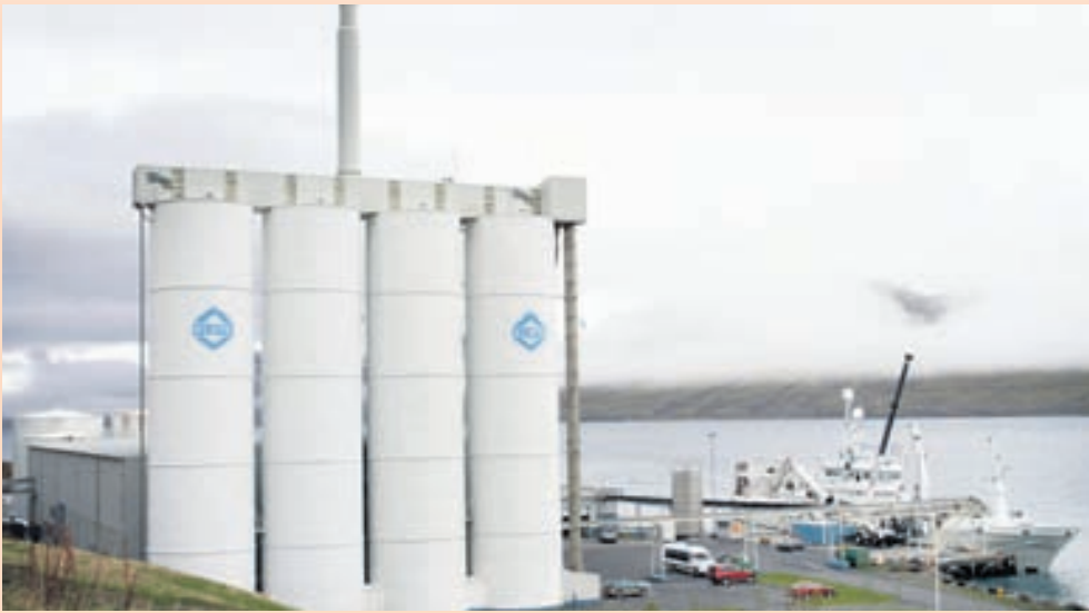
LOÐNUVINNSLAN Stærsta eign Kaupfélags Fáskrúðsfirðinga er Loðnuvinnslan.

► bréf í Icelandair fyrir 11 milljónir króna að nafnverði, en sá hlutur var liðlega 200 milljóna króna að markaðsvirði við áramót. Einnig á KEA hlut í Högum sem var um 116 milljón krónur að markaðsvirði við áramót. Í ársreikningi kemur fram að rekstur KEA var með svipuðu móti á síðasta ári og á árinu 2012. Hagnaðurinn nam 226,7 milljónum króna í fyrra, en hann var tæplega 279 milljónir króna árið á undan.