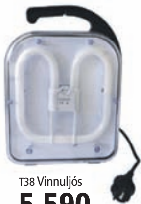
T38 Vinnuljós 5.590