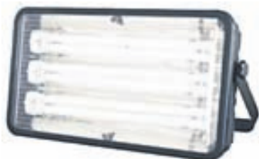
SHA-8083 3x36W Halogen