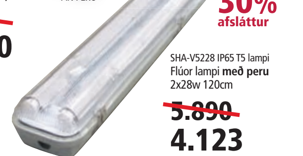
SHA-V5228 IP65 T5 lampi Flúor lampi með peru 2x28w 120cm