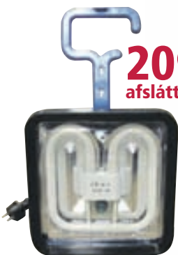
SHA-2625 Vinnuljósastari Rone 28W m. innst. blár. 1,8m snúra