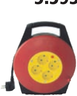
Kapalkefli 10 mtr 2.990