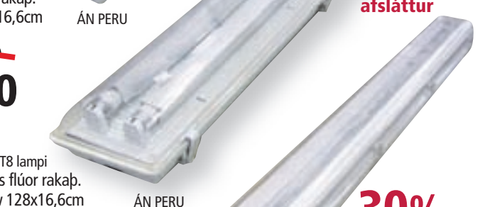
LG236 T8 lampi Loftljós flúor rakap. 2x36w 128x16,6cm