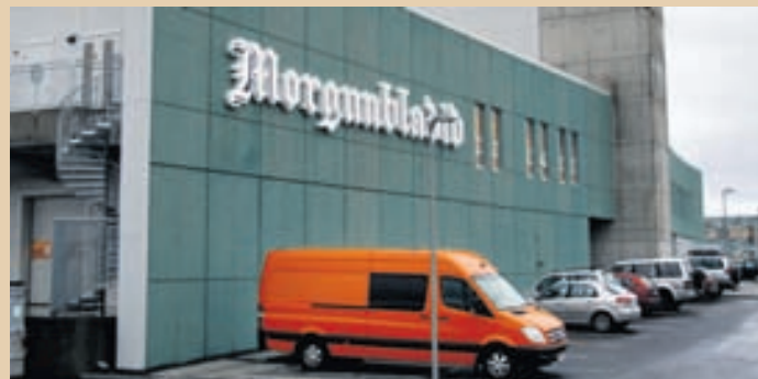
ÁRVAKUR Útgáfufélag Morgunblaðsins er að hluta til í eigu Kaupfélags Skagfirðinga í gegnum eignarhaldsfélagið Þórsmörk.