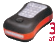
Gemstone LED ljós f/rafhlöður