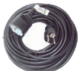
15 metra rafmagnssnúra 3.190