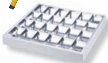
Ryco LDL-MD418A lampi m. grind 4x18W T8 62x60x8 cm með perum