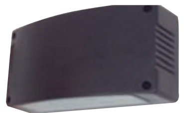
26W Vandað svart ál útiljós 36x17cm m/sparperu