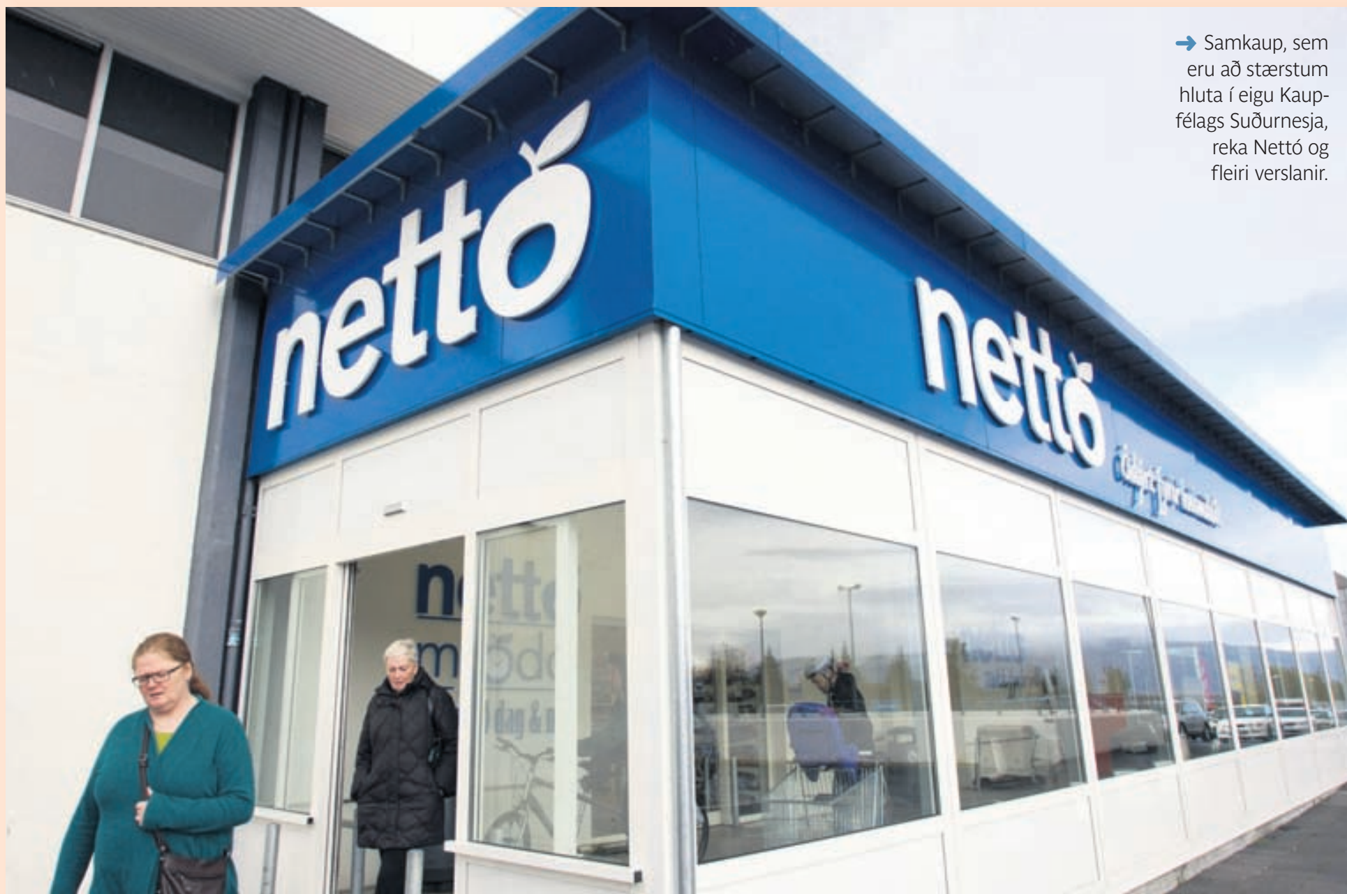
NETTÓ Kaupfélag Suðurnesja er stærsti hluthafinn í Samkaupum sem meðal annars reka Nettó.