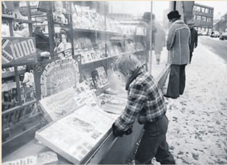
GÆGIST INN UM GLUGGAN Útvegsspilið, sem sést í glugganum, naut mikilla vinsælda hér á landi um árabíl.