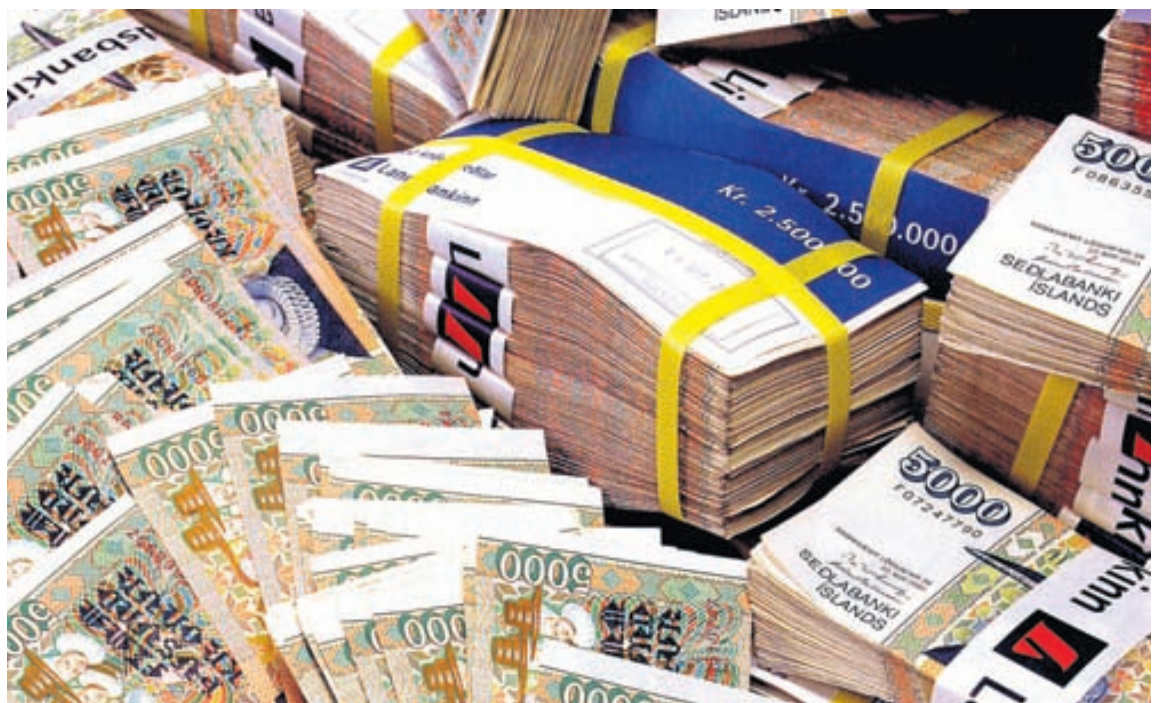
GJALDEYRISHÖFT Segja má að gjaldeyrishöftin hafi verið sett á til að milda höggið af bankahruninu. Nú ríður hins vegar á að losa höftin.