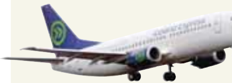
EIFENDUR ICELAND EXPRESS HAFU KEYPT TVÖ DÖNSK FLUGFÉLÖG Danska flugfélagið Sterling og Maersk velta um 60 milljörðum króna og flytja fimm milljónir farþega á ári.