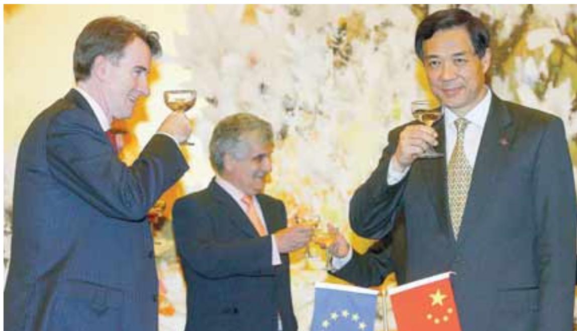
PETER MANDELSON SKÁLAR VIÐ VIÐSKIPTARÁÐHERRA KÍNA Mandelson er framkvæmdastjóri viðskiptamála hjá Evrópusambandinu og réttlætir háa tolla á kínverskar útflutningsvörur með því að ekki enn sé markaðshagkerfi í landinu.

Eftir að hann lagðist í helgan stein einbeitti Rockefeller sér að góðgerðastörfum og gaf stærstan hluta auðæfa sinna til hinna ýmsu málefna. Rockefeller lést í Flórída árið 1937. -jks