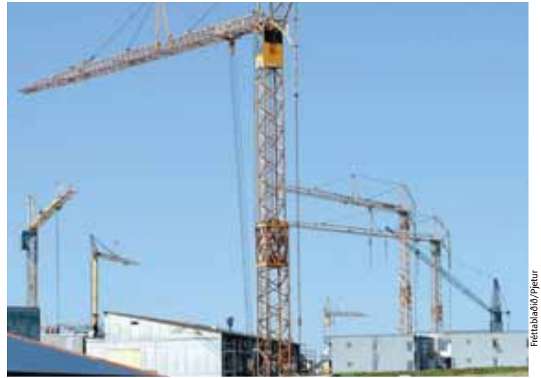
SÝNILEGUR HAGVÖXTUR Miklar byggingaframkvæmdir á höfuðborgarsvæðinu munu leggja sitt af mörkum til hagvaxtarins á þessu ári.

Í efnahagsfregnum greiningardeildarinnar kemur samt fram að flest bendi til þess að hagvöxtur verði töluverður á þessu ári. Það muni eiga sérstaklega við þegar framkvæmdir við byggingu nýs álvers á Reyðarfirði hefst og stækkun álversins á Grundartanga fari á fullt. Einnig séu gífur-