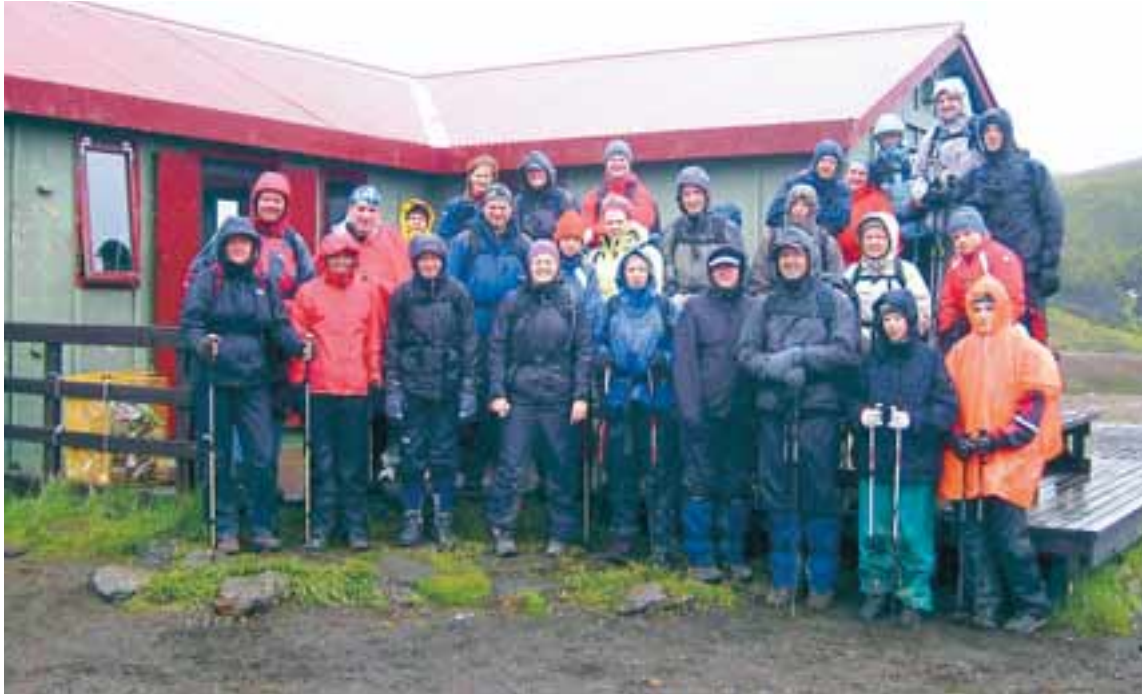
ALLIR KLÁRIR Í GÖNGU Hópurinn að leggja af stað frá Álftavatni.

27 manna hópur tók þátt í fyrstu árlegu MBA-göngu Háskólans í Reykjavík. Haldið var í Landmannalaugar þar sem var tjaldað. Eftir kvöldmat skellti hópurinn sér í laugina. Daginn eftir var haldið niður í Álftavatn þar sem gisti var í skála. Ekki viðraði vel á hópinum því rok og rigning var næstum allan tímann en gleði og góð stemning ríkti í hópunum. Daginn eftir var haldið í Emstur þar sem var tjaldað. Þriðja daginn var ljómandi veður með smá skúrum og lá leiðin inn í Bása í Þórsmerkur. Háskólinn í Reykjavík bauð svo svöngum ferðalöngum í grillveislu um kvöldið og haldið var á brennu.