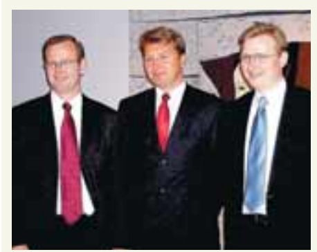
ÍSLANDBANKI HEFUR BYGGT UPP STARFSEMI Í NOREGI MEÐ YFIRTÖKUM Á ÖÐRUM SMÆRRI BÖNKUM Stjórnendur BNbank, Kreditbanken og Íslandsbanka.