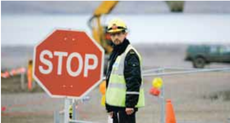
STOPP Í SKAGAFIRÐI Vinstri grænir í Skagafirði eru ekki hrifnir af því að fá álver í héraði með spjöllum á náttúrunni sem slíki framkvæmd fylgir.

Pétur sér ekkert athugasvert við að löggjafinn skyldi sparisjóði til þess að gefa út og selja nýtt stofnfé á genginu einum þegar markaðsvirði er á sama tíma hærra. Það sé þó ákveðin kvöð fyrir stofnfjáreigendur að nýta sér forkaupsrétt sinn því annars kaupir aðrir forkaupsréttarhafar bréfin og græði mismuninn á markaðsverði og nafnverði.