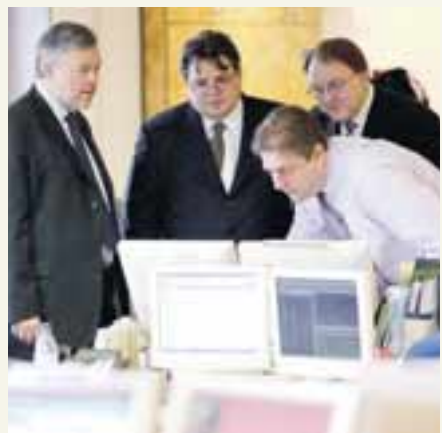
KYNNTU SÉR STARFSEMI BRESKA VERÐBRÉFAFYRIRTÆKISINS TEATHER & GREENWOOD Stjórnendur Landsbankans skoða hvað þeir fengu fyrir sinn snúð.