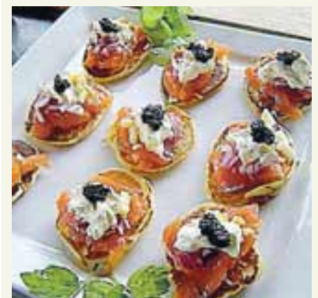
RÚSSNESKAR PÖNNUKÖKUR Franska matvæla-fyrirtækið Labeyrie, sem er í eigu SÍF, framleiðir meðal annars rússnesku pönnukökurnar Blini.

þar meðal annars. Eitt sem einnig verður að hafa í huga er að lítil vöxtur er í Evrópu og samdráttur á helstu mörkuðum. Mikil svartsýni ríkir á hagvöxt komandi ára og halda flestir að sér höndunum vegna varkárni og svartsýni.