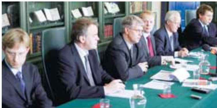
EINKAVÆÐINGARNEFND Næstu tvær vikurnar mun nefndin skoða eignatengsl innan fjárfestahópna.

SingStar er með tveimur míkrofónum sem tengdir eru sjónvarpi og PlayStation-tölvu og fá svo flytjendur stig í takt við árangur sinn í söngnum. Nýjasta útgáfan gefur keppendum kleift að horfa á sjálfa sig syngja. -dh