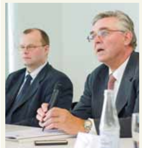
DANSKI BANKINN FIH KOSTAÐI 84 MILLJÖRÐA Stjórnendur KB banka og FIH kynna kaupin.