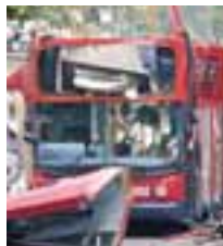
HRYÐJUVERK Þúsundir strandaglópa áttu ein-skis annarra úrkosta en að eyða nóttinni á hótélum í kjölfar hryðjuverkanna í Lundúnum.

Thistle Group-hótélkeðjan var ein þeirra sem sókuð var um verðhækkanir: „Við könnumst ekki við að hafa hækkað verð á gistingu í kjölfar harmleiksins,“ sagði talsmaður fyrirtækisins. - jsk