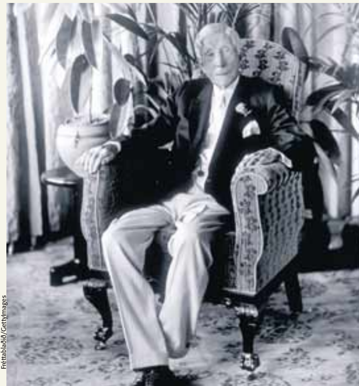
JOHN D. ROCKEFELLER Er líklega ríkasti maður sögunnar ef allar breytur eru teknar með í reikninginn. Gaf mestan hluta auðæfa sinna til góðgerðarmála.

Mandelson segir Kínverja vissulega stefna í átt til markaðsbúskapar en telur þá ekki komna á leiðarenda: „Ríkið truflar enn þá eðlilegan gang hagkerfisins. Það er nauðsynlegt að beita viðskiptahindrunum þegar verið er að selja vöru undir kostnaðarverði“.-jks