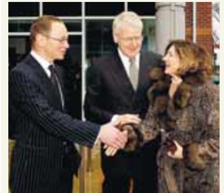
FORSETI ÍSLANDS VÍGDI NYJAR HÖFUÐSTÖÐVAR EXCEL AIRWAYS Í LONDON Nýlega bætti félagið svo þremur breskum ferðaskrifstofum í safnið.