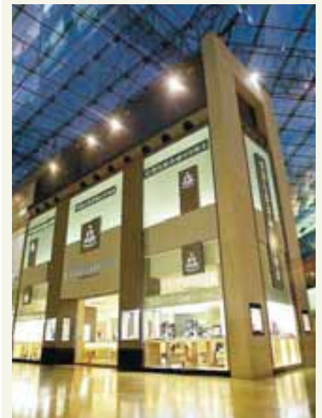
GOLDSMITHS VERSLUN Skartgripakeðjan er í eigu Baugs og fleiri íslenskra aðila.