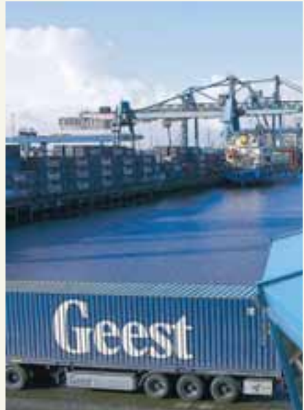
TVÖ ÍSLENSK SKIPAFÉLÖG HÖFÐU ÁHUGA Á GEEST Samskip tvöfaldaði veltu sína með kaupum á hollenska skipafélaginu Geest.