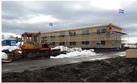
Þessi viðbygging við Hótel Brunnhól var sett upp með einingahúsum frá IDEX fyrir á þessu ári.

Umhverfisvænt og auðvelt „Það er líka mikill sveigjanleiki