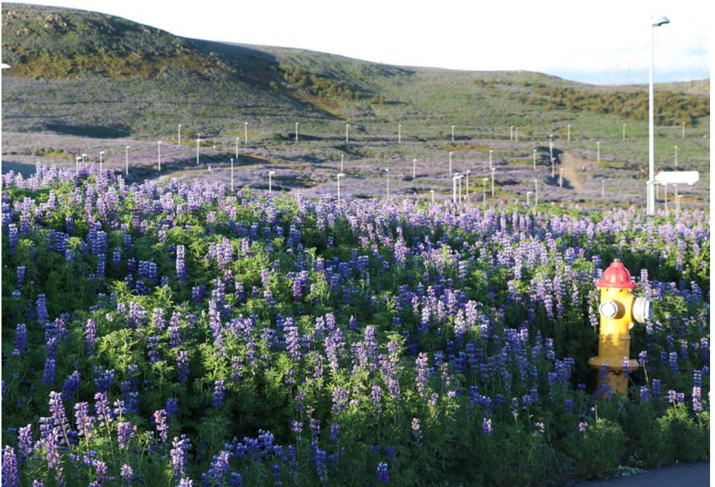
Skarðshlíð hallar mót suðri og er því skjól fyrir norðan- og austanáttum og hún er algjör náttúruparadís. Hverfið samanstendur af blandaðri byggð, fjölbýlishúsum, rað-, par- og einbýlishúsum.