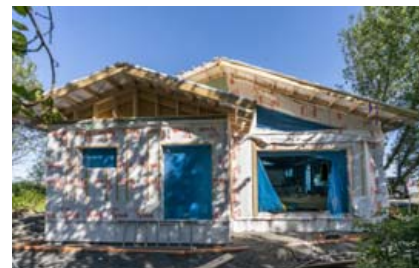
Kaupendur geta komið með teikningar af draumahúsinu og fengið tilboð frá Jötunn byggingum í smiðina.