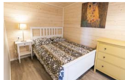
Svefnpláss er fyrir fjóra í tilbúnu húsunum.