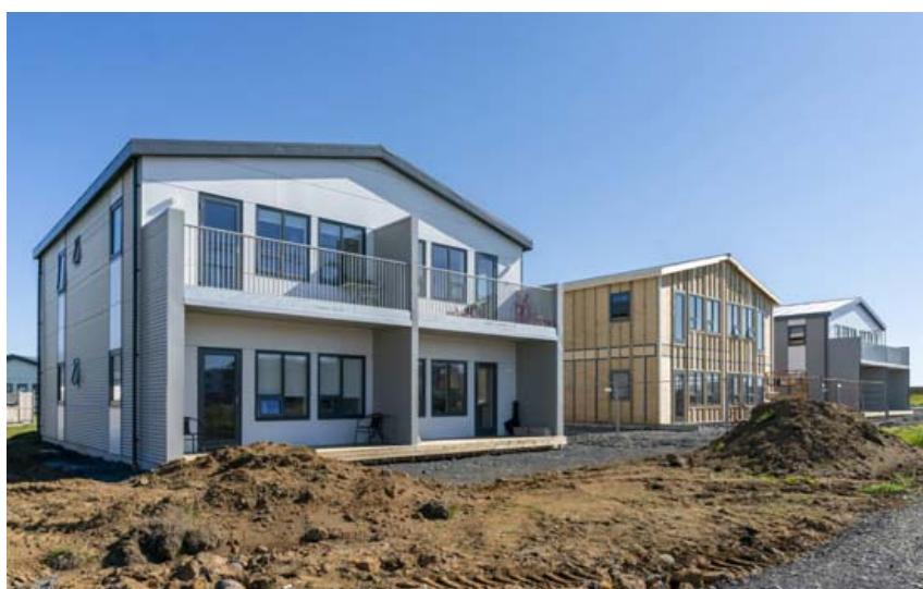
SG einingahús eru af ýmsum stærðum og gerðum og þeim er skilað að ósk kaupandans ýmist foheldum eða fullbúnum.