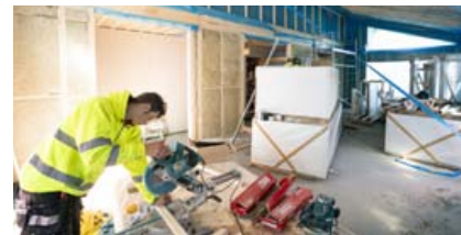
Jötunn byggingar sjá um alla vinnu við uppsetningu húsa, og samskipti við byggingafulltrúa fyrir kaupendur.