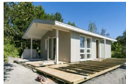
Húsin eru öll hönnuð af Íslendingum fyrir íslenskar aðstæður. Sýningarhús eru uppsett á Selfossi.