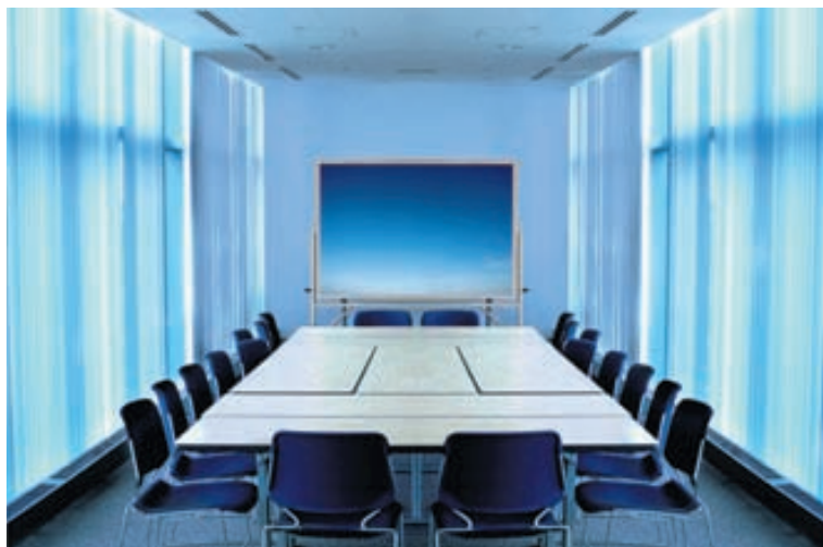
Í þessu fundarherbergi er allt í röð og reglu, eins og vera ber. Þannig á að vera ástatt um flestallt sem varðar aðbúnað, hollustuhætti og öryggi á vinnustöðum.