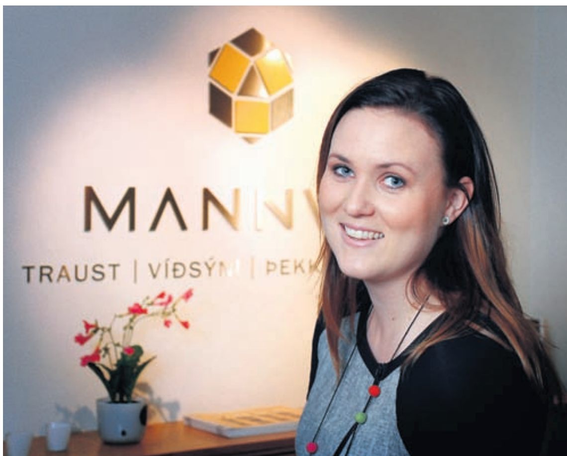
Mannvit hefur lengi lagt mikla áherslu á vinnuvernd og öryggismál, bæði innan fyrirtækisins og í tengslum við þau verkefni sem stofan vinnur hverju sinni.

„Tilnefningin tengist bæði því góða starfi sem fram hefur farið hér innan húss hjá okkur og þeim verkefnum sem við höfum unnið að víða um land. En fyrst og fremst er viðurkenningin fyrir það vinnuverndarstarf sem er til staðar í fyrirtækinu. Hjá Mannviti hefur yfirstjórn fyrirtækisins og starfsfólk þess verið virkir þátttakendur í vinnuverndarmálum í mörg ár. Starfsmenn okkar hafa líka verið duglegir að bera út boðskapinn með þjónustu sinni og ráðgjöf. Við bendum viðskiptavinum okkar á hvað skiptir máli og hvað má betur fara. Þannig skiptir máli að vera til fyrirmyndar og slíkur hugsunarháttur smitar út frá sér.“ Mannvit verður tilnefnt í flokki fyrirtækja með 100 starfsmenn eða fleiri og munu úrslit liggja fyrir í apríl 2013.