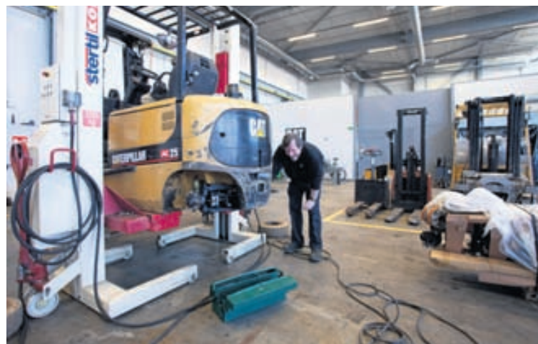
Verkstæðið hjá Kletti í Klettagörðum 8-10.

á gömlum grunni. Starfsfólkið hefur áralanga reynslu á þessu sviði. „Við bjóðum einungis þekkt gæðamerki eins og Caterpillar lyftara og vinnuvélar, Scania vörubíla, Ingersol Rand loftpressur og Goodyear-Dunlop hjólarða svo eitthvað sé nefnt.“