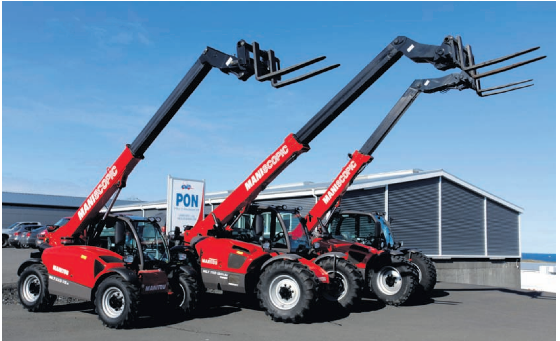
Manitou skotbómulyftarinn hentar vel til byggingarframkvæmda, við lestun og losun vöruflutningabíla og löndun sjávarfangs.

Gaffallyftarar, dísel- og rafmagnslyftarar, sérhannaðir lyftarar og vöruhúsatæki.