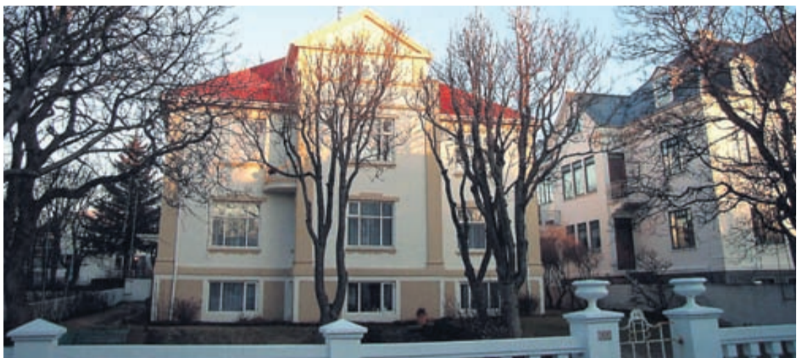
Húsið á Sólvallagötu 14 er höfðinglegt.

Ingólfur Gissurarson lfg. Valhöll fasteignasala • Síðumúla 27 • Sími:588-4477.