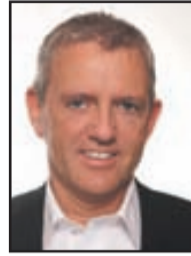
Valur Sölufulltrúi GSM: 857 9550