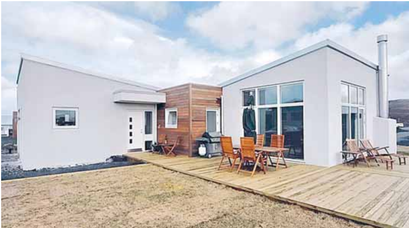
Fjólúvellir 3 er fallegt hús með 80 fermetra sólpalli.