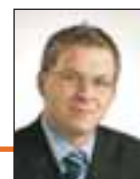
Ástþór Sólumaður S. 898-1005