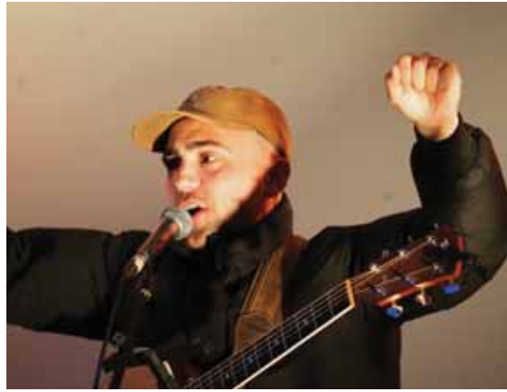
Stórsöngvarinn Friðrik Dór stóð fyrir sínu.