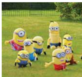
Myndasýrpu má finna á bls. 7.

æingar flykkjast heim aftur til að taka þátt í fjölbreyttri dagskrá með heimafólki og hitta gamla félagi og vini. Ein aðalástæðan fyrir Töðugjöldunum í Rangárþingi ytra er að sem flestir taki þátt með sínum hætti og á sínum eigin forsendum,“ segir Eggert Valur Guðmundsson, oddviti Rangárþings ytra.