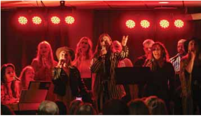
Tónleikarnir Raddir úr Rangárþingi fóru fram á fimmtudagskvöldi á Stracta Hótel Hellu.