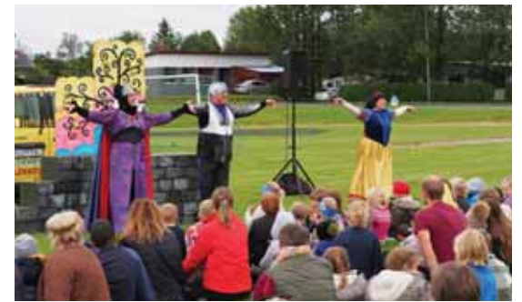
Leikhópurinn Lotta mætti á svæðið og hélt sýningu.