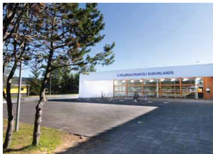
Fjölbrotaskóli Suðurlands.