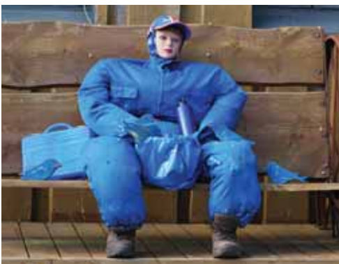
Hverfin voru skreytt eftir litum græn/appelsínugult, rautt, blátt, gult og fjólublátt.