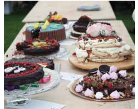
Hnallþórukeppnin var æsispennandi og var gríðarlega góð þátttaka.