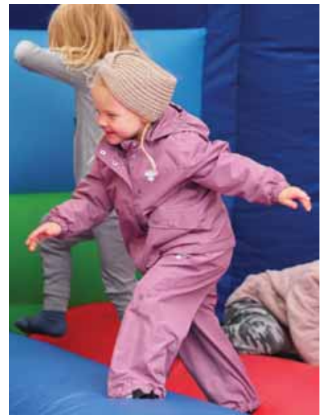
Hoppkastalarnir voru vinsælir.