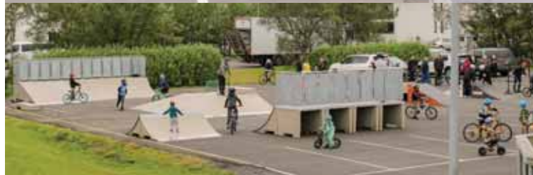
Brettagarður var opnaður á Hellu og er hann staðsettur við ífróttahúsið á Hellu. BMX Brós komu og héldu sýningu og kennslu sem var virkilega vel sótt.