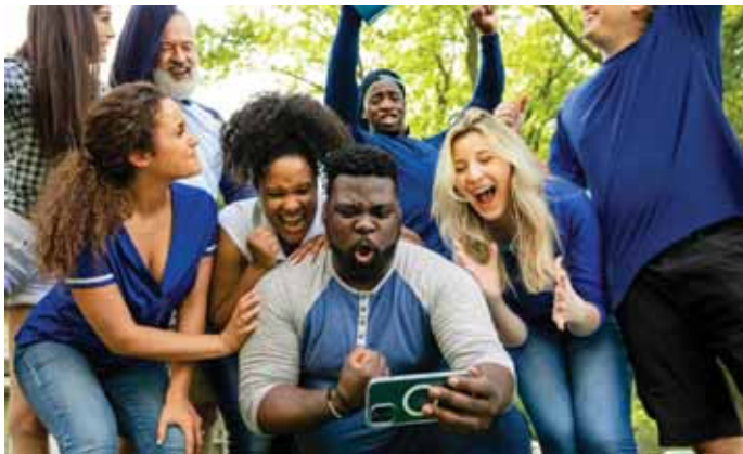
Ætluð viðbrögð íbúa fyrir fregnunum.

Nú hafa Stokkseyri, Eyrarbakki, Þorlákshöfn, Hveragerði, Hvolsvöllur og Vík bæst í hóp þeirra bæjarfélaga sem hafa aðgang að 5G neti og mörgum bæjarbúum stendur því til boða áður óþekktur nethraði. Nova hefur frá upphafi verið í farabroddi í innleiðingu nýjustu tækni og er komið lengst í uppbyggingu 5G á Íslandi. Nú hafa 65 sendar þegar verið settir upp í öllum landshlutum og er áætlað að þeir verði orðnir 200 árið 2024.