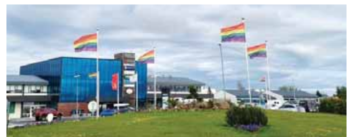
Fánarnir við hringtorgið á Hellu.

Matgæðingar eru beðnir að senda á dfs@dfs.is uppskrift ásamt mynd af sér eigi síðar en á mánudegi.