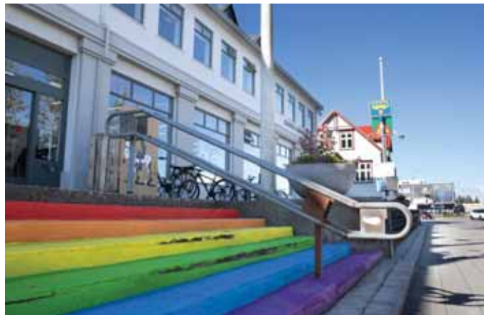
Ráðhúströppurnar á Selfossi í regnbogalitunum.