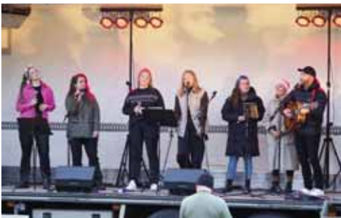
Eftir frábæra tónleika á fimmtudagskvöldi komu Raddir úr Rangárþingi aftur fram á kvöldvöku Töðugjalda á laugar dagskvöldi.