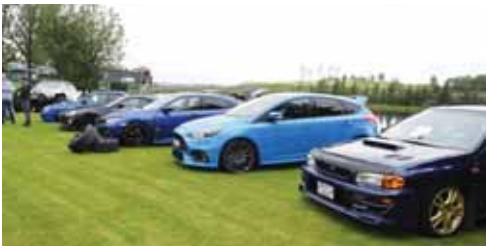
Bílasýning Flugbjörgunarsveitarinnar á Hellu var glæsileg að vanda.