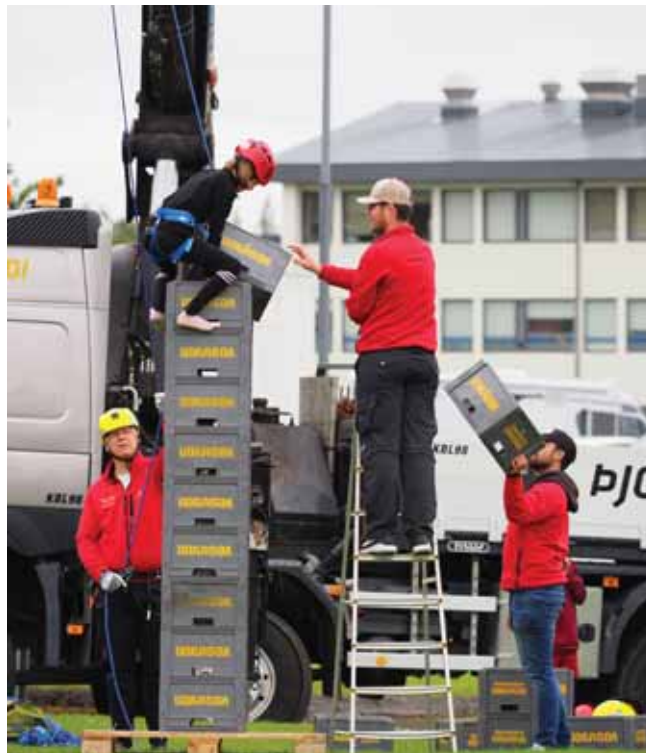
Kassaklifur Flugbjörgunarsveitarinnar á Hellu var vel sótt.