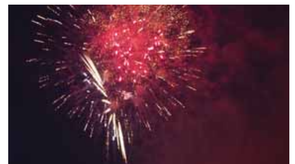
Flugeldasýningin á Töðugjöldum var sú magnaðasta sem menn muna eftir. Það var Þjóandi sem styrkti flugeldasýningu á Töðugjöldum 2022.