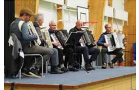
Harmonikkusveit Suðurlands spilaði í ífróttahúsinu um leið og öllum íbúum var boðið til morgunverðar af fyrirtækjum á svæðinu.