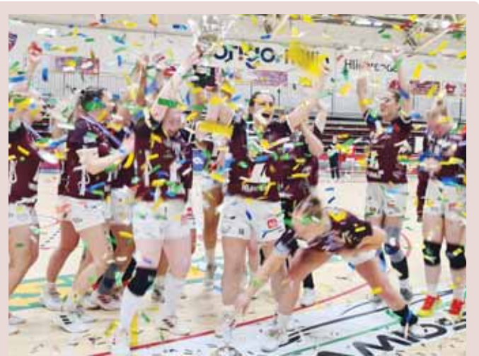
Selfyssingar fögnuðu innilega þegar titillinn var í höfn.

Viðburðurinn markar tímamót í áframhaldandi vinnu með Græna iðngarða (Eco Industrial Parks), sem á mikið erindi við græna orkunotendur Íslands, ekki síst í dreifðum byggðum landsins.