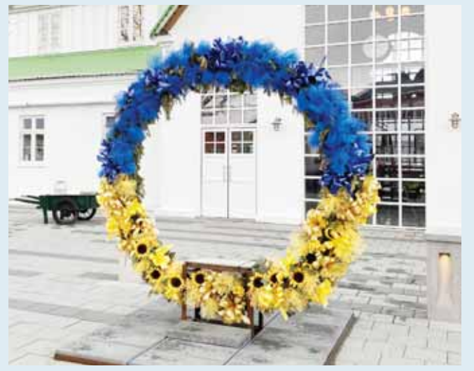
Þennan fallega blómakrans í úkraínsku fánalitunum má finna bakvið Mjólkurbúið Mathöll.