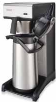
Bravilor TH Frábær uppáhellingarvél með vatnstanki.