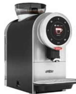
Bravilor Sprso Handhæg og öflug baunavél sem hentar smærri fyrirtækjum.

Nánari upplýsingar veitir sölufólk okkar í síma 580 3900