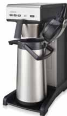
Bravilor THa Frábær uppáhellingarvél með vatnstengi.