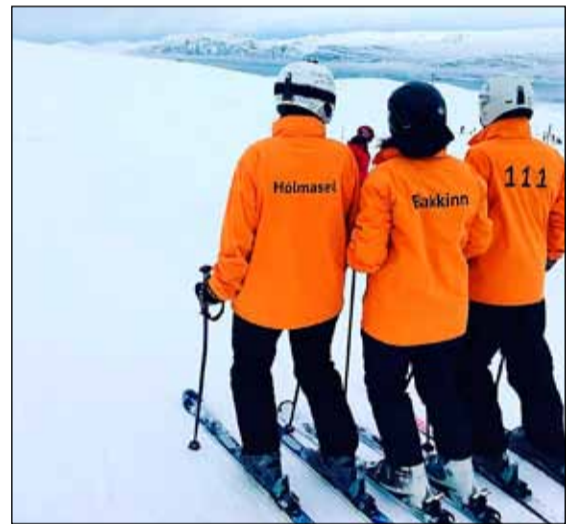
Gott skíðafæri skapaðist í snjókomunni á dögum. Krakkarnir slepptu ekki tækifærinu.

Það sem er á dagskrá á komandi vikum og mánuðum er ekki af verri endanum og eru starfsmenn félagsmiðstöðvanna ekkert smá spennt að keyra þetta allt í gang. Við erum að tala um sitjandi, standandi og flakkandi viðburði eins og söngvakeppni og hæfileikakeppni Breiðholts, skíðaferð, Samfestinginn, landsmót Samfés, skólaböll, fjölbreytt hópastarf og svo auðvitað allar þær liflegu og skemmtilegu opnanir félagsmiðstöðvanna með tilheyrandi dagskrá að hætti unglínganna í hverfinu. Við hlökkum svo sannarlega til að sjá alla aftur samakomna og sameinaða í félagsmiðstöðvum Breiðholts.