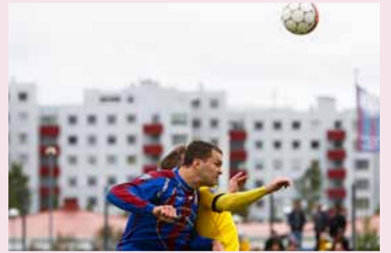
Tekist á á Leiknisvelli.

Leiknir hefur óskað eftir því að Reykjavíkurborg sýni stuðning við tillögu félagsins með viljayfirlýsingu um uppbyggingu á gervigrasvelli í stað aðalvallar og svo í framhaldi eða samhliða yfirbyggingu yfir stæði við aðalvöll sem væri fyrir að minnsta kosti 280 til 300 manns. Í