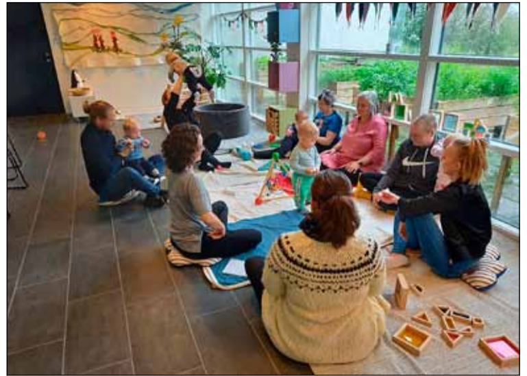
Fjölskyldumorgnarnar eru vaxanfi þáttur í félagsstarfinu í Gerðubergi. Hér eru foreldrar og börn á einum þeirra.

nefnist „Inni- og útifjör“ og er í umsjón tveggja íþróttakennara. Í stuttu máli stendur það námskeið fyllilega undir nafni, er bæði fjörugt og heilsueflandi. Þá fær Gerðubergskórinn okkar styrk úr „Heita pottinum“ og eigum við líklega von á góðum vortónleikum. Kórinn býður nýliða velkomna, fleiri raddir eru vel þagnar. Það er svo margt skemmtilegt framundan hjá okkur í félagsstarfinu, að ég þarf að senda þér kæra Breiðholtsblað aftur nokkrar línur þegar