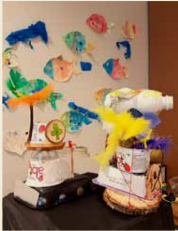
Að ýmsu þarf að hyggja við flokkun úrgangansins.

Við í frístundaheimilunum höfum verið að leggja aukna áherslu á flokkun á sorpi og aðra þætti sem eru jákvæðir fyrir umhverfið. Við leggjum okkur fram við að stunda vistvæn innkaup á þeim vörum sem við kaupum inn. Þetta er líka kjörrið tækifæri fyrir okkur á frístundaheimilunum til að kenna börnunum hvernig við hugsum betur um umhverfið. Það er mikilvægt að auka umhverfisvitund þeirra. Það er hægt að gera á margan skemmtilegan hátt. Það er hægt að fara út og hreinsa nærumhverfið sitt með því að tyna rusl (plokka) og jafnvel hægt að gera skemmtilega keppni milli barnanna úr því. Við höfum líka endurnýtt umbúðir og annað með því að fönndra úr þeim efnivið sem annars færi í ruslið. Það er hægt að nálgast frekari upplýsingar um Grænu skrefin á síðunni: https://graenskref.reykjavik.is/