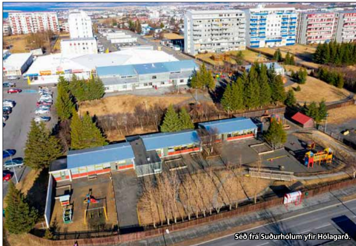
Séð frá Suðurhólum yfir Hólagarð.

sjá nánar á facebook.com/Systrasamlagid Netverslun: systrasamlagid.is