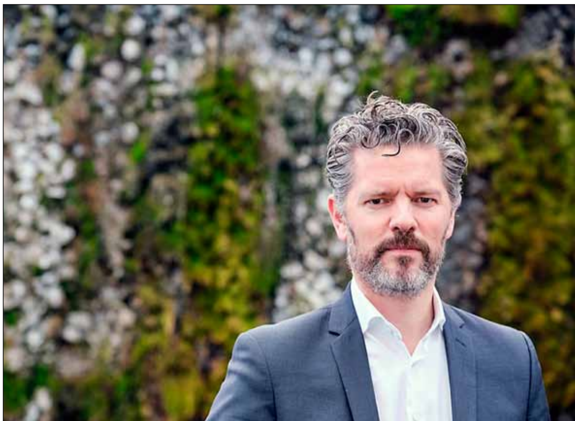
Dagur B. Eggertsson borgarstjóri.

„Það er sannarlega hægt að dást að þessu hverfi og í hvert skipti sem ég kem þangað sé ég eitthvað nýtt. Við höfum verið með sérstaka áherslu á Breiðholtið undanfarin ár, með alls konar umbótum, með því að koma Fab Lab fyrir í Breiðholti en nær okkur í tíma