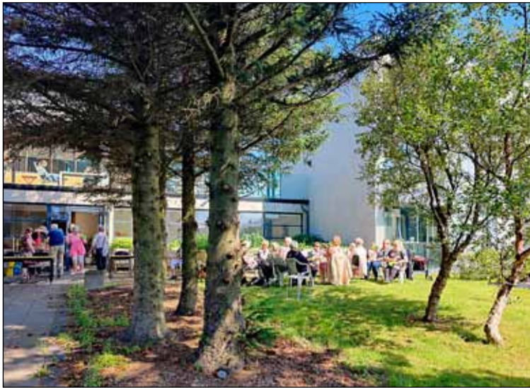
Garðveisla í félagsstarfinu í Gerðubergi.

Eins og flestum er kunnugt hafa breytilegar fjöldatakmarkanir vegna Covid sannarlega sett svip sinn á starf fjölskyldumiðstöðvarinnar. Starfsfólk, leiðbeinendur og þátttakendur í starfsemi hafa tekið því með jafnaðargeði þegar þurft hefur að fresta eða jafnvel aflýsa viðburðum og dagskrárliðum til lengri eða skemmri tíma. Sama var upp á teningnum þegar veður og færð tóku að hefta aðgang okkar að fjölskyldumiðstöðinni hér í „efri byggð“, við tókum því með miklu æðruleysi (og hetjuskap), enda rættist mjög fljótlega úr málum. Ég veit, ég veit, einhverjum kann að finnast fyndið að ég nefni þetta. Hef t.d. heyrt Norðlending segja að við Reykvíkingar vitum ekki hvað ófærð og veðurteppa sé. Rætt var einmitt um það hér í félagsstarfinu á dögum af miklu raunsæi, að við séum orðnir góðu vanir, Reykvíkingar, enda nokkuð langt síðan að snjóaði eitthvað að ráði hér í bænum. Raunar kom í ljós, að við munum betur allt það sem á góðviðrisdaga okkar hefur drifið. Hvað um það, við ráðgerum að hreyfa okkur og dansa fram í bjartari