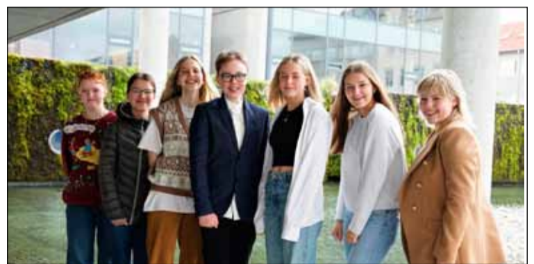
Fulltrúar ungmennaráða sem sóttu fund borgarstjórnar.

Í greinargerð segir að meðvitund um málefni kynsegin einstaklinga í samfélaginu hafi farið vaxandi síðustu ár og meðfram henni skapast umræða um þá útilokun sem kynjavíhyggja hefur í för með sér. Þessi tvíhyggja birtist á