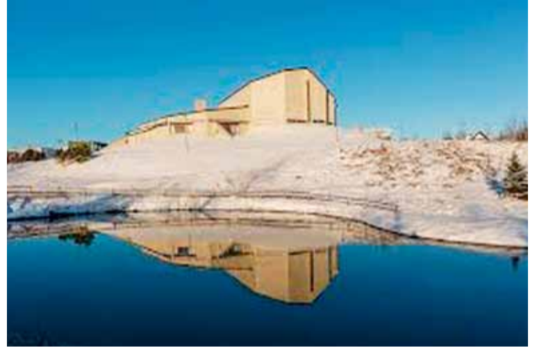
Fella- og Hólakirkja.

Gestum verður svo boðið að syngja með í nokkrum lögum sem hefur mælst vel fyrir á fyrri tónleikum kórsins. Tónleikarnir eru liður í fjáröflun kórsins fyrir Skotlandsferð sem fyrirhuguð er í september. Fyrir 2.500 krónur