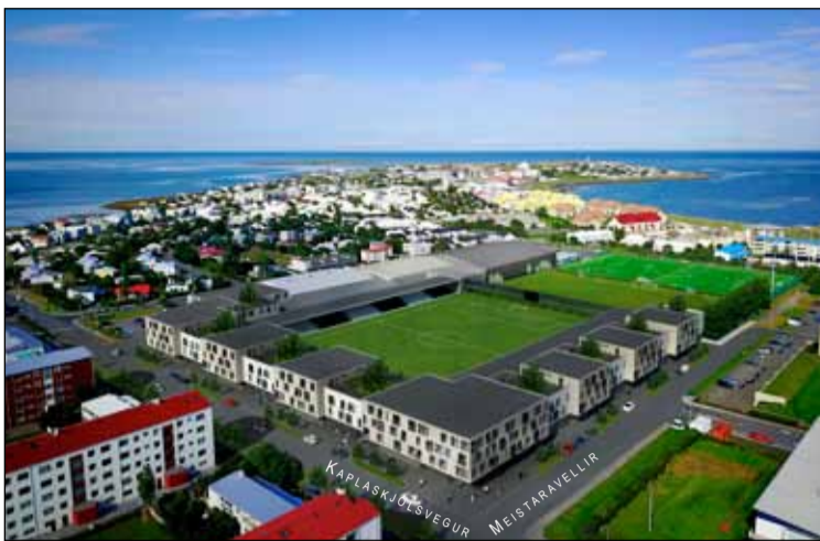
Hugmyndir um nýtt skipulag á KR-svæðinu frá 2017.

Öllum þessum árum síðar hefur starfsemi KR tekið miklum breytingum og talsverðum framförum. Ekkert hverfisíþróttafélag innan Reykjavíkur býður uppá samskonar úrval íþróttageirna. Samt sem áður er fasteignamat íþróttamannvirkja hvergi lægra en í Vesturbæ Reykjavíkur. Hverfiskiþróttafélag gefur til kynna að þátttaka barna í íþróttastarfi sé hvergi lægri en hjá KR – nema þá í Breiðholti. Borgin hefur þó brugðist við stöðunni í Breiðholti með verulegri uppbyggingu íþróttamannvirkja fyrir ÍR. Nú hlýtur röðin að vera komin að KR.