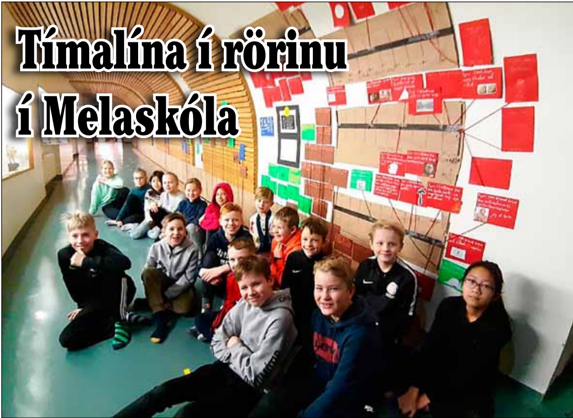
Nemendur við tímalínuna í rörinu í Melaskóla.

Fimmti SL bekkur í Melaskóla ákvað að gera tímalínu frá upphafi alheims og fram á okkar dag. Leyfi fékkst til að nota rörið eða Undirgöngin milli skólanna eða rörið eins og þau eru jafnan kölluð voru notuð til þess að setja línuna upp sem nýtti nær alla lengd þeirra. Hver metri táknaði einn milljarð ára eða þúsund milljónir ára. Tímalínan var því 13.8 metra löng. Hver sentimetri sýndi því tíu milljónir ára og einn millimetri eina milljón ár.