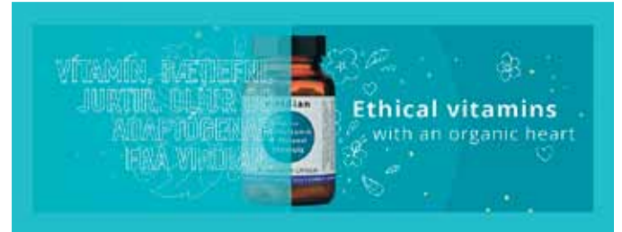
Mikið úrval. Einstök gæð. Sterk siðvitund.