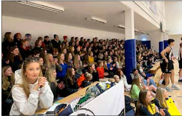
Áhugasamir krakkar fylgjast með á Való - Hagó deginum.

Dagurinn hófst á íþróttakeppni í íþróttamiðstöð Seltjarnarness þar sem lið skólanna áttust við í hinum ýmsu kappleikjum. Eftir tveggja tíma hasar stóðu leikar þannig að Hagaskóli hafði sigrað þrjá viðburði en Valhúsaskóli sigraði tvo. Seinni hluti keppinnar var haldinn um kvöldið í Hagaskóla. Þar mættust ræðulið skólanna sem höfðu verið miklum tíma í undirbúning ræðukeppni. Umræðuefni kvöldsins var „List er hætt að vera frumleg“ Hagaskóli mælti með en Valhúsaskóli á móti. Ræðukeppnin var afar spennandi og allir ræðumenn stóðu sig með mikilli þryði. Meðan beðið var eftir úrslitum hófst sameiginlegt ball skólanna þar sem rapparinn Flóni tróð upp við mikinn fögnuð. Það var