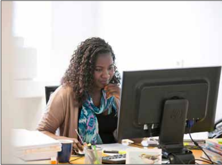
Við vinnu á lögmannsstofunni.

hjalpað að ég er óhrædd við að gera kröfur og setja mig í óþægilegar aðstæður. Ég er mjög ánægð að hafa fengið tækifæri til þess að taka þátt í umræðu um það sem ég hef áhuga á. Ekki síst umræðu um umhverfismál, mannréttindi og stjórnmál.”