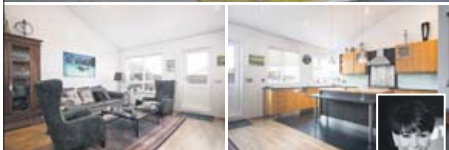
HRINGIÐ OG BÓKÍÐ SKOÐUN S.820-2222 Herbergi: 6 Stærð: 200,4 m 2

Fallegt og mjög gott endaraðhús á tveimur hæðum með bílskúr og góðum garði með heitum potti, útirturtu, aflokuðum veröndum og skjólveggjum á þessum vinsæla stað í Ásahverfi Garðabæjar. Um er að ræða gott fjölskylduhús með sérsmíðuðum innréttingum, góðri loft hæð, gólfhitu á neðri hæð, 4 svefnherbergjum, sjónvarps-höli og rúmþóðu eldhúsi. Eignin er skráð skv F.M.R 200,4fm og þar af er bílskúr 28,5fm. Gótt fjölskylduhús á eftirsóttum stað.