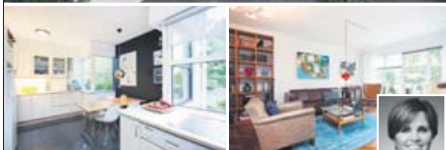
OPÍÐ HÚS þriðjudaginn 31. júlí kl. 17.30-18.00 Herbergi: 5 Stærð: 172,8 m 2

Fallegt og vel skipulagt endaraðhús á einstaklega rölegum og góðum stað innanlega í botnlanga. Um er að ræða raðhús á tveimur hæðum með glæsilegum og skjólgeðum garði til suðurs. Búíð er að endurnýja baðherbergið og nýlega búíð að skipta um gler á suður- og vesturhlíð. Húsið er skráð 172,8 fm samkvæmt F.M.R. og þar af er bílskúrin er 22,6 fm. Eignin hefur fengið gott viðhald. Þetta er frábært fjölskylduhús þar sem stutt er í náttúruna, góðar gönguleiðir, sundlaug og ýmsa þjónustu.