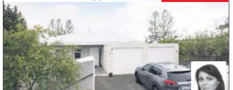
OPÍÐ HÚS mánudaginn 30. júlí kl. 17:30 - 18:00. Stærð: 177,4 m 2

Glæsileg efnir sérhæð með innbyggðum bílskúr innst í götu, gróinn og fallegur garður og stórar útsýnissvölur. Eldhús með fallegri innréttingu, stórar og bjartar stofur með mikilli loft hæð og útgengi á suður svölur með útsýni, 4 svefnherbergi og flislagð baðherbergi, sturtu og baðkar. Skjólgeð vernd til vesturs. Upplýsingar veitir Þóra fasteignasali í gsm: 822 2225