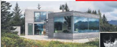
HRINGIÐ OG BÓKÍÐ SKOÐUN S. 820-2222 Herbergi: 4 Stærð: 106,3 m 2

Gullmóli við Þingvallavatni! Sérlega glæsilegt og vandað sumarhús byggt árið 2006. Húsið stendur á bóknum Þingvallavatns. Gólfstór gluggar, gólfhitu, glæsileg lýsing, mjög vandáðar innréttingar, heitir pottur, útirturtu, glæsilegur arinn og bátalægi. Allt innibú getur fylgt með sé þess óskað. Upplýsingar veitir Hafdis fasteignasali í gsm: 820 2222