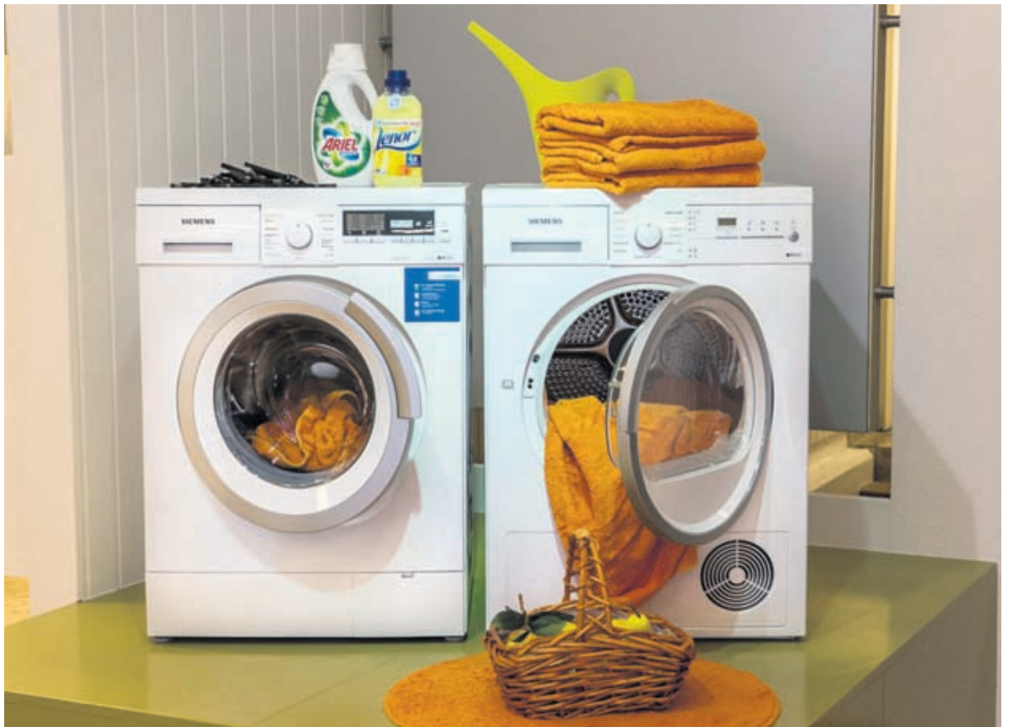
Ariel-fljótandi þvottaefni og Lenor-mýkingarefni fylgja með öllum Siemens-þvottavélum frá Smith & Norland.

Siemens i-Dos þvottavélin hefur algjöra sérstöðu því að hún skammtar þvottaefnið sjálf. Sérstakur nemi skynjar magn þess þvottar sem settur er í vélinu og einnig