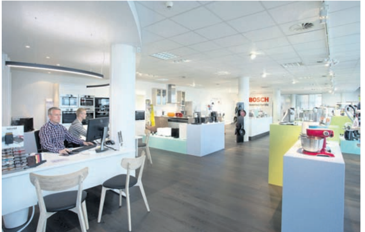
Bosch-búðin er glæsileg ný verslun með hágæðaheimilistæki frá Bosch. Verslunin er í Hlíðasmára 3 í Kópavogi og því vel staðsett á miðju höfuðborgarsvæðinu.