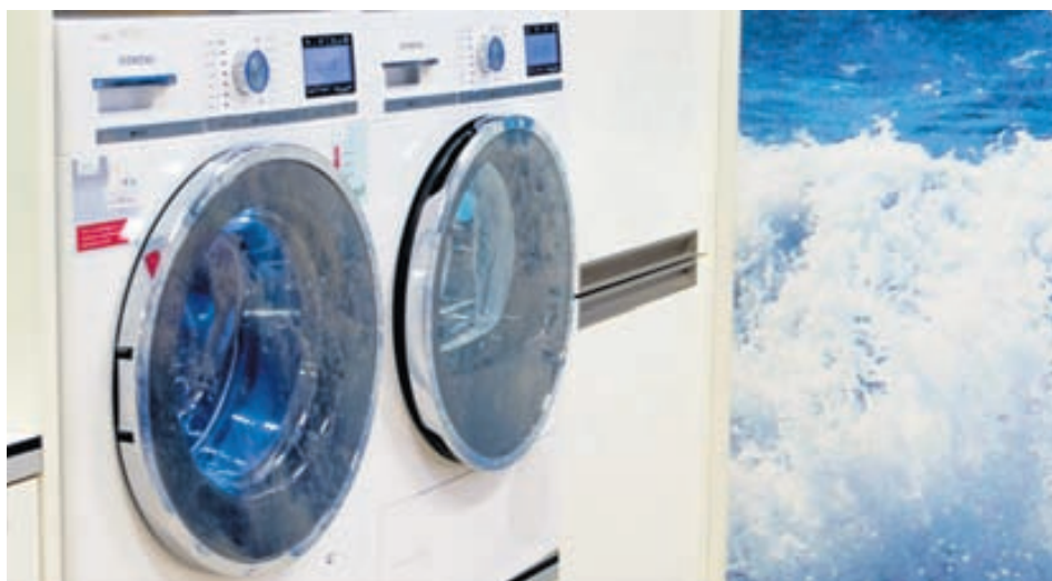
Siemens i-Dos þvottavélar eru gæddar þeirri sérstöðu að skammta sér þvottaefni sjálfar eftir að hafa numið magn þvottar, gerð efna hans og óhreinindastig.

óhreinindastig hans og gerð (bómull eða gerviefni). Hugbúnaður vélarinnar velur þvottaferil og magn þvottaefnis sjálfkrafa.