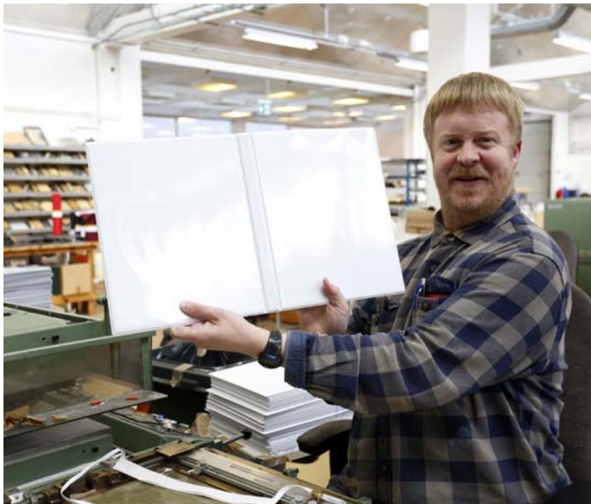
Á Múlalundi starfa dugmiklir einstaklingar sem framleiða gæðavörur sem notaðar eru víða um land.