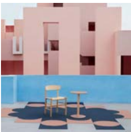
Inside Shapes frá sænska hönnunarstúdíóinu Form Us With Love. Þetta eru teppabútar sem hægt er að raða saman á mismunandi vegu til að búa til skemmtileg form og líti. Teppin eru hönnuð fyrir Shaw Contract.