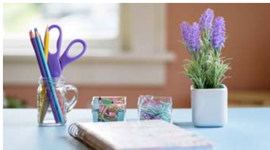
Fólki líður almennt betur í vinnunni ef inniloftið er í lagi og hitastigið rétt.

Upplýsingar fengnar m.a. af heimasíðu Vinnueftirlits ríkisins og Umhverfisstofnunar.