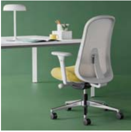
Lino, hannaður af Industrial Facility fyrir Herman Miller. Stóllinn er ætlaður bæði á skrifstofuna og á heimilið.