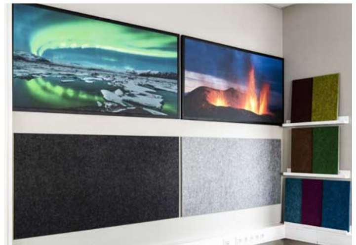
Hjá Hirzlunni er að finna skemmtilegar hljóðvistarlausnir sem henta fyrir skrifstofuna.