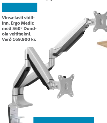
Vinsælasti stóllinn. Ergo Medic með 360° Dondola veltitækni. Verð 169.900 kr.