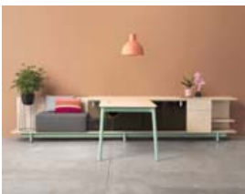
Woodstock skrifstofuhúsgögn hönnuð af Mark Müller fyrir Three H.