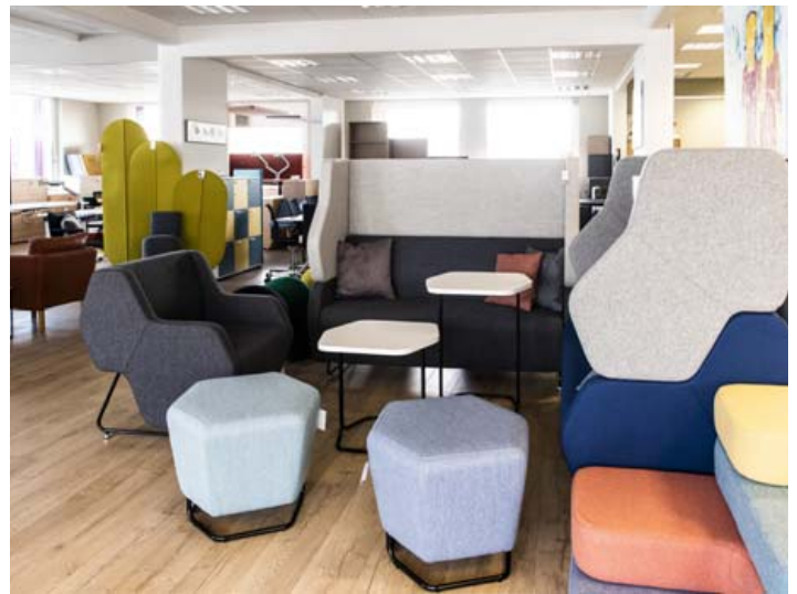
Úrvalið er mikið í Hirzlunni í Síðumúla. Hexa húsgögn eru til dæmis kjörin fyrir opin vinnurými.