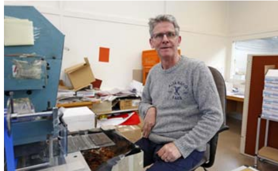
Á Múlalundi fær fólk sem hefur skerta starfsorku tækifæri til atvinnuþátttöku.