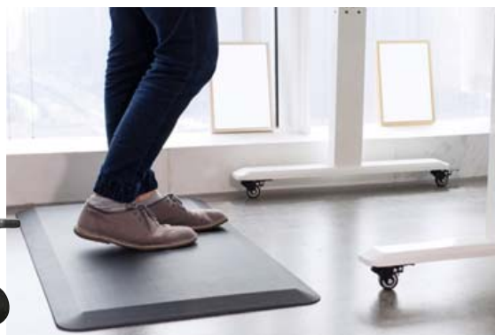
Gelmotta, verð 12.900 kr.