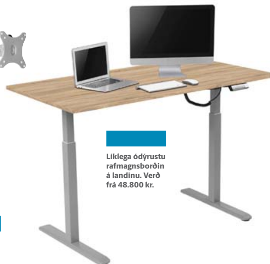
Líklega ódýrustu rafmagnsborðin á landinu. Verð frá 48.800 kr.