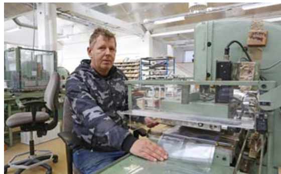
Vistvænt og endurnýtt plast er notað í framleiðsluvörur Múlalundar.