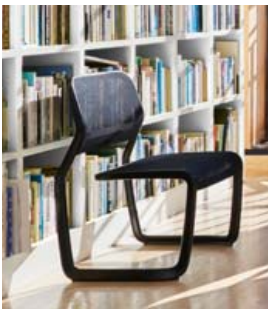
Newson Aluminium stóllinn eftir Marc Newson fyrir Knoll. Hinn ástralski Newson fékk innblástur frá Tugendhat stólinum eftir Ludwig Mies van der Rohe frá 1928 þegar hann hannaði þennan álstól.