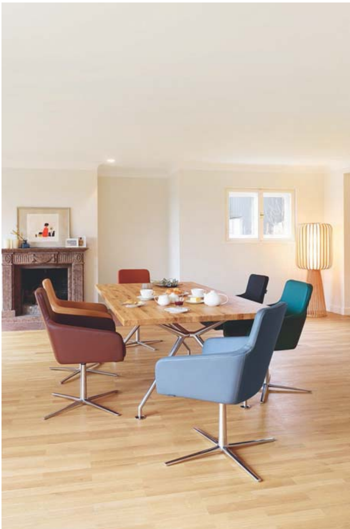
Fallegu gæðahúsgögnin frá Wagner henta mjög vel fyrir skrifstofuna eða heimilið.

Sjón er sögu ríkari. Í sýningarsal Hirzlunnar í Síðumúla má sjá úrval sýnis-horna. Til dæmis Wagner fundarborð og stóla eins og sjást á myndinni.