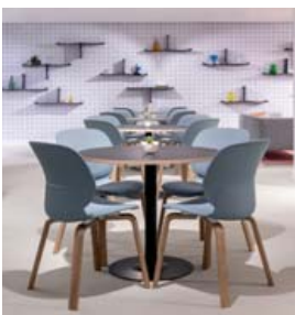
Maari stóllina eftir spænska hönnuðinn Patricia Urquiola sem hún hannaði fyrir Haworth.