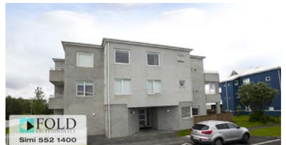
Ópið hús verður á morgun í Gullengi 1 í Grafarvogi.

Þegar inn er komið tekur við hol með fataskáp. Stofa og borðstofa í tveimur rýmum (sem gefur möguleika á að breyta í herbergi), útgengt er út á flísalagðar svalir, gott útsýni.