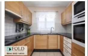
Fallegt eldhús er í íbúðinni.

Bílskúrinn er með vatni, hita og rafmagni. Gott geymslupláss. Í heildina falleg eign með góðu innra skipulagi.