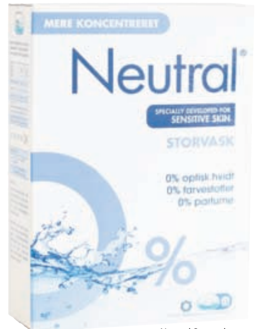
Neutral Storvask er gott þvottaefni fyrir allan þvott.