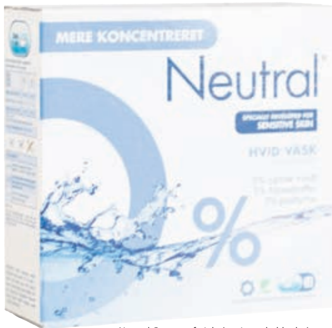
Neutral Compact fyrir hvítan þvott heldur hvítum og ljósum þvotti björtum og hreinum.