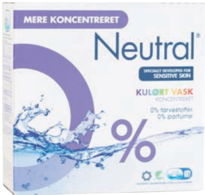
Neutral Compact fyrir litaðan þvott hreinsar burt blettina án þess að litirnir dofni.