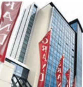
Grand Hótel er eitt þeirra fyrirtækja á Íslandi sem fengið hafa Svansvottun.