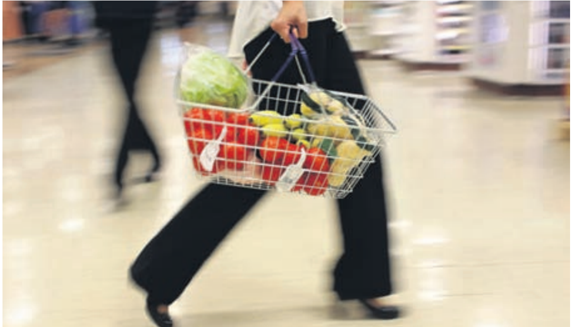
Fyrirtæki sem taka þátt í Innkaupanetinu fá upplýsingar og einfaldar leiðbeiningar um hvernig best er að bera sig að.

uð að leita til áhugasamra fyrirtækja. „Viðbrögðin hafa verið mjög góð og fyrirtækin sýna verkefninu mikinn áhuga. Í dag langar fjöldann allan af fyrirtækjum, sem eru að gera góða hluti í umhverfismálum, að gera starf sitt sýnilegra. Eins eru mörg fyrirtæki sem vilja vera umhverfisvæn