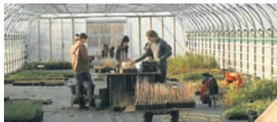
Erlendir sjálfböðaliðar að störfum á Sólheimum.

Sólheimar hafa tekið á móti evrópskum ungmennum á aldrinum 18-30 ára til að taka þátt í samfélagsverkefnum á Sólheimum. Markmið verkefnisins sem er styrkt af „Ungu fólki í Evrópu“ er að bjóða ungmennum að búa á Sólheimum og taka þátt í fjölbreyttu starfi í allt að tólf mánuði.