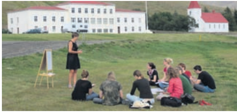
Erlendir Erasmus-nemar njóta kennslu í íslensku á Núpi í Dýrafirði í faðmi vestfirskra fjalla!

Listaháskóli Íslands hefur verið mjög virkur þátttakandi í Erasmus allt frá því að Ísland hóf þátttöku í áætluninni árið 1994 (þá Myndlista- og handiðaskóli Íslands). Miðað við stærð háskólans hefur þátttaka LHÍ verið margföld á við aðra háskóla. Árið 2012 var gerð úttekkt á framkvæmd Erasmus hjá íslenskum háskólum og kom LHÍ best úr úr þeim