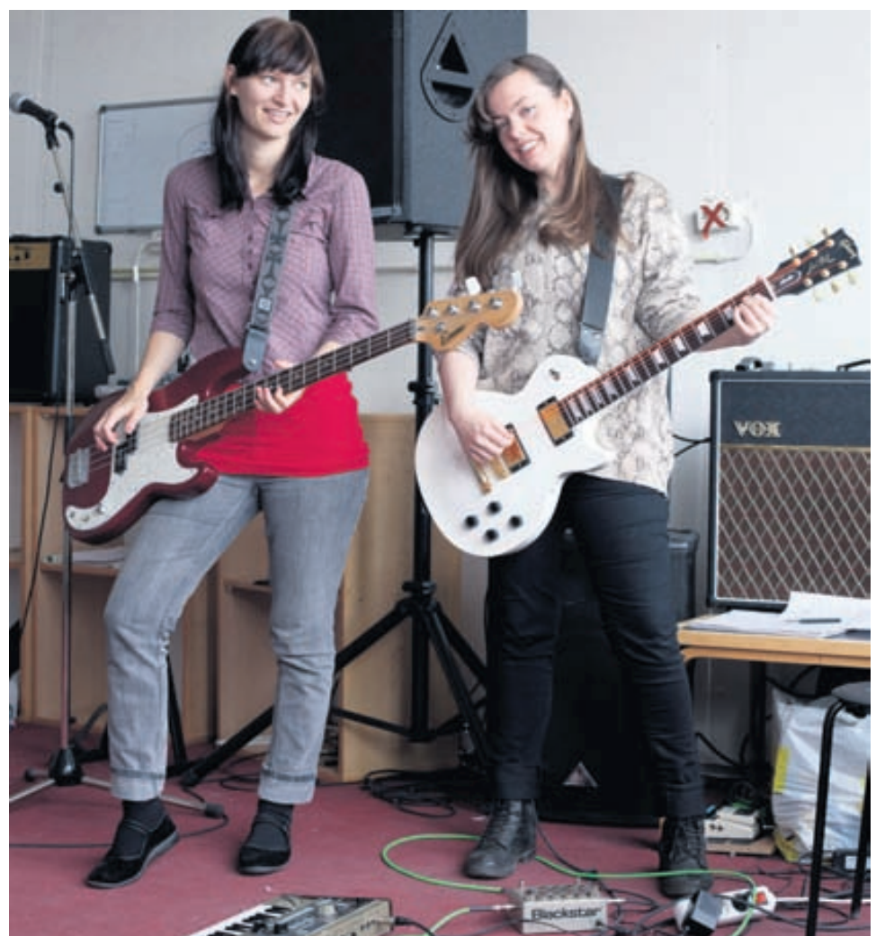
Langtímaaverkefnið með rokksumarbúðunum er að auka hlut kvenna í tónlistarbransanum.

Gestir uppskeruhátíðarinnar geta notið tóna frá þessum stúlkum en nokkrar þeirra troða upp í Hafnarhúsinu kl. 14.00. Sjón og heyrn er sögu ríkari!