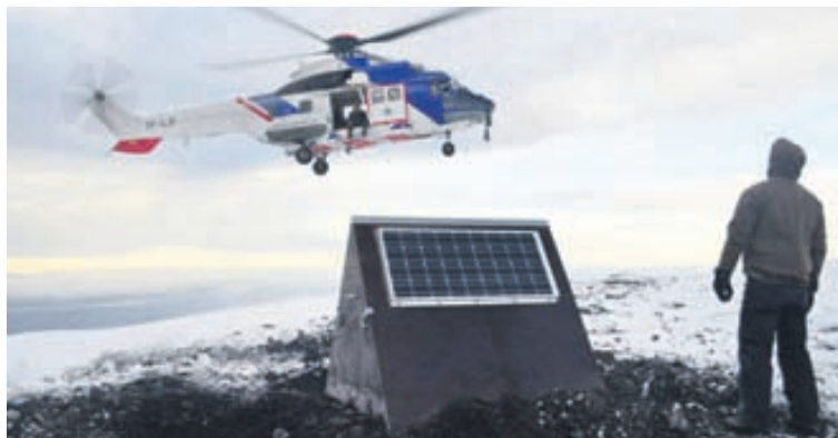
Eldgosið í Eyjafjallajökli var kveikjan að verkefninu.

Það eru Jarðvísindastofnun Háskólans, Veðurstofa Íslands, Almannavarnadeild Ríkislögreglu-