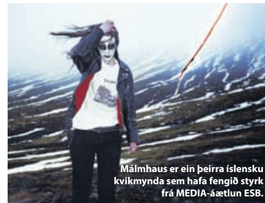
Málmhaus er ein þeirra íslensku kvikmynda sem hafa fengið styrk frá MEDIA-áætlun ESB.

myndum, heimildarmyndum og tölvuleikjum. Þá hafa nú íslensk fyrirtæki fengið lán og/eða styrki til dreifingar á evrópskum kvikmyndum á Íslandi. Erlendir dreifendur hafa fengið lán og/eða styrki til að sýna fimmtán íslenskar kvikmyndir í allt að þrettán Evrópulöndum og tólf sjónvarpsverkefni hafa fengið styrki til dreifingar til evrópskra sjónvarpsstöðva. Frá því Íslendingar gerðust aðilar að MEDIA-áætluninni árið 1992 hefur íslenskum fyrirtækjum verið úthlutað um einum milljarði íslenskra króna og um hálfum milljarði króna hefur verið veitt til að styrkja dreifingu á íslenskum kvikmyndum til Evrópu.