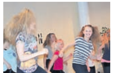
Flataskóli hefur verið mjög virkur í eTwinning-verkefninu. Þar hefur borið hæst þátttaka í „Schoolovision“ en það er verkefni sem er unnið í yfir þrjátíu löndum í Evrópu.

Nánast allir leik-, grunn- og framhaldsskólar landsins hafa tekið þátt í verkefnum styrktum af Comeniusar-hluta Menntaáætlunar Evrópusambandsins. Einn af þeim skólum er Flataskóli í Garðabæ. Skólinn hefur einnig verið virkur í eTwinning en það er rafrænt samstarf skóla víðs vegar í Evrópu styrkt af Menntaáætlun ESB.