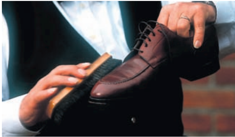
Skósmiðir gera gamla skó eins og nýja en heima við er einnig hægt að beita praureyndum ráðum við góða skóumhirðu og lengja líftíma skótausins.