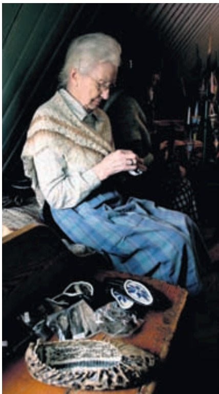
Handtökin við skógerð. Myndin er tekin á Árbæjarsafni.

Íslendingar sníðu sér sjálfir skó úr skinni og roði á öldum áður og var skógerð hluti af verkum heimilisfólksins á kvöldin. Skór voru oftast sniðnir úr sauðskinni og saumaðir saman á tá og hæl. Þá var varpað með sterkum þræði í opið til að styrkja skinnið og draga opið saman. Á spariskóm var síðan bryddað yfir varpið með hvítu eltiskinni og var leðrið sem notað var í spariskóna gjarnan litað með sortulyngi. Einnig voru skinn stundum lituð með eirsalti eða blásteini og urðu þá græn. Roðskór voru yfirleitt saumaðir úr steinbítroði og sniðnir og saumaðir líkt og skinnskórnir. Roðið var þó ekki eins endingargott og skinn.