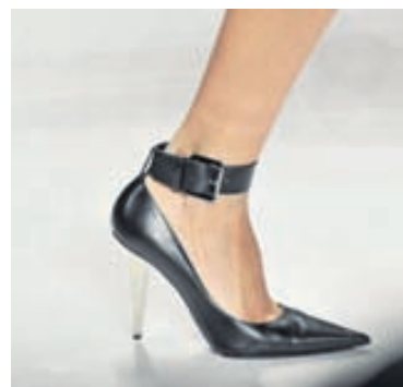
Skór af tískusýningu Michael Kors í New York í febrúar.