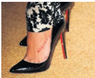
Christian Louboutin er þekktur fyrir skóna sína með rauðu sólunum.

Skórnir frá hinum franska Louboutin eru þekktastir fyrir rauða sólana á háhæluðum skóm. Hönnuðurinn hóf ferilinn sem skóhönnuður fyrir Chanel og Yves Saint Laurent. Fjöldi stjarna hefur klæðst skóm frá Louboutin, þeirra á meðal Jennifer Lopez.