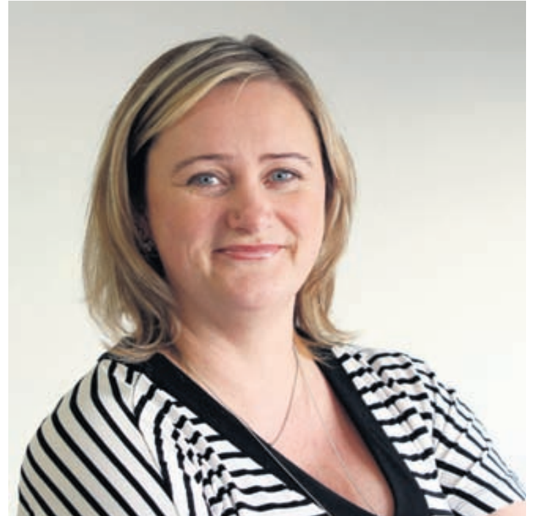
Samkvæmt neytendalöggjöf er tveggja ára kvörtunarfrestur fyrir fatnað en skófatnaður telst þar með.

Fram að páskum munum við bjóða 10 prósentu afslátt af allri seldri vöru. Einnig vil ég benda á heimasíðu okkar www.skovinnustofa.is en þar er ýmsan fróðleik að finna, auk upplýsinga um vörurnar okkar. Svo erum við líka á Facebook undir Skovinnustofa. Sigurbjörns.“