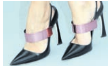
Stællægir skór frá Christian Dior.