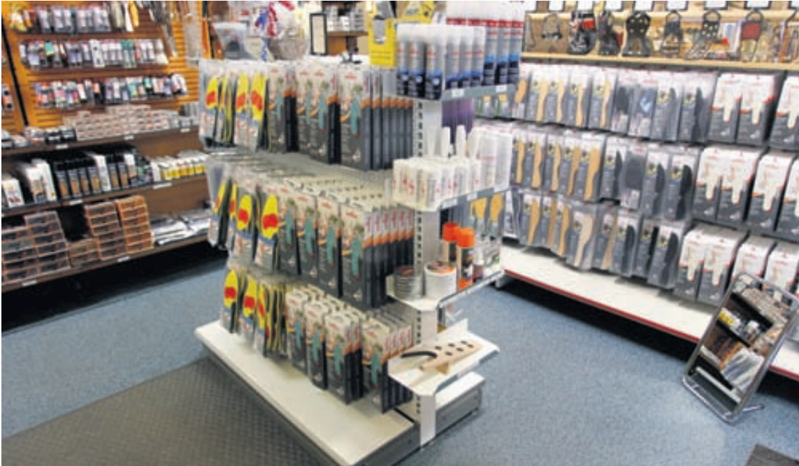
Stundum felst lausnin við sárum fótum í einföldum hlutum eins og betra innleggi en þægileg innlegg geta gert gæfumuninn. Gríðarlegt úrval innleggja er að finna á Skóvinnustofu Sigurbjörns í Austurveri.