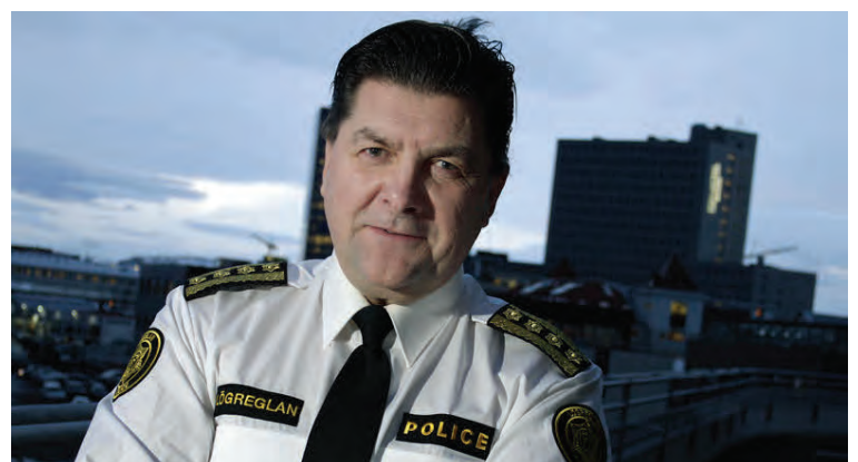
Lögreglan og björgunarsveitirnar eiga með sér farsælt samstarf

Ég vona að nán samvinna lögreglunnar og Slysavarnafélagsins Landsbjargar vari um ókomin ár þannig að þjóðin fái áfram notið þess aukna öryggis sem er og verður markmið þessa samstarfs.