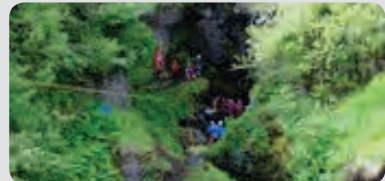
Afar flókin og erfið leit í júnibyrjun að tveimur konum við Bleiksárgljúfur á Suðurlandi. Meðal annars voru notaðir drónar við leitina.