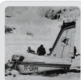
Umfangsmiklar og erfiðar leitar- og björgunaraðgerðir í apríl þegar flugvélin TF-ORM ferst í Ljósufjöllum á leið sinni frá Ísafirði til Reykjavíkur.

Umfangsmikil og viðtæk leit er flugvélin TF-ROM brotlendir 27. maí við Holtavörðuheidi. Fjórir farast.