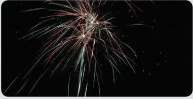
Björgunarsveitir hefja flugeldasölu í fjárflyunarskyni.

Botnvörpungurinn Elliði sekkur út af Jökuldjúpi. Mannbjörg.