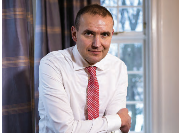
Liðsmenn björgunarsveita eru ávallt til taks.

„Fagmennska, jákvæðni, ósérhlífni og dugnaður eru þau orð sem í hugann koma þegar ég hugsa um Slysavarnafélagið Landsbjörg.“