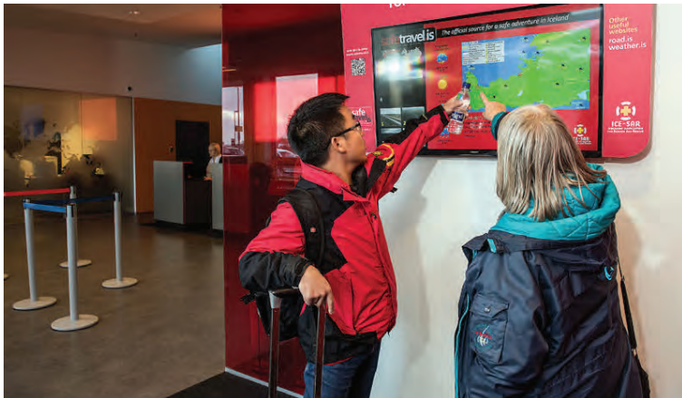
Rauði þráðurinn í Safetravel-verkefninu er upplýsingar og fræðsla.