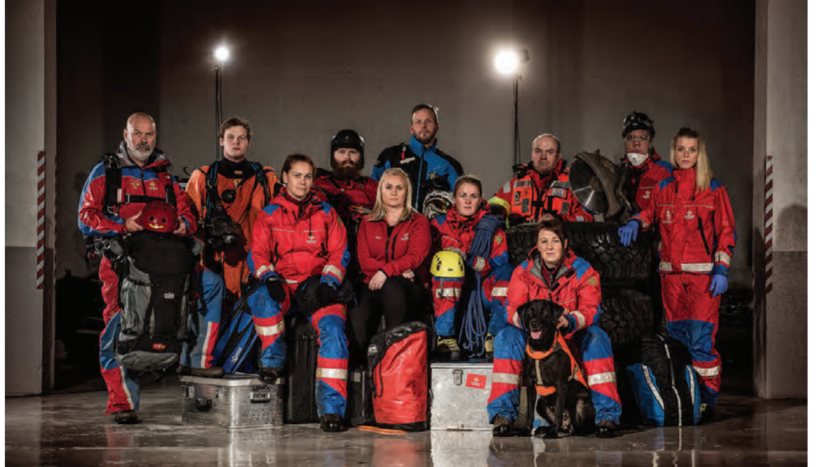
Það eru um 4.000 manns á útkallsskrá björgunarsveitanna og um það bil 10.000 meðlimir í félaginu í heild.

um náttúruhamfarir, veðrið, samgöngur og leit að fólki,“ segir Smári. „En mikilvægi félagsins er ekkert minna en það var áður, þótt eðli verkefna hafi sumpart breyst, og félagið er drifið áfram af sömu hugsjón og brautryðjendurnir lögðu upp með fyrir 90 árum. Félagið nýtur gríðarlegs trausts í samfélaginu en við verðum líka að vera minnug þess á hverjum degi að það traust og sú sterka ímynd sem félagið nýtur er ekki keypt heldur hefur verið byggð upp af hugsjónafólki í 90 ár.“