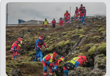
Mikill mannskapur tók þátt í umfangsmikilli leit í janúar á höfuðborgarsvæðinu og Reykjanesi.

Rússneska flutningaskipið Wilson Muuga strandar við Hvalsnes á Reykjanesi. Skipverjar bjargast, en danskur björgunarmaður ferst.