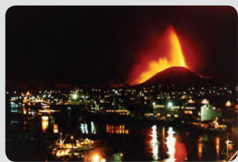
23. janúar hefst eldgos í Eyjum og þar með mesta björgunaraðgerð Íslendinga, fyrr og síðar.