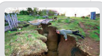
Stór jarðskjálfti ríður yfir Suðurland þann 29. maí.

Jeppi fellur í sprungu á Hofsjökli. Gífurlega erfið og flókin björgun á 30 metra dýpi. Einum bjargað og einn lést.