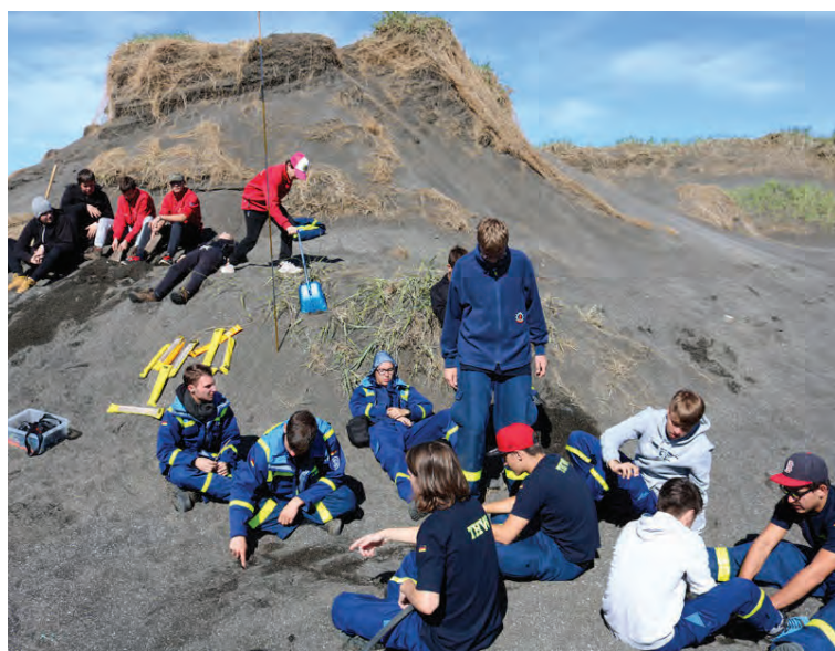
Um 50 björgunarsveitir um landið eru með unglingsstarf.