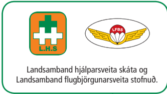
Landsamband hjálparseita skáta og Landsamband flugbjörgunarsveita stofnuð.

Botnvörpungurinn Elliði sekkur út af Jökuldjúpi. Mannbjörg.