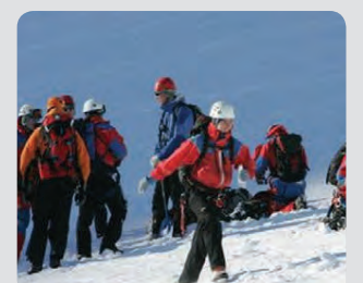
Tveir falla 24 metra niður í sprungu á Langjökli. Tæknilega erfið aðgerð. Einn ferst en öðrum bjargað.