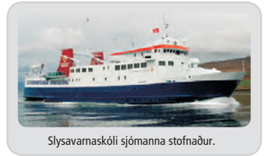
Slysavamaskóli sjómanna stofnaður.

Breska rísaolíuskipið Clam strandar 26. febrúar. 27 farast en 23 er bjargað með fluglínutækjum.