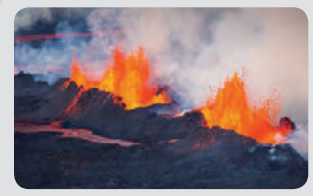
Eldgos hefst í ágúst í Holuhrauni, 10 km. norðan Vatnajökuls.