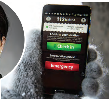
Safetravelappið í símanum.

„Ef eitthvert eitt orð einkennir þá nálgun sem þarf að beita á málefni ferðapjónustunnar þá er það „samstarf“. Við höfum bætt okkur í því á undanförunum árum en viljum gera enn betur og það á við um Safetravel eins og önnur verkefni, en samstarfið þar hefur verið einkar gott.“ Rauði þráðurinn í Safetravel verk-