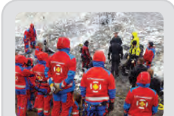
Flókið og erfið björgunstarf er maður lést eftir fall undir ishelli í Landmannalaugum.

Rúta með 46 manns valt á þjóðvegi 1 og lenti utan vegar í Eldhrauni vestan Kirkjubæjarklausturs 27. desember. 300 manns komu að umfangsmiklum björgunaraðgerðum. 2 létust og allmargir slösuðust.