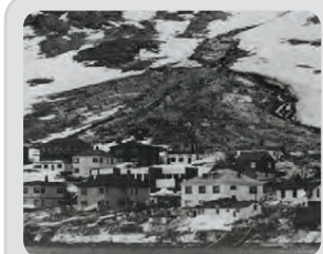
Snjó- og aurflóð falla á Patreksfirði þann 22. janúar.

Umfangsmikil og viðtæk leit er flugvélin TF-ROM brotlendir 27. maí við Holtavörðuheidi. Fjórir farast.