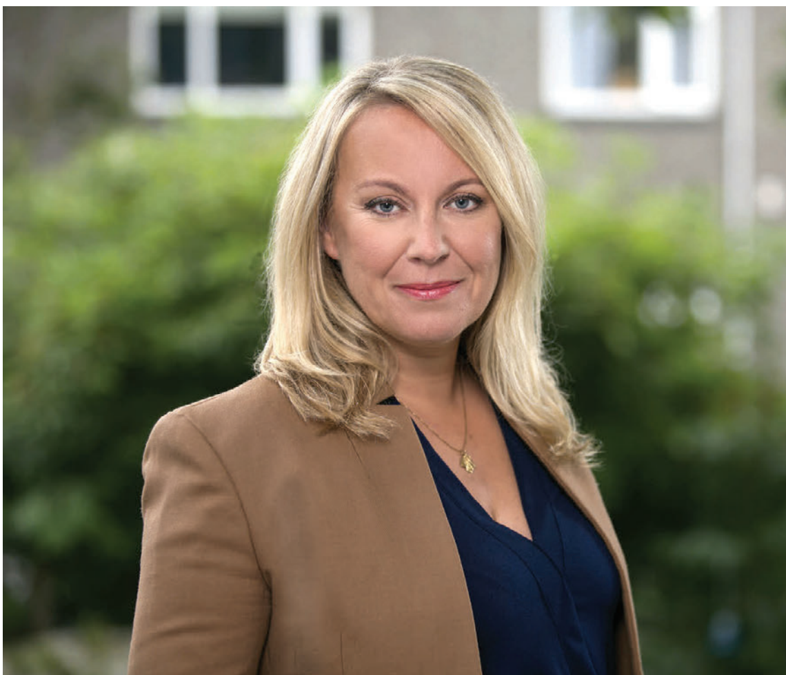
Nýr þjónustusamningur kveður á um 147 milljóna króna fjárframlag ríkisins til Landsbjargar.

Starf björgunarsveitanna er dæmigert einstaklingsframtak. Það hófst fyrst fyrir um níutíu árum og hefur verið mikilvægur þáttur í almannavarnakerfi Íslands síðan og verður áfram. Björgunarsveitirnar gegna lykilhlutverki við leit og björgun í samvinnu við lögreglu, landhelgisgæslu og aðra viðbragðsaðila hér á landi og hefur samvinna þessara aðila reynst góð