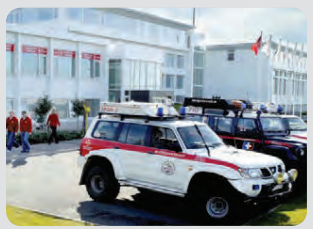
Ný og glæsileg björgunarmiðstöð vígð í Skógarhlíð í Reykjavík 26. mars.