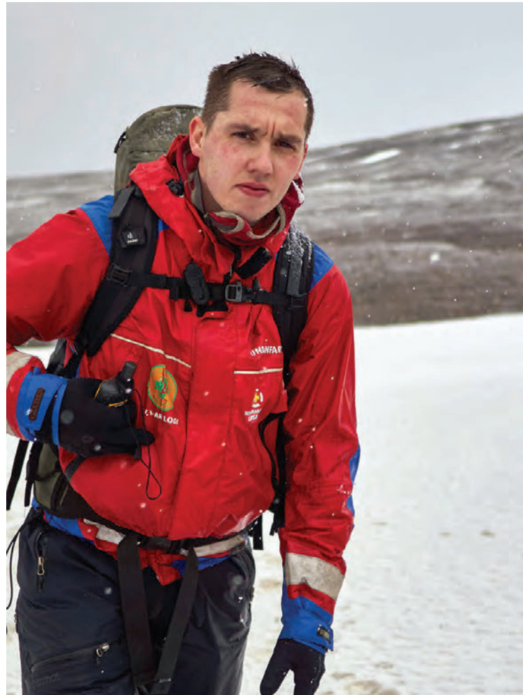
Sævar þarf stundum að breyta plönum með stuttum fyrirvara en hann nýtur til þess stuðnings fjölskyldunnar og vinnuveitanda. „Ég fæ að fara þegar ég verð að fara,“ segir hann.

Undanfarin ár hefur hann verið í hópi undanfara og sérhæft sig í fjallamennsku og fjallabjörgun. „Við stofnuðum hóp undanfara hér fyrir austan fjall, þvert á björgunarsveitir, og ég var í forsvari fyrir þann hóp þar til nýlega þegar ég tók við sem formaður Hjálparsveitar skáta í Hveragerði. Björgunarsveitin sinnir ótrúlega fjölbreyttum verkefnum. Helligheitin hefur leikið stórt hlutverk í starfinu og við höfum farið í ófá útköll upp á heidina að bjarga fólki úr bílum vegna veðurs. Þeim hefur þó fækkað eftir að Vegagerðin fór að loka heidinni fyrir vegna