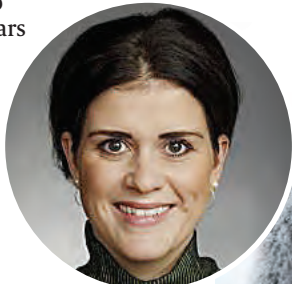
Þórdís Kolbrún Reykfjörð Gylfadóttir, ráðherra ferðamála

Samstarf ráðuneytisins og undirstofnana við Safetravel hefur verið mikið síðustu árin, hvernig horfir ráðherra á mikilvægi þess?