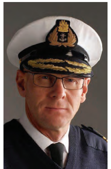
Gjöful og gæfurík samvinna.

Samstarf Landhelgisgæslunnar og Slysavarnafélagsins Landsbjargar nær raunar yfir mun fleiri svið. Landhelgisgæslan er til