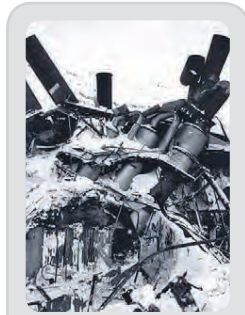
Mannskæð snjóflóð falla á Neskaupsstað þann 20. desember.