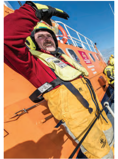
Skipin eru komin til ára sinna.