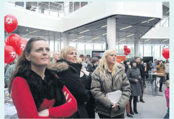
Fjöldi fólks mætir á Háskóladaginn ár hvert.

Í HR verður einnig fjölbreytt dagskrá, en auk skólans munu Listaháskóli Íslands og Háskólinn á Bifröst kynna námsframboð sitt, rannsóknir og félagslíf. Fjölbreytt dagskrá verður einnig í boði í HR allan daginn. Verðlaun verða afhent í Hugmyndasamkeppni HR og Vísinda-Villi spjallar við börnin. Boðið verður upp á Lego-námskeið fyrir börn og unglinga. Dagskrá beggja skóla stendur yfir frá klukkan 12-16 og nánari upplýsingar má finna á heimasíðum þeirra.