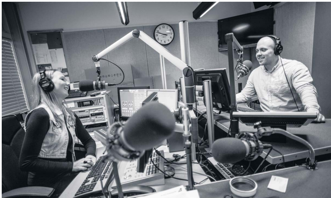
Nemendur í fjölmiðlafræði vinna að gerð útlarpsefnis.