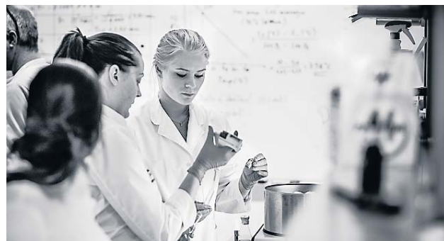
Verklegar æfingar hjá nemendum í líftækni.