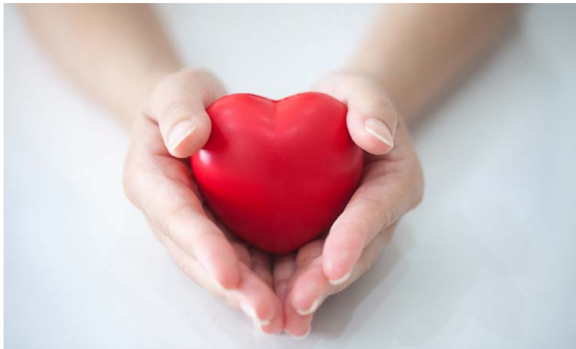
Hjarta- og æðasjúkdómar herja ekki síður á konur en karla.

Markmið þeirra samtaka er að styðja við fræðslu um hvaðeina er varðar heilbrigði kvenna og fjölskyldna. Sterkur samhljómur er því með þessum tveimur félögum og vegna samstarfsins hefur yfirbragð fyrirlestra á ráðstefnu GoRed í Hörpu 1. febrúar nk. fengið viðtækari skirskotun, en auk þess sem fjallað er um hjartaheilsu fáum við innsýn í áfallasögu kvenna, frásögn konu í kulnun og að heyra um magnaða lífsbreytandi áskorun. Við hlökkum til að sjá sem flesta á ráðstefnunni í Hörpu á GoRed deginum föstudaginn 1. febrúar nk. og óskum ykkur öllum heilbrigðis og hamingju.