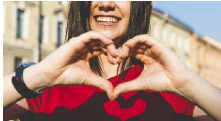
Hjarta- og æðasjúkdómar koma fram hjá konum síðar á ævinni en hjá körlum.

Áhætta ungs fólks á að fá hjarta- og æðasjúkdóma er lítil ef lítið er til næstu 10 ára í lífi þeirra, eins og vaninn er að gera í áhættumati. Gagnsemi þess að meta áhættuþætti hjá ungu fólki liggur því oft í að bera saman áhættuþætti við jafnaldra af sama kyni. Tökum dæmi af blóðþrýstingi. Blóðþrýstingur sem mælist 130 mmHg, telst vera eðlilegt gildi fyrir efri mörk blóðþrýstings í þeim skilningi að hann kallar ekki á lyfjameðferð. Ung kona sem væri með þennan blóðþrýsting væri þó mun hærri en jafnöldru hennar, þar sem meðal blóðþrýstingur 35 ára kvenna á Íslandi er aðeins 106 mmHg. Meðal blóðþrýstingur 75 ára kvenna er hins vegar 138 mmHg. Blóðþrýstingur hækkar með aldri og því gæti verið ástæða fyrir þessa ungu konu að vera meðvituð um að meiri líkur séu á háþrýstingi hjá henni síðar á ævinni en öðrum. Ef þörf verður á lyfjameðferð síðar á ævinni er ákjósanlegt að meðferðin hefjist sem fyrst eftir að háþrýstingur kemur fram. Meðvitund um áhættuþætti hjarta- og æðasjúkdóma getur því verið mikilvæg fólki á öllum aldri.