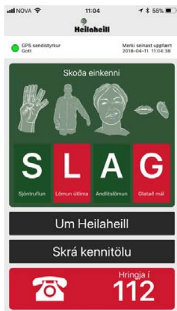
Appið er beintengt við Neyðarlínu.

Með appinu getur Neyðar-línan staðsett notandann sam-stundis, hvar sem hann er staddur á landinu, uppi á Vatnajökli eða í miðjum Hallormsstaðarskógi og með því er inngríp heilbrigðiskerfi-