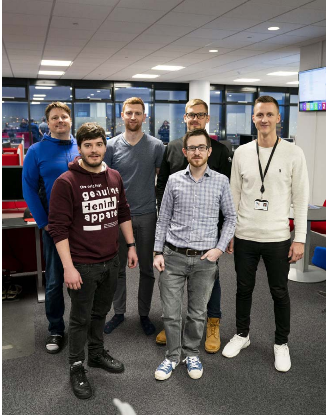
Starfsfólk dk hugbúnaðar samanstendur af vel menntuðum og öflugum hópi sérfræðinga.

„Takmarkaðir notkunarmöguleikar eru veikleiki margra bókhaldskerfa á íslenska markaðnum og oft er ekki hægt að laga hugbúnaðinn að sérþörfum fyrirtækja. Við hjá dk höfum þróað fjölda sérlausna fyrir íslenskan og erlendan markað, svo sem verslanir og veitingahús, hótél og gististaði, stéttarfélag,