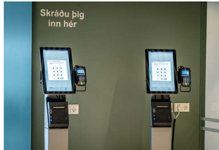
Hér má sjá vel heppnaða sjálfsafgreiðslulausn á Læknavaktinni.

Sjálfsafgreiðsla er farin að ryðja sér til rúms á Íslandi. „Við erum með