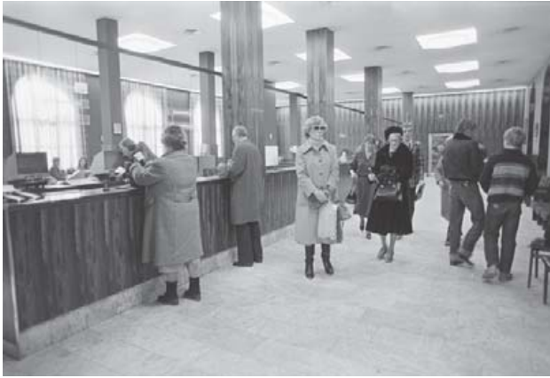
Svona leit afgreiðslusalur Útvegsbanka Ísland við Lækjartorg út í mars 1980.