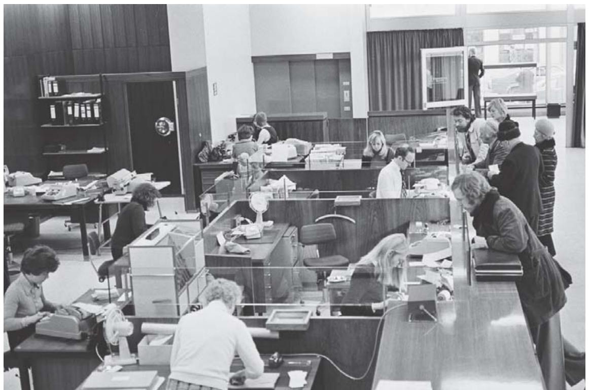
Myndin er tekin í Austurbæjarútibúi Búnaðarbanka Íslands við Hlemm, Laugavegi, árið 1976. Horft er yfir afgreiðslusalinn, gjaldkerar eru að störfum og viðskiptavinir eru að greiða reikninga og sinna ýmsum erindum.