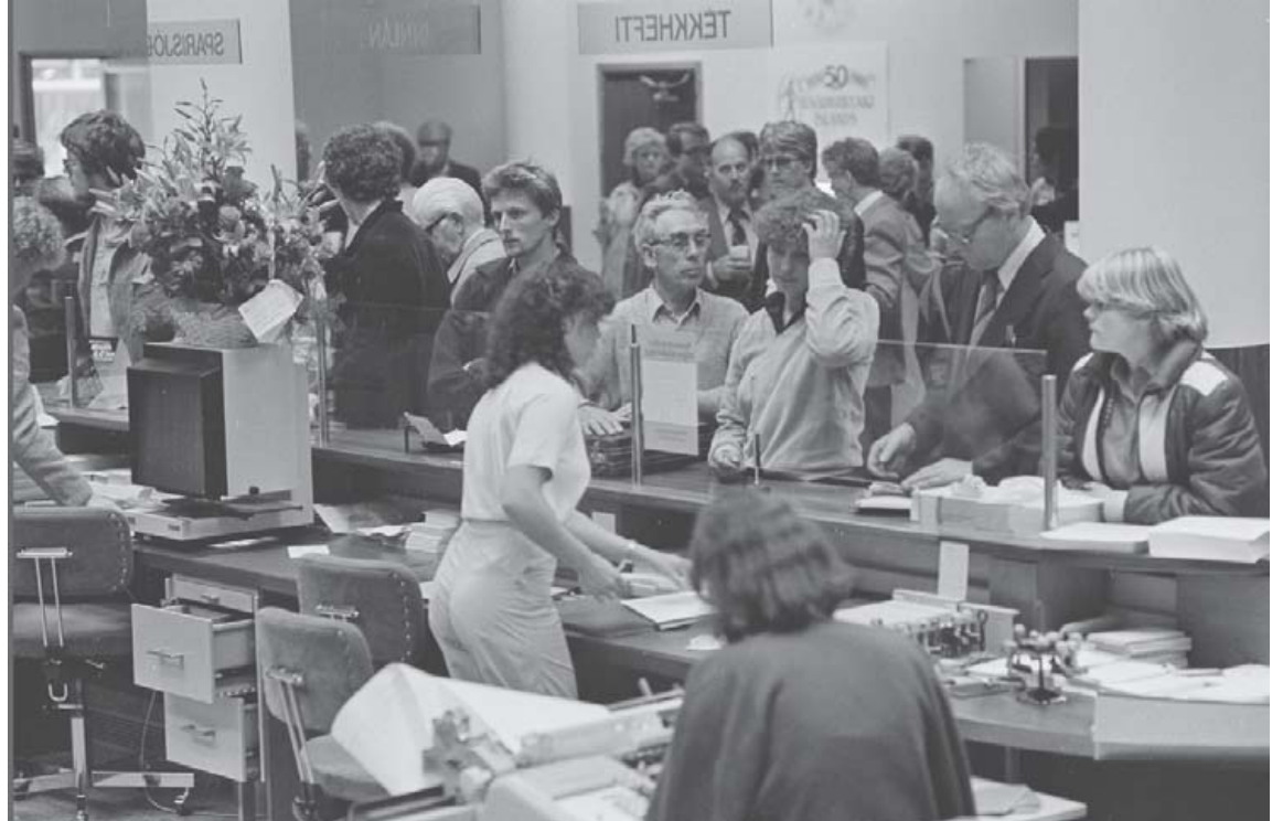
Það var líf og fjör á afmælisári Búnaðarbankans árið 1980.