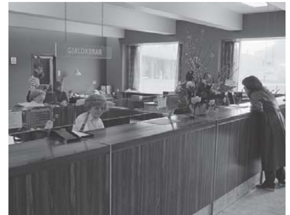
Úr afgreiðslusal Útvegsbanka Íslands í apríl 1980. Viðskiptavinur er við afgreiðsluborðið og fallegar blómaskeytingar á afgreiðsluborðinu.