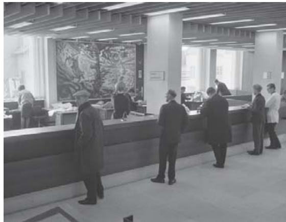
Landsbankinn opnar nýtt útibú á Laugavegi 77 í mars 1967. Viðskiptavinir afgreiddir í afgreiðslusal á fyrstu hæð.

var reglulegur hluti lífsins. Þar tóku landsmenn út peninga og lögðu þá inn, greiddu reikninga og áttu auðvitað í ýmsum samskiptum við starfsmenn fjármálfyrirtækja í raunheimum en ekki gegnum netið eða síma. Förum nokkur ár aftur í tímann og lítum á nokkrar gamlar myndir úr ólíkum útibúum nokkurra fjármálfyrirtækja.