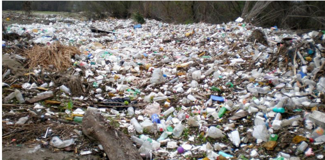
Plastflöskur og annað plastdrasl er ófögur sjón og ekki síður sjónmengun að því en umhverfisskaði en með því að við gerum okkur grein fyrir verðmætinu sem býr í plasti mun það vonandi fara minnkandi fyrr en síðar.

Í Surabaya í Indónesíu geta íbúar greitt fyrir almenningsamgöngur með plastflöskum. Þetta fyrirkomulag er umhverfisvænt á ýmsa vegu þar sem það bæði stuðlar að betri ruslstjórnun en líka hvetur fleiri til að nota strætisvagna og dregur þar með úr bílaum-