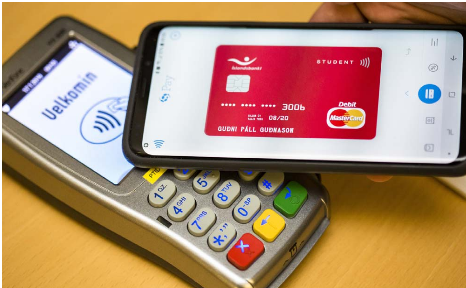
Með Pay er hægt að greiða með símanum á yfir 300 sölustöðum um allt land. Forritið er í stöðugri þróun og ýmsar tækninýjungar eru á döfnni.