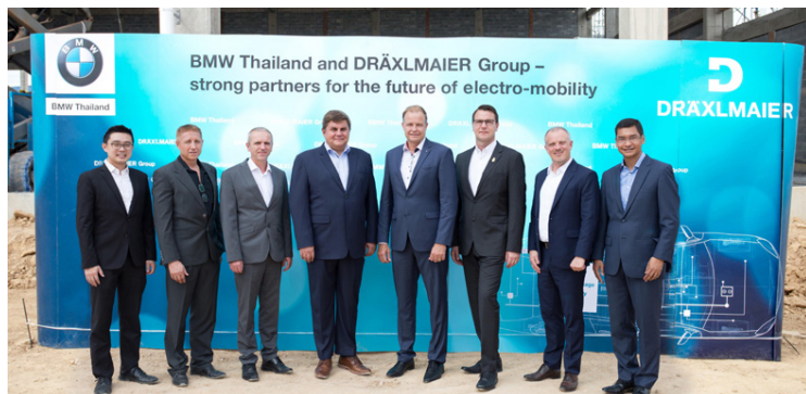
Samankomnir fulltrúar BMW Group í Taílandi, Dräxlmaier og BMW.

Í Taílandi fer eftirspurn neytenda eftir rafbílum mjög vaxandi og