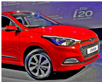
Vegtyllan er mikilvægur mælikvarði fyrir kaupendur nýrra bíla.

Að mati þýska bílatímaritsins Auto Bild er Hyundai i20 besti bíllinn í flokki minni fólksbíla samkvæmt því sem fram kemur í árlegri skýrslu tímaritsins, Auto Bild's TÜV Report 2019. Ástæðan er einstaklega lágt hlutfall alvarlegra bilana í prófunum bílasérfræðinga Auto Bild, eða einungis 3%. Niðurstöðurnar byggja á 8,8 milljónum athugana sem gerðar voru á tímabilinu frá 1. júlí 2017 til 31. júlí í ár.