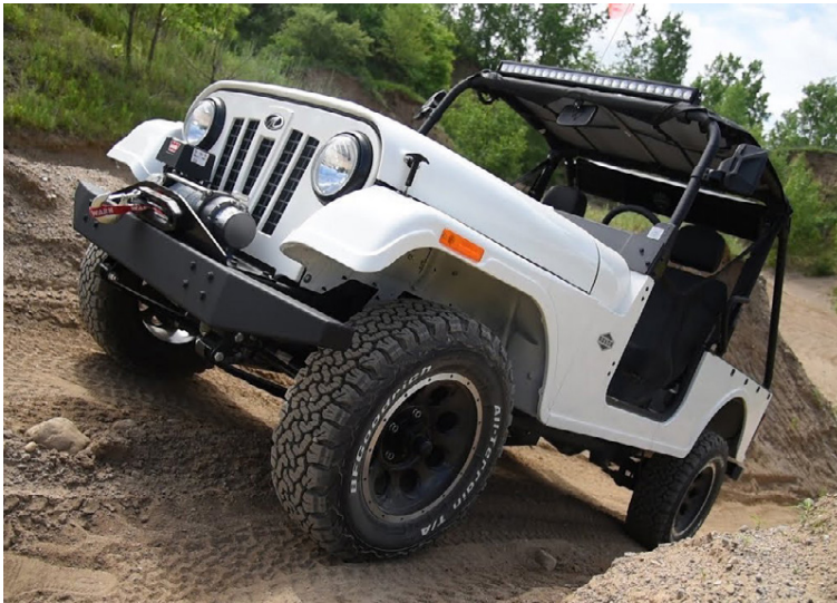
Mahindra Roxor er enn smíðaður í formi gamla Willis.