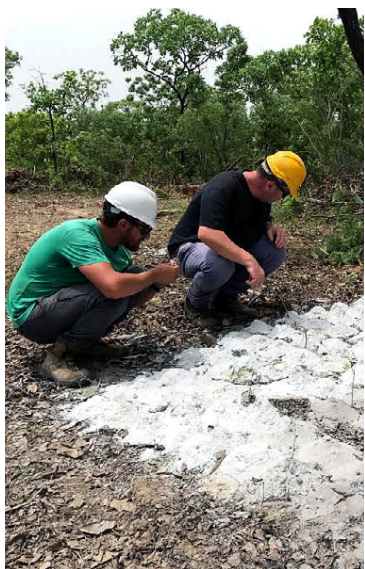
Vinnsla mun hefjast á litíum í Afríkurríkinu Malí innan tveggja ára.

Mazda hefur hingað til ekki verið einn af stóru þátttakendum í rafbíla-væðingunni og það stendur ekki til á næstunni. Mazda vill nefnilega meina að mjög víða í heiminum séu bílar með hefðbundnar brunavélar umhverfisvænni kostur en rafbílar. Ástæða þess er hvernig rafmagn er framleitt víða, gjarnan með kolum, gasi eða olíu. Því sé fyrir bestu að leggja áherslu á sparneytnar brunavélar, hvort sem þær eru knúnar bensíni eða disilolíu. Þar er Mazda reyndar mikill brautryðjandi og vélar frá Mazda eru þekktar fyrir litla eyðslu og gott afl. Forsvarsmenn Mazda vilja meina að enn sé hægt að minnka eyðslu brunavéla um allt að 30% og á það stefni Mazda bæði í tilfelli bensin- og dísilvéla. Þá ætlar Mazda að halda áfram þróun rotary-véla og nota á næstunni smáar slíkar vélar við hlið brunavéla til aflaukningar og minni eyðslu.