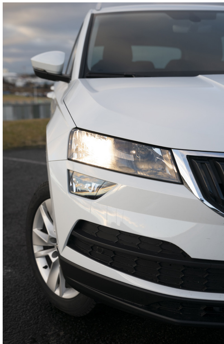
Laglegar línur einkenna flesta nýja bíla Skoda og fremur hvassar..

Að innan koma smíðakostir Skoda berlega í ljós og eina ferðina enn sannfærist greinarritari um það hversu vel bílar Skoda eru smíðaðir.