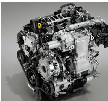
Vélar Mazda eru sérlega sparneytnar.