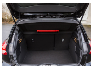
Mjög góð skottopnun og fínasta skottrými fyrir ekki stærri bíl sem kostar frá 3.190.000 kr.