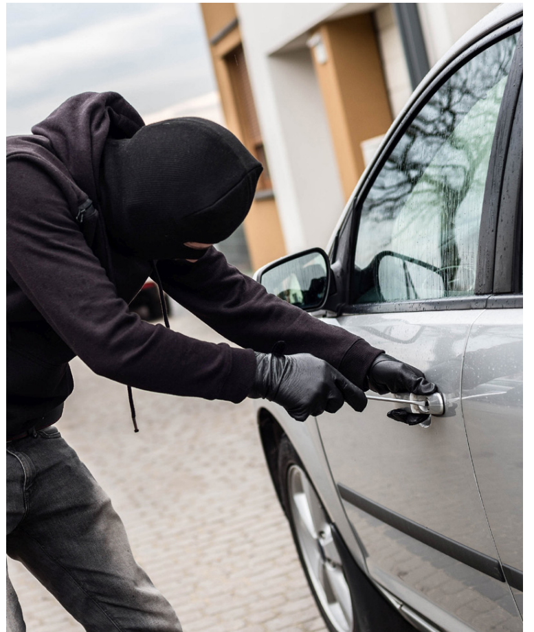
Sífellt þróaðri tækniþekking þjófanna og fækkun í lögreglu skýrir aukninguna.

Lögreglumönnum í Bretlandi hefur fækkað um 20.000 frá árinu 2010 og er þessi bílpjófnaðarbylgja nú ekki síst rakin til þess en lögreglan hefur ekki sama sýnileika og áður og hefur ekki tíma til að rannsaka eða endurheimta alla þessa stolnu