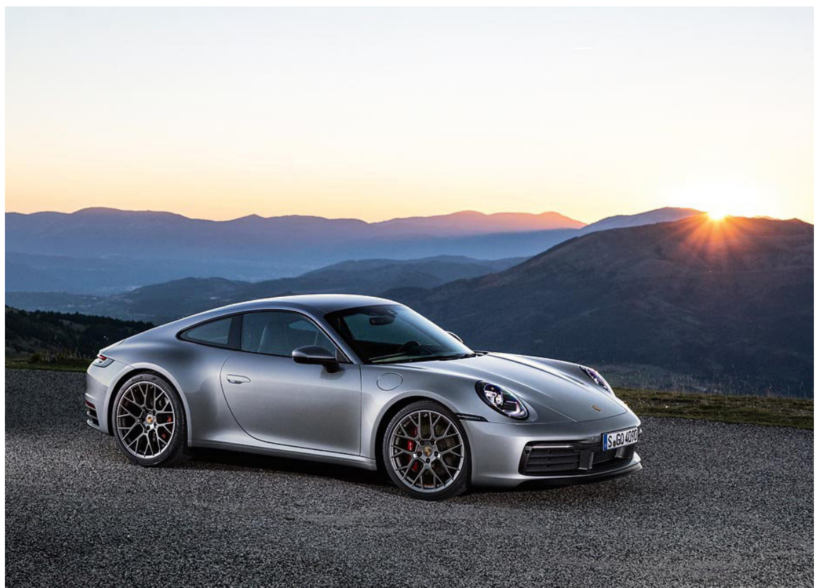
Áttunda kynslóð Porsche 911 var kynnt á LA Auto Show fyrir stuttu.

Hagkvæmni hefur einnig verið aukin með nýrri hönnun á innspýtingarkerfi og staðsetningu