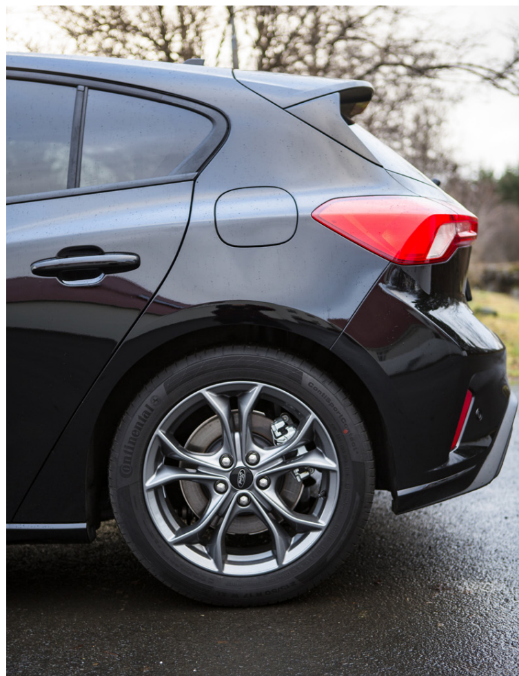
Laglegur afturendi og ekki skemma flottar felgurnar fyrir.

Apple CarPlay og Android Auto og 6 hátalarar eru í bílunum og fjarstýring í stýri fyrir hljómtæki. Ford SYNC raddstýrt samskiptakerfi, forritanlegur lykll með takmörkun