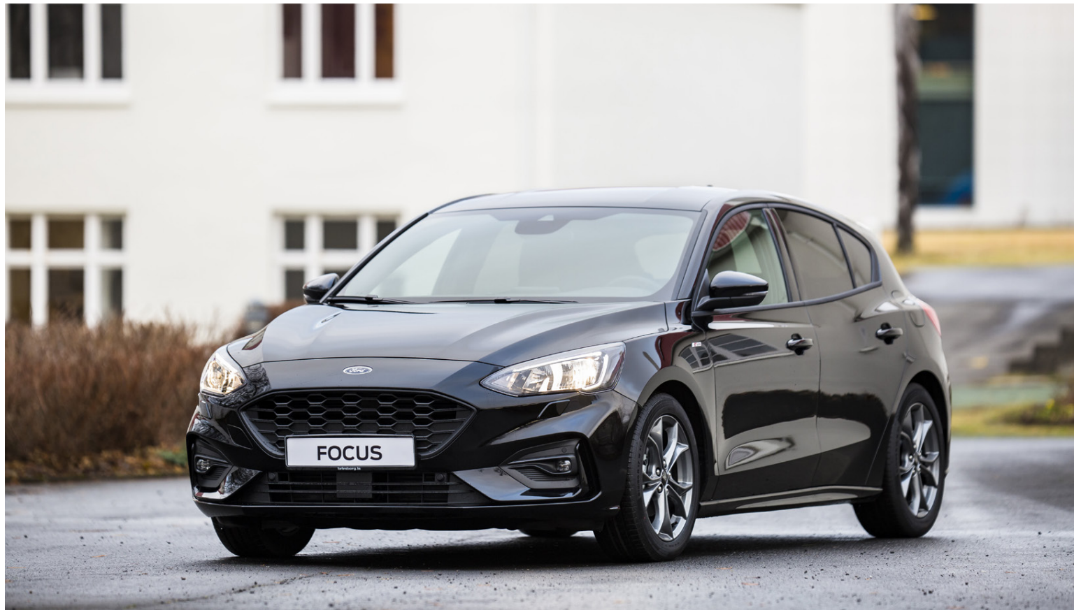
Ford Focus er ferlega flottur útlits og ekki versnar það þegar inn er komið. Vindstuðull bílsins er aðeins 0,27 Cd.

Aksturshæfni fjórðu kynslóðar Focus er í einu orði sagt frábær. Líklega fer þarna aksturshæfasti bíllinn í sínum stærðarflokki og er þá ekki verið að keppa við neina aukvísu, svo sem Volkswagen Golf. Það er hreinlega alger unaður að aka þessum bílum, sama hver vél er, því að undirvagninn og fjöðrun bílsins er svo vel uppsett að erfitt getur reynt að finna takmörk bílsins í gripi og hegðun. Það er hægt að henda þessum bíl svo hratt gegnum hornin og hringtorgin að meðreiðarfolk óskrar af skelfingu, en bíllinn heldur sínu