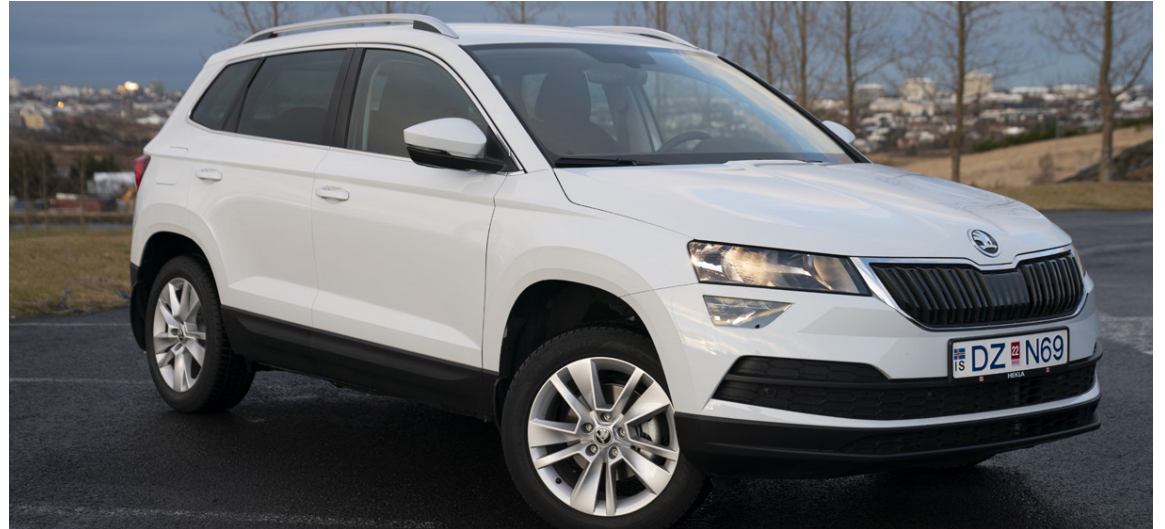
Skoda Karoq var kynntur í fyrra og kom í kjölfarið á stærri bróðurnum, Skoda Kodiaq-jeppanum.

Karoq á eins og við mátti búast systurbíl innan Volkswagen Group samstæðunnar og er það Seat Ateqa. Með tilkomu Skoda Karoq ákvað Skoda að hætta framleiðslu