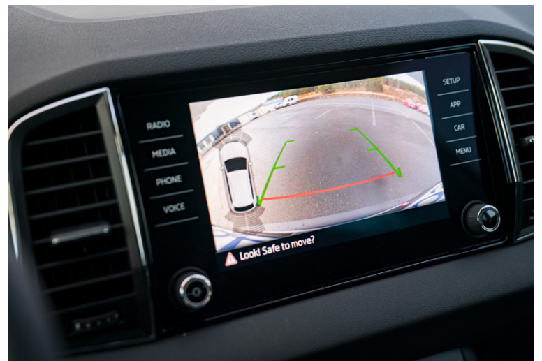
Skoda Karoq er með öll innri útlitseinkenni Skoda-bíla og huggulegur mjög.

Yeti-bíls síns, en þessir bílar eru ámóta stórir jeppingar. Þó er Karoq aðeins lengri og breiðari en Yeti og sannarlega með meira og betra innanrými. Margir munu þó sakna Yeti-bílsins og hans aðlaðandi kassalags, en samt svo fagaðrar hönnunar. Það verður þó ekki tekið af Karoq að þar fer fríður bíll sem höfða mun til margra og vafalaust mun fleiri en Yeti.