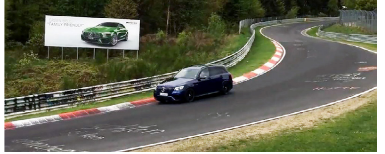
Mercedes AMG GLC 63 á flýgiferð á Nürburgring-brautinni.

Það ætti ekki að vera ýkja erfitt fyrir nokkra mjög svo öflugra jeppa að gera ennþá betur en Benz-jeppinn, t.d. ætti Lamborghini Urus með sín 650 hestöfl að slá við þessum tíma, sem og Cayenne Turbo S E-Hybrid sem skartar enn fleiri hestöflum, eða 680. Ekki er þó víst að framleiðendur þessara jeppa hafi áhuga á að bæta þetta met. Timinn einn leiðir það í ljós.