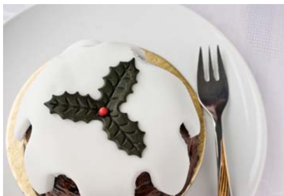
Eitt aðalsmerki ensku jólakökunnar er hvað hún er oft fallega skreytt.

er tilbúið ef það dettur af sleif. Deigið er sett í form. Sumir geyma formið í ísskáp fram á næsta dag en einnig má baka kökuna strax. Úðið yfir kökuna með vatni og hyljið svo með tveimur lögum af smjörpappír