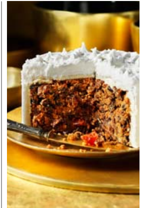
Í þessum þverskurði má glóggst sjá hvernig sykurbraðin og marspanið spila saman. Og hvað ensk jólakaka er einstaklega falleg og hátíðleg.

675 g flórskukur 4 eggjahvítur 1 msk. sitrónusafi 2 tsk. glýserin Flórskurinn sigtaður, eggjaraður