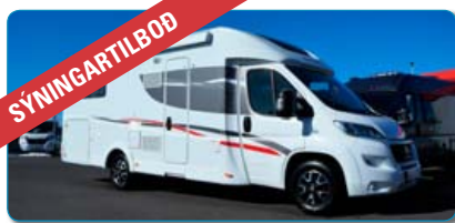
Sunlight T 69 L Árgerð 2016. Markísa, hjólagrind, álfelgur, lestarlúga báðum megin, hjónarúm aðgengilegt beggja vegna, fellirúm í toppi, stór ísskápur, LED lýsing, 6 gíra, cruise control, snúningsstólar, loftkæling o.fl. o.fl. Ótrúlegt verð: 8.190.000.