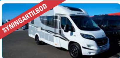
Sunlight T 64 Árgerð 2016. Markísa, hjólagrind, silfurgráar hlíðar, álfelgur, fellirúm í toppi, stór ísskápur, LED lýsing, 6 gíra, cruise control, snúningsstólar, loftkæling ofl. ofl. Ótrúlegt verð, frá: 7.590.000.