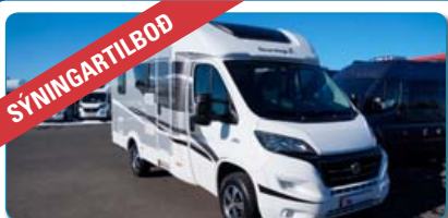
Sunlight T 58: Árgerðir 2016-2017. Markísa, hjólagrind, silfurgráar hlíðar, álfelgur, 6 gíra, cruise control, snúningsstólar, loftkæling ofl. ofl. Ótrúlegt verð, frá: 6.490.000.