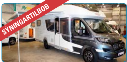
LMC Breezer H 737 G Árgerð 2017. Markísa, lestarlúga báðum megin, útdrag á milli rúma, fellirúm í toppi, stór ísskápur, LED lýsing, 6 gíra, cruise control, snúningsstólar, loftkæling, bakkmýndavél o.fl. o.fl. Ótrúlegt verð: 9.980.000.