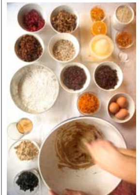
Sumir kjósa að taka innihaldsefnin til áður en bakstur hefst.

þeyttar vel. Bætið við einni msk. af flórskuri í einu ofurhægt og þeytið vel á milli. Sitrónusafa og glýserini bætt út í og þeytt uns blandan er orðin eins og marengs. Skálin er hulin með rökum klút og geymd í einn til tvo tíma. Bráðina má lita með matarlit. Flórskursbráðin er borin á marspanhúð kökunnar. Fyrst er borin á topp kökunnar og þegar það hefur þornað er bráðin sett á hliðar hennar. Kökuna má síðan skreyta með marspan-skrauti.