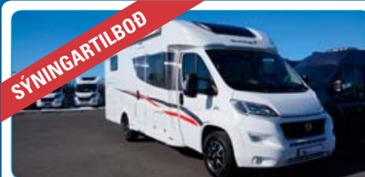
Sunlight T 67 Árgerð 2016. Markísa, hjólagrind, álfelgur, lestarlúga báðum megin, útdrag á milli rúma, fellirúm í toppi, stór ísskápur, LED lýsing, 6 gíra, cruise control, snúningsstólar, loftkæling o.fl. o.fl. Ótrúlegt verð: 7.790.000.