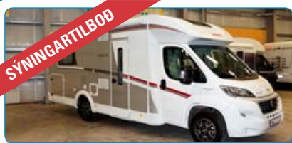
Dethleffs Trend T 7057 DBM Árgerð 2018. Markísa, hjólagrind, lestarlúga báðum megin, breið inngangshurð með samlæsingu, rafmagnsdrífið fellirúm í toppi, stór ísskápur, LED lýsing, 6 gíra, cruise control, snúningsstólar, loftkæling o.fl. o.fl. Ótrúlegt verð: 10.890.000.

Frábært úrval stórglæsilegra tækja á ótrúlegum verðum, frá 5.990.000 Árgerðir 2014-2018