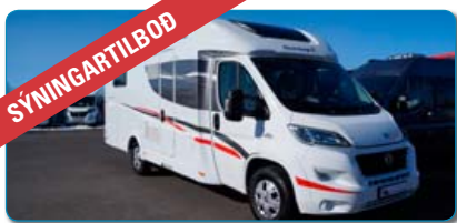
Sunlight T 68 Árgerð 2016. Markísa, hjólagrind, lestarlúga báðum megin, útdrag á milli rúma, fellirúm í toppi, stór ísskápur, LED lýsing, 6 gíra, cruise control, snúningsstólar, loftkæling o.fl. o.fl. Ótrúlegt verð: 7.990.000.