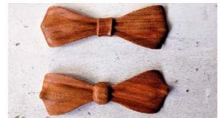
Slaufurnar eru í ýmsum litum og smíðaðar úr ólíkum viðartegundum.

hjelpa sér við að smíða hana. Hann var ekki nógu sáttur við útkomuna í fyrstu þannig að við þróuðum hana saman. Því má segja þessar tréslaufur sem ég er að smíða í dag séu byggðar á hugmynd frá honum.“