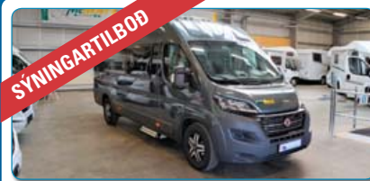
Sunlight Cliff 640 Árgerð 2018. FIAT Maxi grindin, 16", markísa, gott geymslu-pláss aftur í, LED lýsing, 12V pressuisskápur, 6 gíra, cruise control, loftkæling, snúningsstólar, bakkskyrnjarar o.fl. ofl. Ótrúlegt verð: 9.350.000.