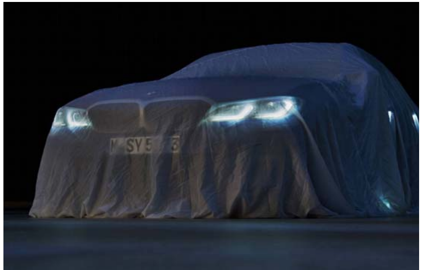
BMW 3 í huliðsklæðum en BME-W þristurinn er söluhæsta einstaka bílgerð BMW.

Þegar þessi fjögur bílamerki urðu að Audi Union árið 1932 var August Horch löngu látinn, en hann stofnaði sem sagt tvö þeirra. Nafn hans lifir því enn, að minnsta kosti mun betur en nöfn þeirra stjórnarmanna sem gerðu hann brott-rækan frá Horch á sínum tíma.