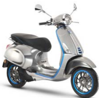
Elektríca-skutla frá ítalska framleiðandanum Vespa.