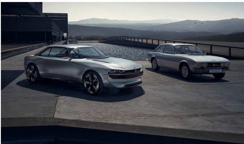
E-Legend og fyrirmyndin Peugeot 504 Coupe af árgæroð 1969.