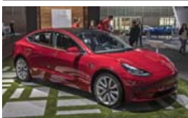
Tesla Model 3

Upphaflega Bjallan kom fram á fjórða áratug síðustu aldar en nýja Bjallan leit dagsins ljós árið 1998 og mun því ná 21 árs líftíma en alls hefur verið framleidd 21 milljón eintaka af Bjöllunni frá upphafi.