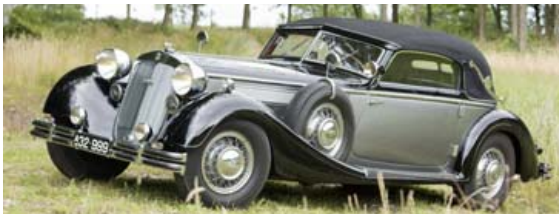
Mynd: Horch 853 lúxusbíll frá árinu 1937.