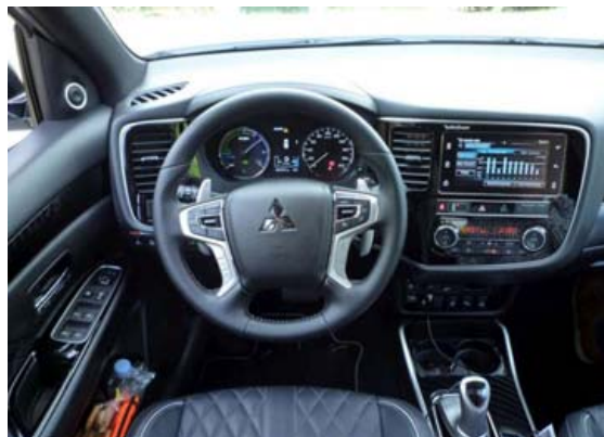
Mitsubishi Outlander PHEV er virkilega smekklegur að innan.

Meiri breyting er fölginn í nýrri 2,4 lítra bensínvél sem leysir af hólmi 2,0 lítra vél og skilar það sér í meira