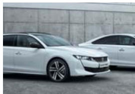
Peugeot 3008 og 508.

Peugeot 508 mun fá ekki ósvipaða meðferð, en hann verður