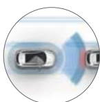
SJÁLFVIRK NEYÐARHEMLUN STAÐALBÚNAÐUR Í TEKNA