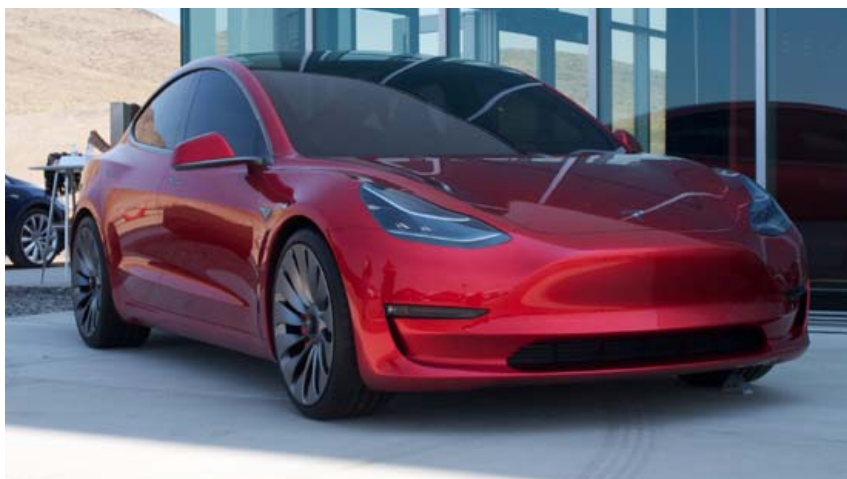
Tesla Model 3 fyrir utan stóru bilaverksmiðju Tesla í Kaliforníu.

Framljósín á hjólunum eru af LED-gerð. Afl rafhlöðanna er tvö kílóvött en það má þó auka í fjögur kW í stutta stund og ætti þá aflið að vera yfrið. Drægi hjólanna er um 100 kílómetrar og það tekur um fjórar klukkustundir að fullhlaða þau aftur. Akstursstillingar eru aðeins tvær, Eco og Power. Vespa með rafmótör og brunavel er með minna drægi á rafmagnni, eða 50 kílómetra, en að sjálfsgöðu meira heildardrægi.