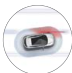
SJÁLFVIRKUR AKREINAVARI STAÐALBÚNAÐUR Í TEKNA