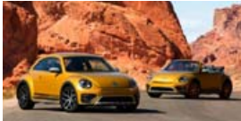
Bjallan að syngja sitt síðasta.