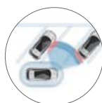
LEGGJA Í STÆÐI HJÁLP VALBÚNAÐUR