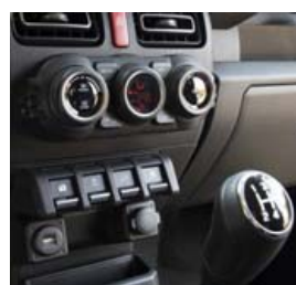
Virkilega flott, einföld og vel smíðuð innrétting í nýja bilnum.

meðal þeirra sem breyta bílum og ferðast mikið.