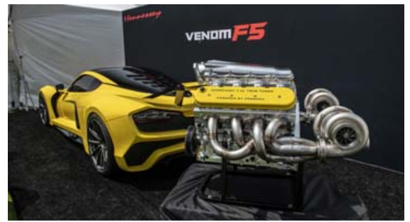
Hennessey Venom F5 og ofurvélín sem í honum er á Pebble Beach.

það að með Venom F5 bílnum ætli fyrirtækið að gera atlögu að vegtyllunni hraðskreiðasti fjöldaframléiddi bíll heims. Venom F5 á að ná yfir 480 km hraða, jafnvel 500, en núverandi met Bugatti Chiron stendur í 444,6 km/klst. og ef það tekst verður Bugatti Chiron nánast að lettingja í samanburðinum. Hraðastríð milli Bandaríkjanna og Evrópu stendur því enn yfir.