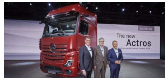
Samstarf Daimler og Proterra var tilkynnt á IAA atvinnubílasýningunni í Hamborg. Mikill hugur er í atvinnubílaeild Daimler hvað varðar rafbilavæðingu.

Ekkert liggur fyrir um hvort Peugeot ætla að smíða þennan E-Legend bíl eða hvort þetta er létt hönnunarfæing. Hann er þó eitt-hvað fyrir augað og vonandi verður hann að veruleika.