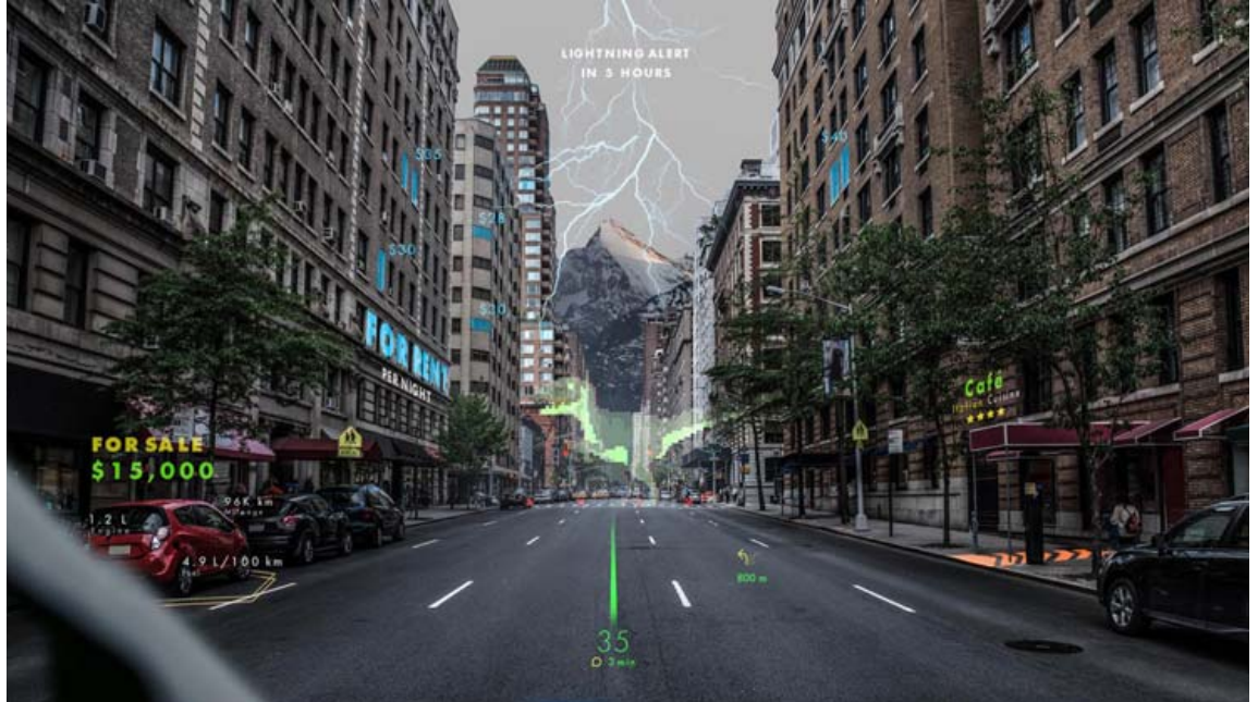
Ekkert annað fyrirtæki býr yfir þeirri þekkingu og færni sem sérfræðingar WayRay hafa á birtingu heilmýnda af upplýsingum í háskerpu.