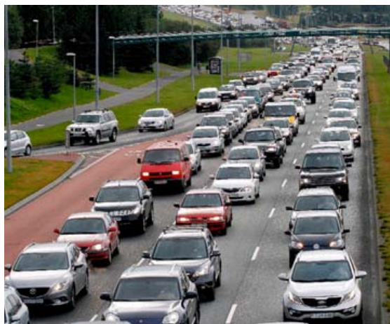
Umferðin í Reykjavík er þung á álagstímum og útblástur frá bílum því mikill.

Í nýrri skýrslu stjórnvalda um skatta á ökutæki kemur fram að frá og með 1. september og til næstu áramóta verði notast við gamla útblástursgildið NEDC, en fyrir bíla sem einungis munu hafa nýja gildið, WLTP, verði það lækkuð um 17,36% í mótvægisáðgerðum. Frá byrjun árs 2019 ætla stjórnvöld svo að falla frá 10 flokka vörugjaldstoflunni og taka upp línulega álagningu en áfram verður notast við NEDC-gildið á þeim bílum sem hafa það áfram á COC-vottorðum sínum. Árið 2020 mun svo gamla gildið, NEDC, falla niður alfarið, við innflutning á nýjum bílum, en áfram verður stuðst við línulega vörugjaldaálagningu.