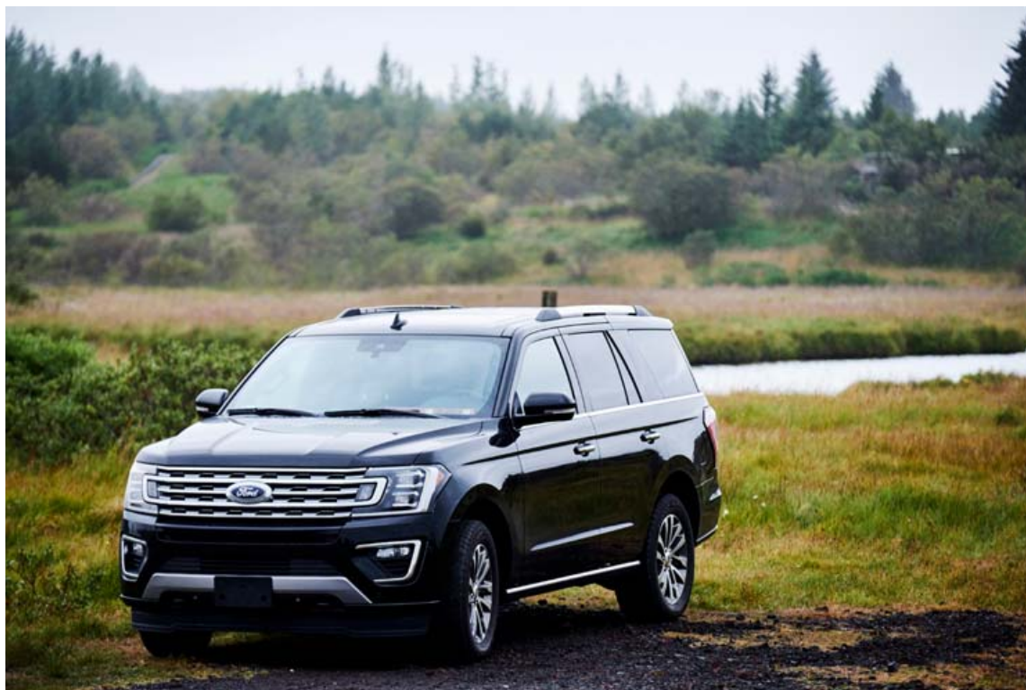
Ford Expedition er risastór átta sæta jeppi sem hentar stærri fjölskyldum, þeim sem þurfa mikið pláss fyrir farangur eða fyrirtækjum í ferðabjónustu.

Vélin í reynsluakstursbílunum var 3,5 lítra V6 EcoBoost vél með tveimur forþjöppum, 375 hestófl og hentar þessum bíl sannast sagna einkar vel. Hann er þrýðilega frískur með henni og alls ekki brennandi þörf fyrir meira afl, þó svo Ford bjóði þessa vél háþrýstari og skráða fyrir 400 hestöflum. Með ári góðri 10 gira skiptingu, já, ég sagði 10 gira skiptingu, er aflíð alltaf til staðar. Það er ekki svo að greinarritari muni hægt að fá bíl með fleiri girum í sjálfskiptingunni, en hvar endar þetta? Þessi vél og skipting kemur beint úr Ford F-150 pallbílunum, mest seldi bíl Bandaríkjanna og því má treysta þessum vélbúnaði. Margt er reyndar sameiginlegt með Expedition og F-150 og undirvagninn sá sami þó lengdur sé en segja má að uppbygging þessa bíls sé mix