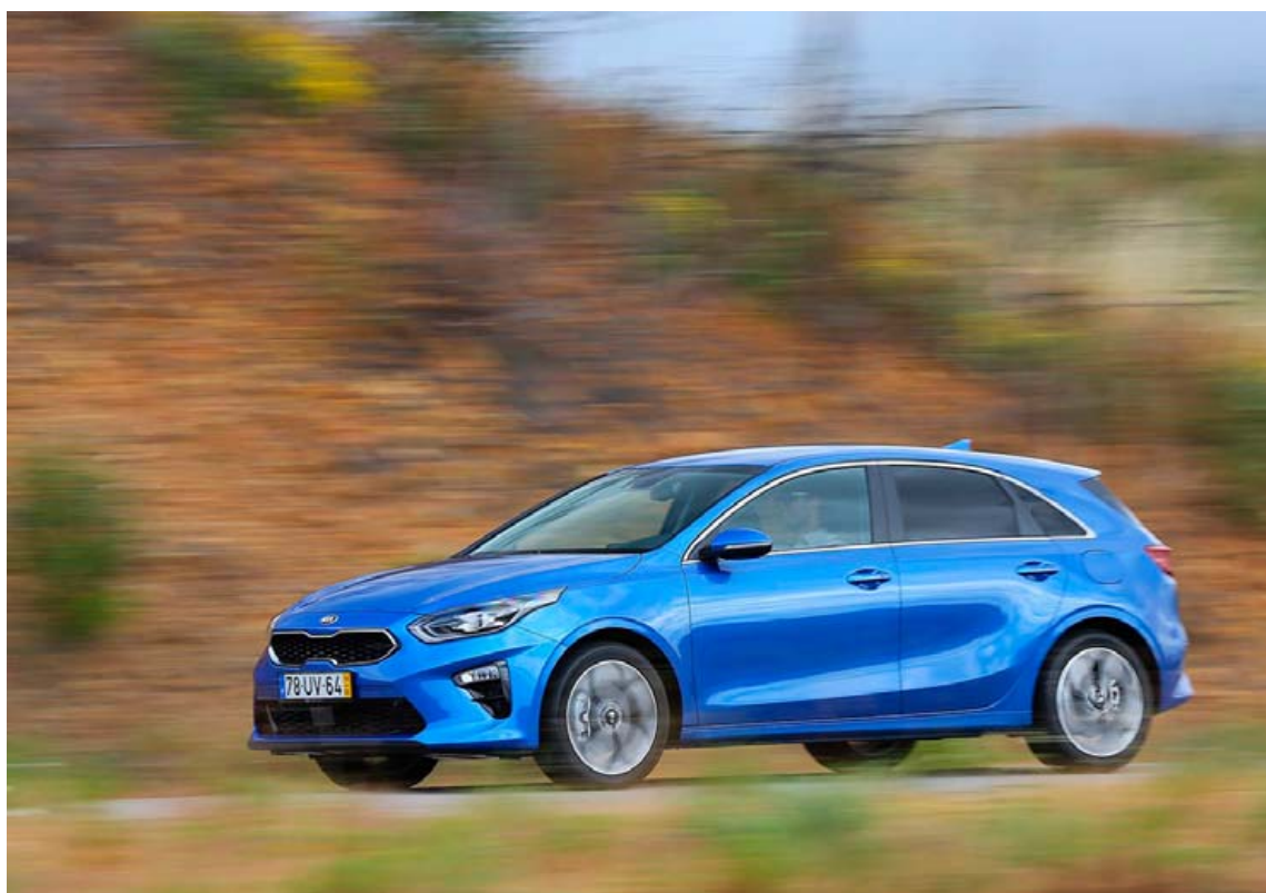
Kia Ceed kom fyrst til sögunnar árið 2006 og önnur kynslóð hans var kynnt árið 2012. Ceed fellur í C-stærðarflokk bíla og hefur selst mjög vel í Evrópu.

Í sem fæstum orðum þá hefur aksturshæfni bílsins aukist mikið og til að sýna það með sem skýrustum hætti setti Kia upp ýmsar skemmtilegar þrautbrautir