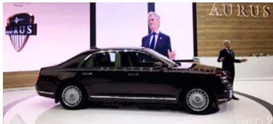
Hinn rússneski Aurus Senat er hladdinn munaði og ekki skortir hann heldur afl.

sjálfskiptingu. Þessi vél var þróuð með hjálp Porsche. Billinn er að auki fjórhjóladrifinn. Viður, leður og þússað stál er allsráðandi í innanrymi bílsins og billinn því ríkulegur mjög. Hann er mjög vel tæknilega búinn og með allra-handa aksturs- og öryggisbúnaði sem líklega er fenginn frá bílaframleiðendum vestar í álfunni. Framleiðandi Aurus Senat, sem ber nafnið Nami, hefur ekki enn látið uppi verð þessa bíls, en það er örugglega stór haugur af rúblum.