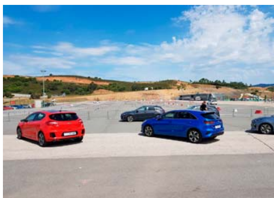
Þrautbrautin sem reyndi mikið á aksturshæfni blaðamanna og bílsins.

Fáir verða fyrir vonbrigðum við að stiga inni þennan bíl. Það sem enn meira máli skiptir er hve vel er frá öllu gengið og smíðin góð, sem reyndar einkennir Kia-bíla.