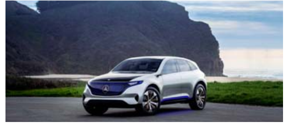
Mercedes Benz EQ C er fyrsti hreinræktaði rafmagnsbíllinn frá Benz.

Mercedes Benz ætlar að smíða marga bíla undir merkjum EQ enda líkt og aðrir bílaframleiðendur með mikil áform er kemur að rafmagnsbílum.