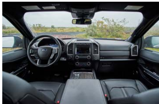
Gríðarlega vel fer um alla farþega í glæsilega innréttuðum risajeppanum.

Ford Expedition er gríðarlega vel útbúinn bíl tæknilega með öllum hugsanlegum aðstöðar- og öryggiskerfum og miklum lúxus. Of langt mál er að telja þetta allt upp, en sem dæmi er bæði kæling og hiti í rafdrifnum framsætunum og hiti í aftursætum. Feikilega gott Bang & Olufsen hljóðkerfi var í reynsluakstursbílunum sem veitti greinarritara mikla ánægju. Samskiptakerfið er með raddstýringu og 6 USB-tengi eru um allan bíl og þráðlaust hleðslusvæði fyrir farsíma. Vel er hugsað fyrir drykkjuþörf allra farþega og aukageymsluhólf um allan bíl. Tígnarlegt var að sjá að halla má öftustu sætaröðinni rafrænt og þar er merkilega gott fótarymi en höfuðrymi leyfir ekki stærri einstaklinga en 180 cm. Minnstu vinirnir fara því þangað, eða börnin. Ford Expedition er sérstakur bill sem hentar þó vel þröngum hópum með ákveðnar þarfir. Ekki fæst stærri jeppi og það gefur mikla möguleika, en þeir sem ætla að kaupa sér fimleigan akstursbíl þurfa einfaldlega að fá sér minni bíl og líklega evrópskan eða frá Asíu. Þessi bíl getur þó dregið 4 tonna aftanivagn, geri aðrir betur.