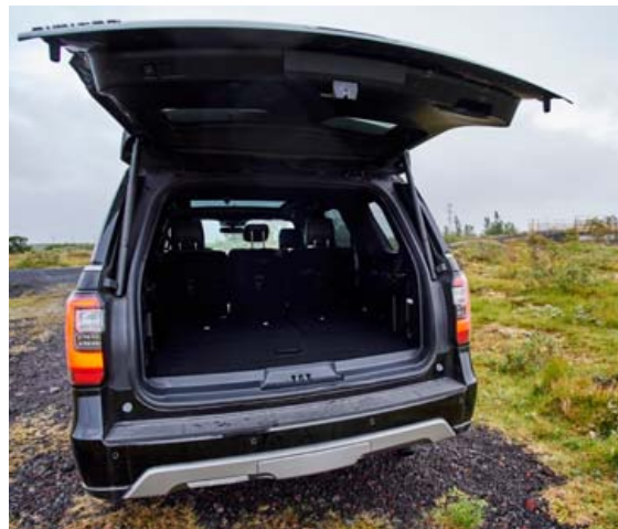
Ekki skortir flutningsrymi og minnir það einna helst á 20 rúmmetra gám.