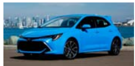
Venjuleg Toyota Corolla bifreið.