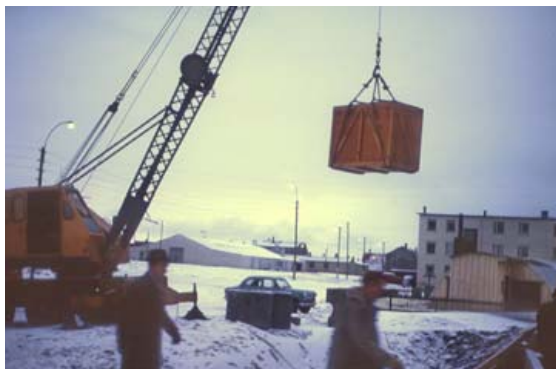
Önnur af fyrstu tölvunum við hús Háskóla Íslands í október 1964.

Fyrri tölvan kom 5. október 1964 í þremur trékössum sem innihéldu vélasamstæðu sem Skýrsluvélar ríkisins og Reykjavíkurbæjar höfðu tekið á leigu hjá bandaríska fyrirtækinu IBM. Stuttu síðar, eða miðvikudaginn 14. október, var skipað upp annarri vélasamstæðu, einnig frá IBM, sem átti að fara til Háskóla Íslands. Hún vakti ekki jafn mikla athygli fjölmiðla og var aðeins getið í eins dálks frétt í Morgunblaðinu undir fyrirsögninni „Raf-