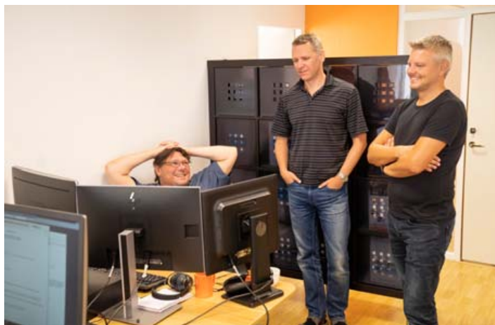
Starfsmenn í hugbúnaðarþróunardeild OneSystems sem er íslenskt fyrirtæki sem þróar íslenskan hugbúnað fyrir íslenskar aðstæður.

að veita góða þjónustu enda hefur fyrirtækið á að skipa fólki sem býr yfir þekkingu sem er eins og best gerist á þessu sviði.“