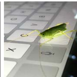
Hugtakið „bug“ í tölvum er tilkomið vegna flugu sem gerði usla í tölvu.

Heimild: Saga tölvuvæðingar á Íslandi 1964-2014