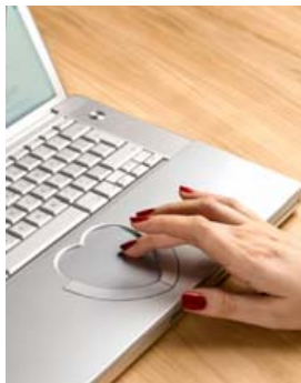
Excel-forritið er til margra hluta nýtsamlegt og gott að kunna vel á það.