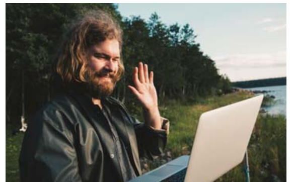
Það er oft talað um skaðsemi misnotkunar samfélagsmiðla, en samskiptahugbúnaður getur líka minnkað einmanaleika og aukið hamingju.

Hugbúnaður er almennt hvorki himnasending né bölvun, heldur verkfæri sem er bæði hægt að nota rétt og misnota. Ef við notum samskiptahugbúnað í staðinn fyrir að hittast erum við að tapa, en ef við notum hann til að hafa samskipti við aðra sem við gátum ekki haft áður græðum við.