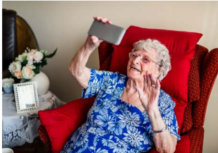
Eldra fólk getur grætt hvað mest á því að nota samskiptahugbúnað.

Samfélagsmiðlar geta líka komið að gríðarlegu gagni við að tengja fólk saman á ýmsan hátt, séu þeir notaðir rétt. Þeir geta líka komið að miklu gagni við að hjálpa fólki að finna aðra með sameiginleg áhugasvið eða viðhorf og það sama