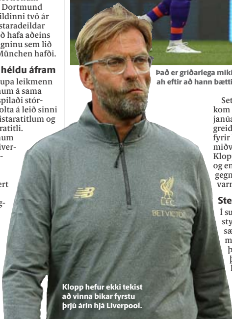
Klopp hefur ekki tekist að vinna bikar fyrstu þrjú árin hjá Liverpool.

Setti Liverpool ný viðmið þegar kom að kaupum á varnarmanni í janúar síðastliðnum þegar félagið greiddi stórfé, 75 milljónir punda, fyrir Virgil Van Dijk, hollenska miðvörðinn frá Southampton. Klopp einblíndi á að fá Van Dijk og engan annan og fékk það í gegn en hann kom með meiri ró í varnarleik liðsins.