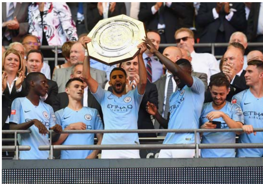
Riyad Mahrez lyftir Samfélagsskjöldinum eftir sigur Manchester City á Chelsea á sunnudaginn.

City hafði mikla yfirburði í ensku úrvalsdeildinni á síðasta tímabili og sló fjölmörg met á leið sinni að Englandsmestarartitlinum. City skoraði m.a. 106 mörk. Söknaarleikurinn var því í góðu lagi og hann veiktst ekk-