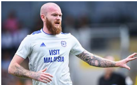
Aron Einar Gunnarsson í leik með Cardiff fyrr í sumar.