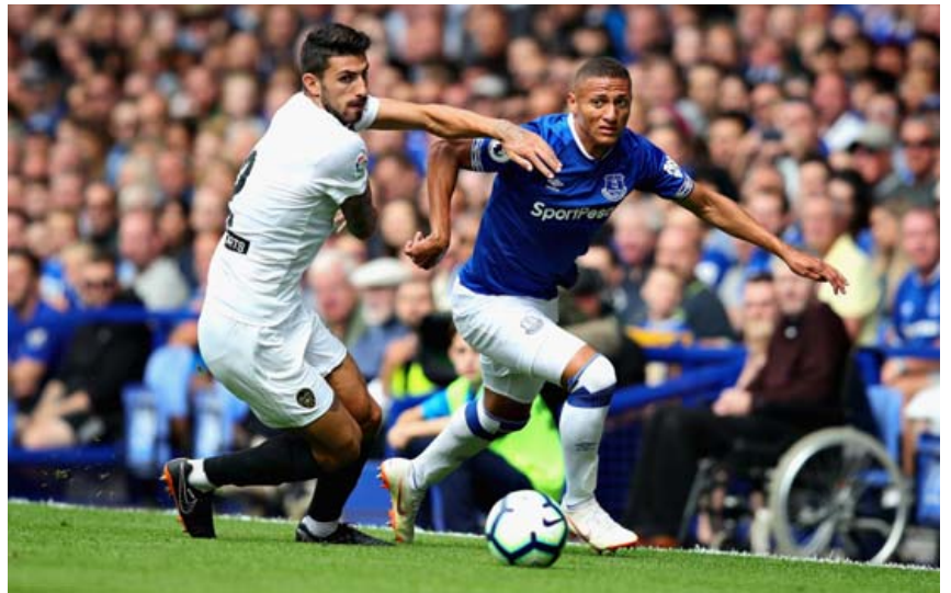
Richarlison sem kom til Everton frá Watford í sumar með boltann í leik með liðinu gegn Valencia.

Það er því líklegt að Everton leiki með tvo brasilíska sóknartengiliði sinn hvorum megin við Gylfa Þór sem verður í hlutverki sóknarsinnaðs miðjumanns. Sóknarlína Everton er þar af leiðandi örvin mun kvikari og tæknilega betri en sú sem liðið hafði á að skipa síðasta vetur. Hinn fótfrái Theo Walcott þarf því að hafa meira fyrir því að komast í byrjunarliðið en undir stjórn Sams Allardyce.