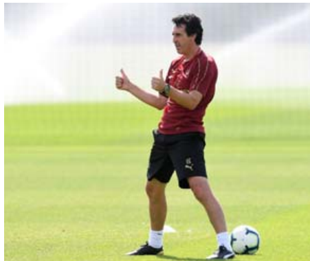
Unai Emery sem tók við sem knattspyrnustjóri Arsenal í sumar stýrir hér leikmönnum sínum á æfingu liðsins í sumar.

Arsenal tókst ekki að tryggja sér sæti í Meistaradeild Evrópu síðast- liðið vor, en liðið hefur leikið í Evr-