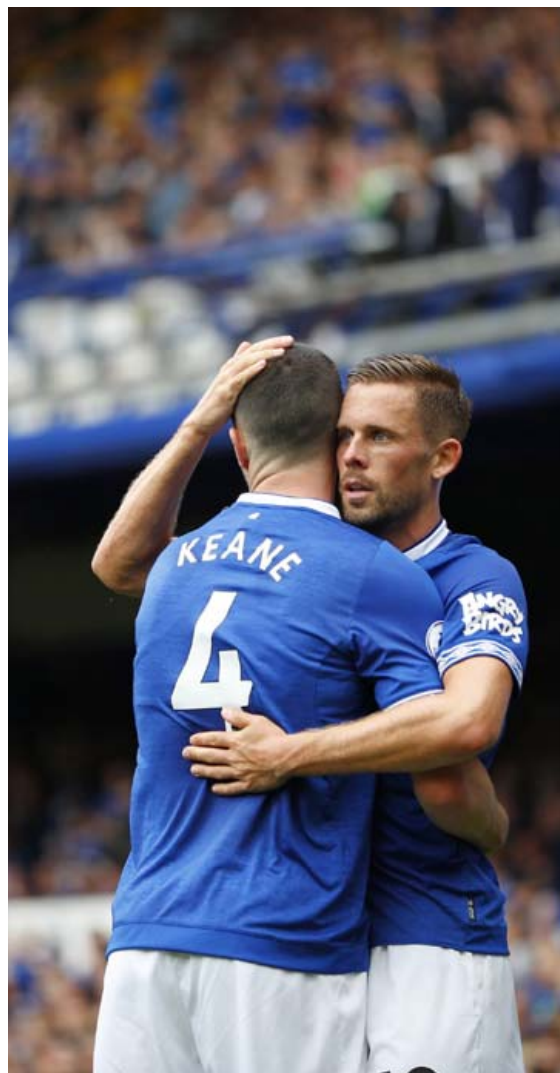
Gylfi Þór Sigurðsson fagnar marki sem hann lagði upp fyrir Michael Keane í vináttuleik Everton á undirbúningstímabilinu í sumar.

Sjálfur sagði Gylfi í samtali við staðarblaðið í Liverpool vera feginn að fá að spila sína stöðu inni á vellinum, á miðri miðjunni, eins og hann hefur gert með göðum