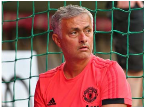
Margir spá því að José Mourinho, hinn portúgalski stjóri Manchester United, verði horfinn á braut áður en tímabilið er á enda.

Stærsta verkefni Mourinhos verður að fá enn meira út úr sínum