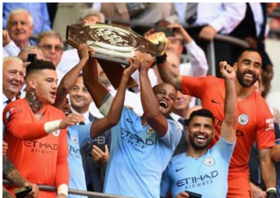
Englandsmeistarar Manchester City unnu öruggan sigur á Chelsea, 2-0, í leiknum um Samfélagskjöldinn um síðustu helgi.