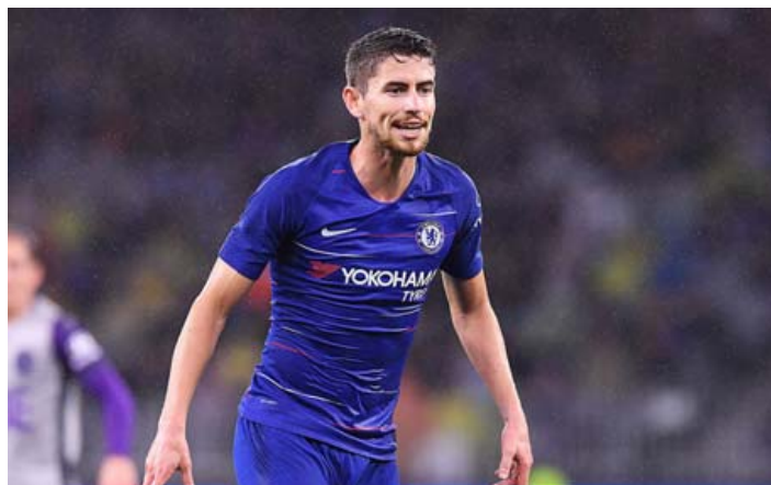
Jorginho verður mikilvægur hlekkur í liði Chelsea í vetur.

Jorginho er fæddur í Brasilíu en fluttist til Ítalíu þegar hann var 15 ára. Hann er ítalskur ríkisborgari og hefur leikið átta leiki fyrir ítalska landsliðið. Jorginho hóf ferilinn hjá Verona en gekk í raðir Napoli 2014.