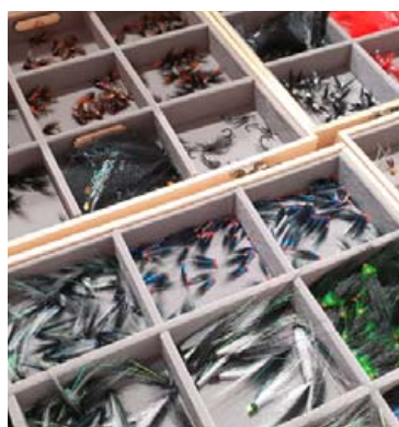
Veiðiflugurnar í versluninni eru af margvislegum stærðum og gerðum, íslenskar og erlendar.