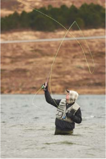
Veiðikortið gefur fjölskyldum tækifæri til að veiða saman.