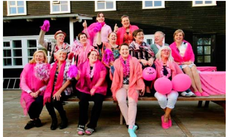
Mikil og góð stemning myndast í hópnum hverju sinni.

FRÉTTABLAÐIÐ mest lesna dagblað landsins.