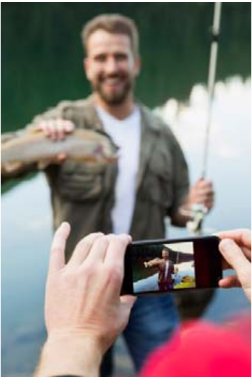
Plastpokar með rennilás hafa bjargað mörgum snjallsímum.

Hægt er að kaupa Veiðikortið 2018 á netinu, næstu N1-stöð, Olís-stöðvum, hjá Íslandspósti og í veiðivörverslunum um land allt og víðar. Einnig er hægt að kaupa Veiðikortið niðurgreitt hjá mörgum stéttarfélögum.