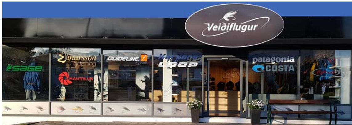
Það er mikið úrval af frábærum flugum í versluninni Veiðiflugur við Langholtsveg auk annarra veiðivara.