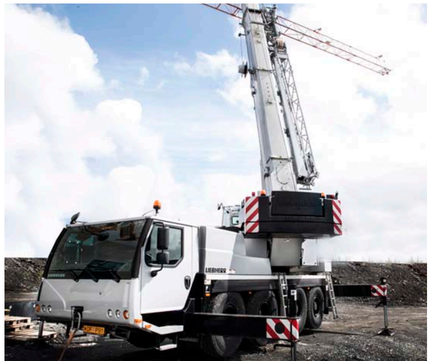
Starfsfólkíð er sérhæft í vinnu á bílkrönum.