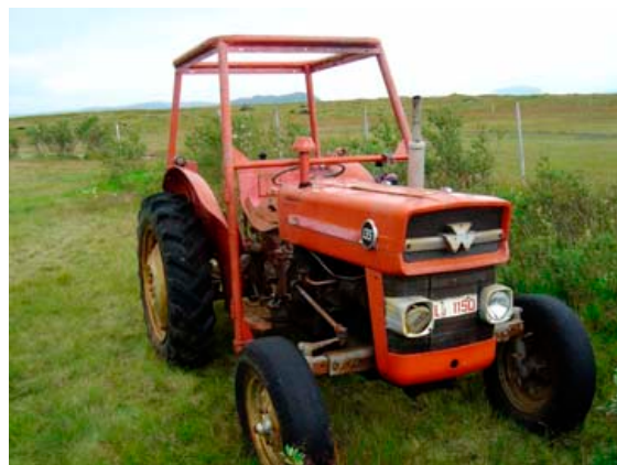
Dráttarvélin áður en hún var tekin í gegn.