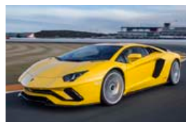
Lamborghini-safnið á Ítalíu er draumastaður.

safnið í München. Þessir bílar eru frægir fyrir gæði og glæsileika og gaman að skoða hvernig þeir hafa þróast í gegnum tíðina.