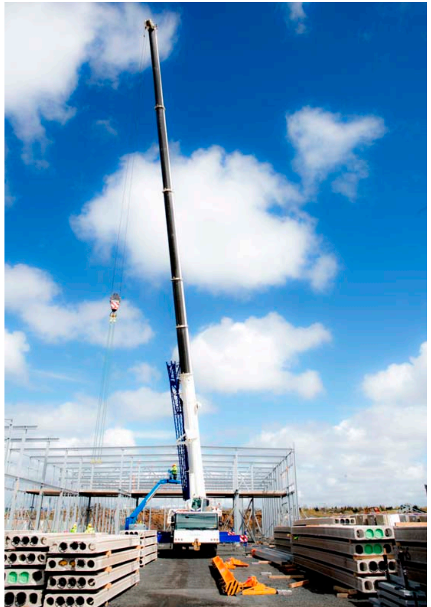
Kraftkranar eru sérhæfðir í vinnu við stálgrindarhús og einingahús.