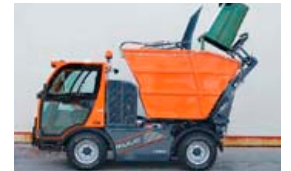
Tækið er öflugt þótt smátt sé.