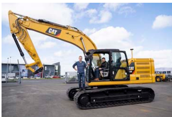
Klettur býrjaði nýlega að að selja nýja kynslóð af beltagröfum frá Caterpillar, en þær eru af gerðinni 320 og 323.