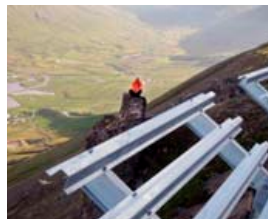
Útsýnið er svakalega falllegt úr hliðunum fyrir ofan Siglufjörð.

Aðstæður eru oft mjög erfiðar þar sem unnið er uppi í miðjum klettum fyrir ofan Ísafirð.