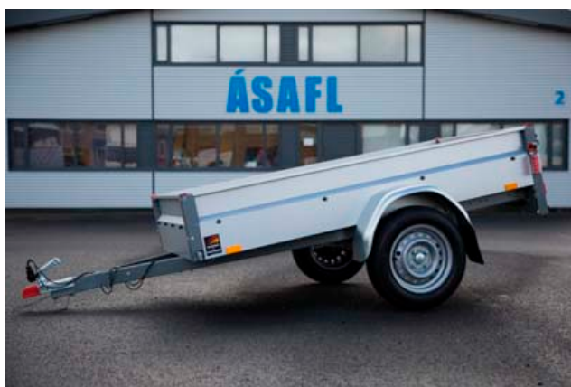
Stema Basic 750 Verð kr. 124.900 m.vsk

Ásafl er umboðs- og þjónustuaðili Stema á Íslandi