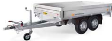
Flatvagnar-ymsar stærðir, 2000kg-3500kg, mál frá 2,65x1,65m til 6,10x2,48m.