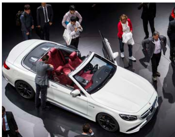
Reikna má með að verja heilum degi í að skoða Mercedes-Benz safnið í Stuttgart. Þar er farið vel yfir sögu fyrirtækisins og margir eðalvagnar til sýnis.

umfangsmikið og vert að gefa sér góðan tíma til að skoða hvað þar er í boði. Þar má sjá bíla frá árdögum Honda og allt fram til dagsins í dag. Þar er fjöldi mótörhjóna til sýnis og öll helstu keppnishjól frá Honda sem eru hvert öðru glæsilegra. Einnig gefur að líta yfirlit yfir nýjustu tækni sem bílafram-