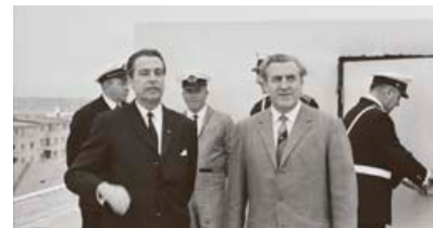
Mynd tekin 26. maí 1968 á þaki Lögreglustöðvarinnar á Hverfisgötu þegar skipt var í hægri umferð.