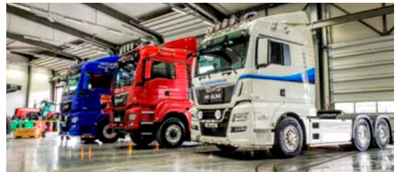
MAN vörubílar í ýmsum útfærslum.