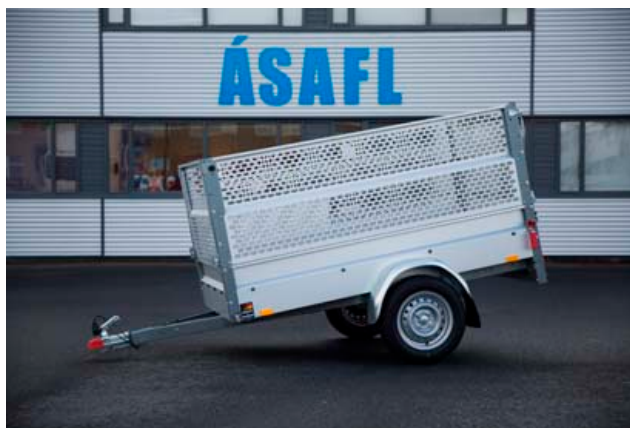
Stema Basic 750 með grindar upphækkun Verð kr. 209.000 m.vsk

Ásafl ehf. Hjallahrauni 2 220 Hafnarfirði www.asafl.is