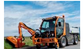
Hentar einnig í slátt.