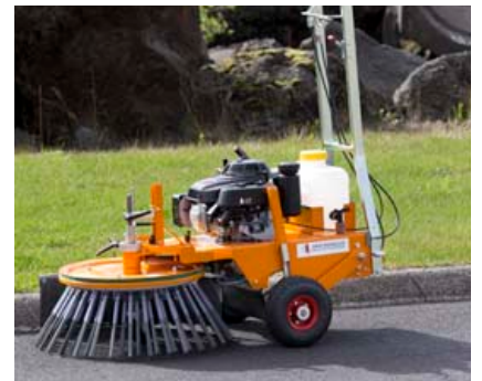
Tæki til að fjarlægja illgresi frá Michaelis sem er sjálfstætt tæki með drifi á hjólum eða sem bursti.