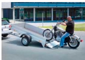
750kg kerra, gerð 1384, mál: 251x131x35cm með sturtum. Verð kr: 229.839,- án vsk.