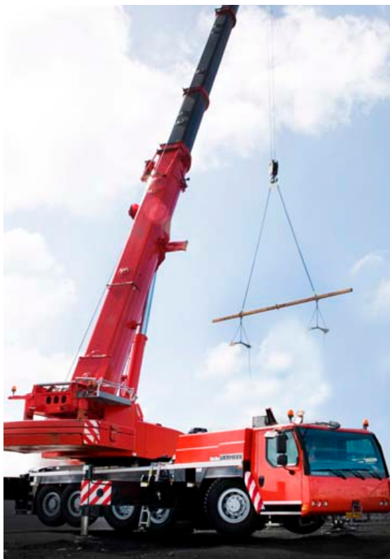
Kraftkranar hafa þjónustað stærri verktaka á borð við ÍSTAK og IAV-verktaka.