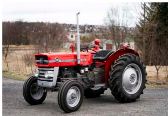
Sveinn lét sérblanda lakk til að fá rétta litinn á dráttarvélna og útkoman er glæsileg.

unnið á vélinni sem unglingar. Hún vakti að vonum mikla athygli, enda orðin eins og ný.