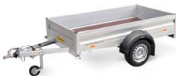
750kg kerra, gerð 1374, mál: 251x131x35cm, opnanleg að framan. Verð kr: 201.612,- án vsk.