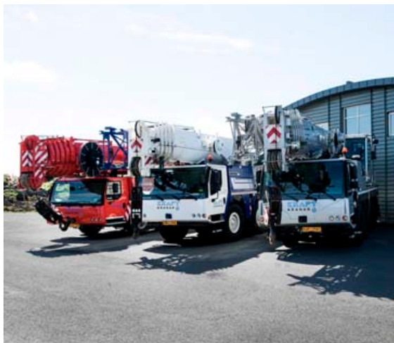
Kraftkranar hafa yfir að ráða öflugum flota af bílkrönum fyrir stærri sem minni verkefni.