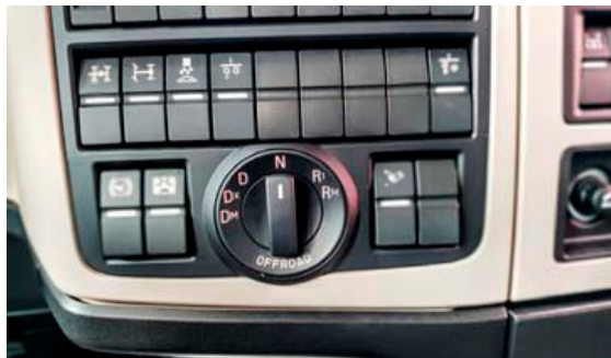
Girskiptingin er einföld.

Grímur segir að í nýju týpunni séu einnig komnar nýjar vélar sem skili meira togi og fleiri hestöflum en sama rúmtaki. „Það er hægt að velja þá frá 420 og upp í 500 hestöfl, tölvaskipa með öllum nýjasta öryggisbúnaði. Þá hefur MAN breytt hlutföllum á drifi til að ná niður snúningnum á vélinni en með þeirri breytingu er rútan MAN Lion's Coach bæði hljóðlátari en aðrar rútur og eyðir minna eldsneyti.“