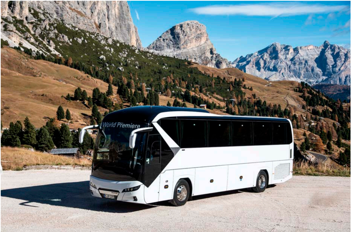
Glæsileg MAN Tourliner rúta. Hægt er að fá rútna að innan eins og hentar fyrir hvaða aðstæður sem er, t.d. er hægt að hafa í þeim eldhús, svefnaðstöðu fyrir ökomann, salernisaðstöðu og margt fleira.