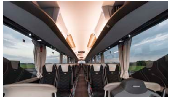
Sætaröðin í Neoplan Tourliner.

Vörumiðlun ehf. fékk á dögnum afhentan fyrsta MAN TGX 2018 með nýju innréttingunni sem margir hafa beðið eftir, en MAN TGX er stærsti vörubíllinn frá MAN. „Við erum afar stoltir af MAN TGX-bílnum og sérlega ánægðir með að geta boðið upp á nýju innréttinguna sem beðið