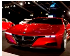
BMW-safnið er í München og þykir skyldustopp fyrir bílaáhugafólk.

Í Þýskalandi eru tvö fræg bílasöfn. Annað þeirra er Mercedes-Benz safnið í Stuttgart og hitt er BMW-