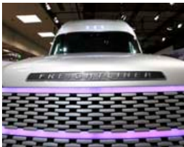
Þessi Daimler AG Freightliner Cascade vörubíll var til sýnis á IAA fyrir tveimur árum.