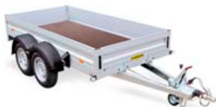
Tveggjaaxlakerra, 2500kg, gerð 2331, mál: 3,03x1,50m, opnanleg að framan. Verð kr. 431.452,- án vsk.