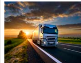
Á langkeyrslum um landið gefst nægur tími til að láta hugann reika.