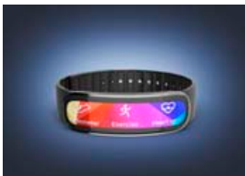
Leigubílstjórar í Singapúr fengu skrefamæli til að hvetja þá til að stiga út og hreyfa sig.

Allar nánari upplýsingar má finna á www.iaa.de .