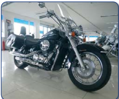
Honda VT 750 C árg 2008 ek 4 þús km Ásett verð 770.000 Rnr. 251329