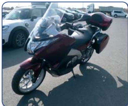
Honda NC 700 Integra árg 2012 ek 1 þús km Ásett verð 1.190.000 Rnr. 271518