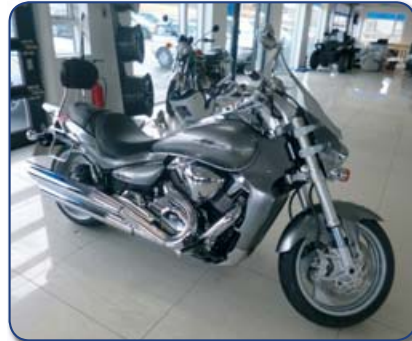
Suzuki VZR 1800 árg 2009 ek 16 þús Ásett verð 1.650.000 Rnr. 251314