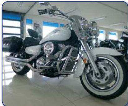
Kawasaki VN 1600 Classic árg. 2003 Ásett verð 1290 þús. Rnr. 251288