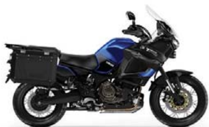
SUPER TÉNÉRÉ RAID EDITION