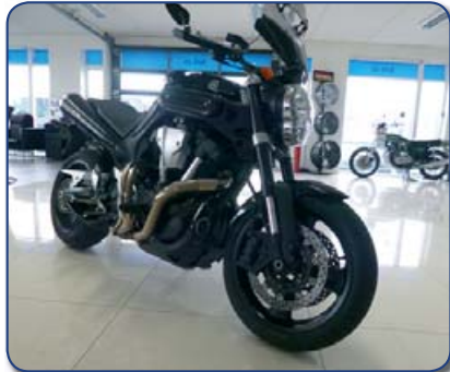
Yamaha MT-01 árg 2008 ek 12 þús km Ásett verð 1.240.000 Rnr.271549