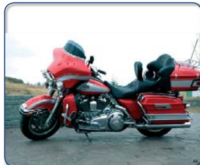
Harley Davidson Ultra Classic ek 245 þús km Ásett verð 2.990 Rnr.271514