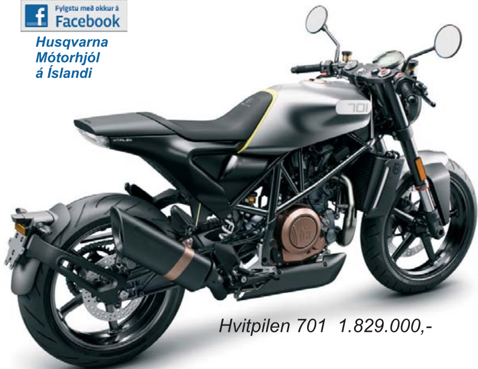
Hvitpilen 701 1.829.000,-