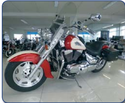
Suzuki VL 1500 árg 1998 ekið 41 þús km Ásett verð 1.200.000 Rnr.251336