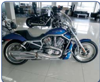
Harley Davidson V-ROD árg 2007 ek 8 þús km Ásett verð 1.550.000 Rnr. 130201