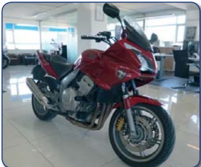
Honda CBF 1000 A árg. 2008 ekið 45 þús km. Ásett verð 680 þús Tilboð Rnr. 251263