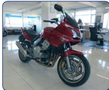
Yamaha FC6 árg. 2007 ekið 20 þús. Verð 790. Þús . Rnr. 250358