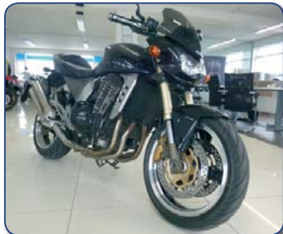
Kawasaki Z 1000 árg. 2004 ekið 37 þús. km. Ásett verð 590 þús. Rnr. 271508