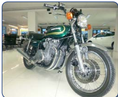
Kawasaki Z 1000 árg 1980 ek 56 þús Ásett verð 1.650.000 Rnr. 251067