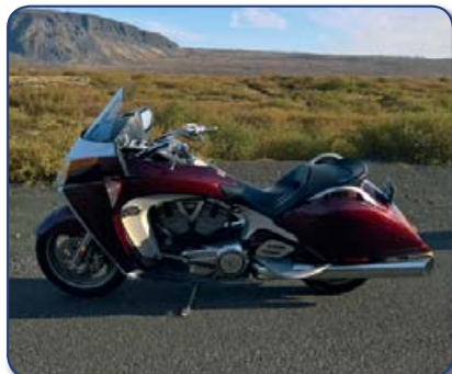
Victory Vision Street árg 2008 ek 55 þús km. Ásett verð 1.670 þús Rnr. 260910