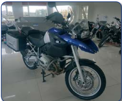
BMW R1200 Árg. 2007 ekið 46 þús Verð 1490 þús. Rnr. 271126