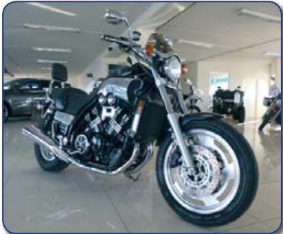
Yamaha V Max árg 2000 ek 32 þús míl. Ásett verð 990 þús Rnr.251274