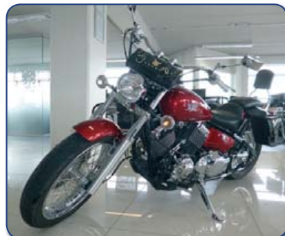
Yamaha V-Star 650K árg 2006 ek 8 þús m Ásett verð 650.000 Rnr. 251253