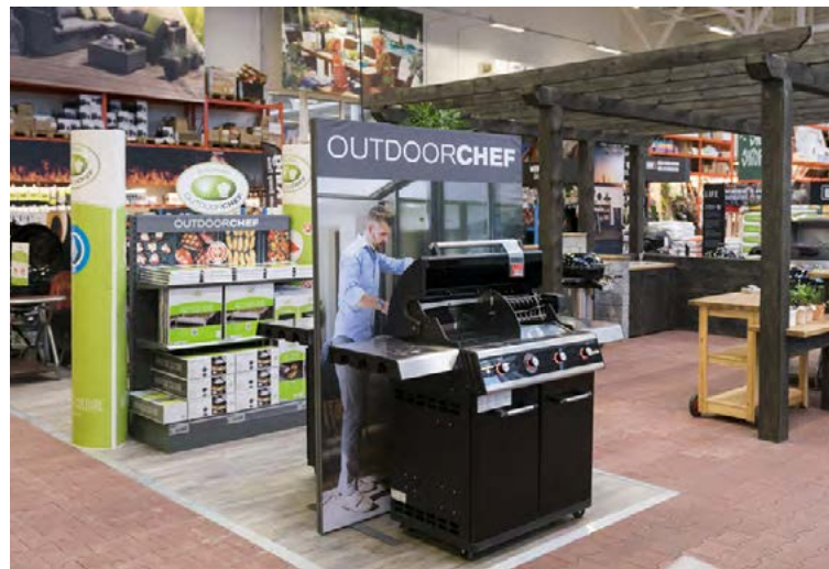
Það er ævintýri að ganga um í Bauhaus og skoða allar sumarvörurnar.

Meðal nauðsynjavara sumarhúsaeygenda má nefna útigrill og segir