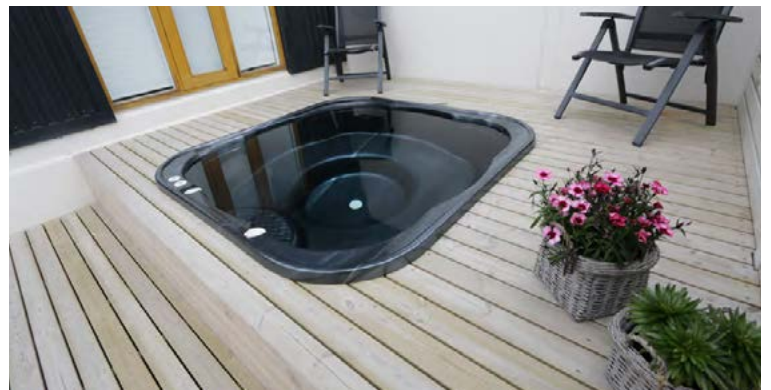
Blómaskel í fallegum garði í Hafnarfirði.