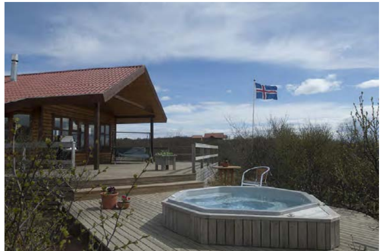
Unaðsskel við sumarþústað í Biskupstungum.

Trefjar bjóða fría heimsendingu á pottunum á höfuðborgarsvæðinu og nágrenni. Einnig er boðið upp á fría heimsendingu á vörum úr netversluninni www.trefjar.is .