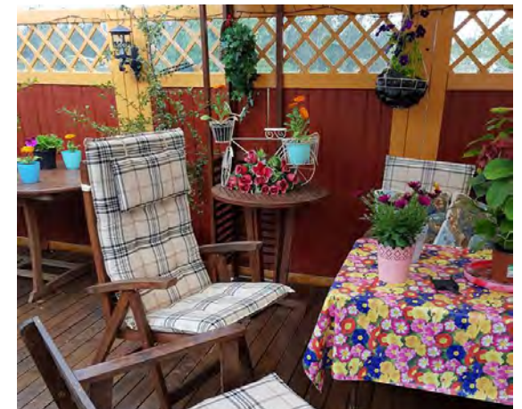
Það er notalegt á pallinum á sumrin.