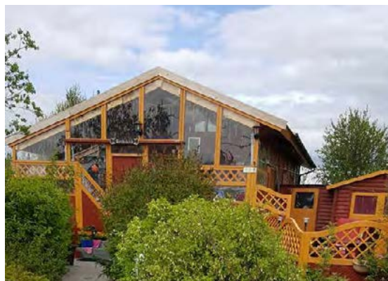
Þústaðurinn er fallegur og Olga heldur honum vel við.