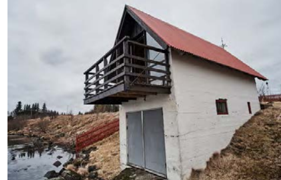
Í bátaskýli kjallarans er kanó sem Unnur rær út á vatnið.

Kínverskar bjöllur syngja úti með hægum andvaranum sem stundum er við vatnið.