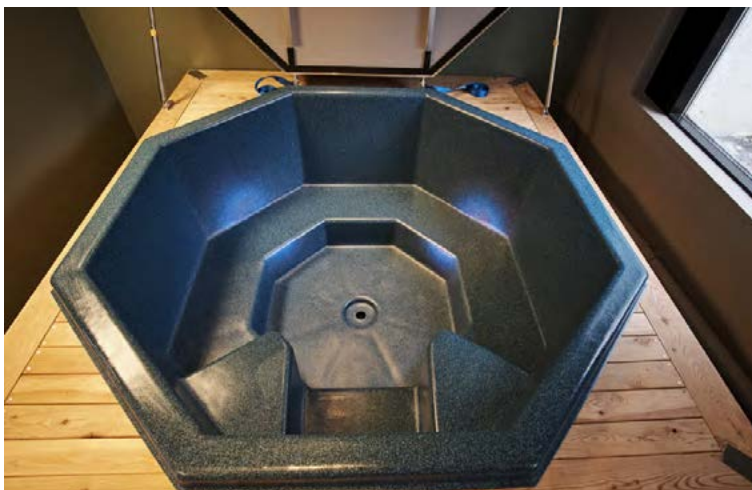
Pottarnir eru stílhreindir með góðu lagi og því afar þægilegir í þrifum.