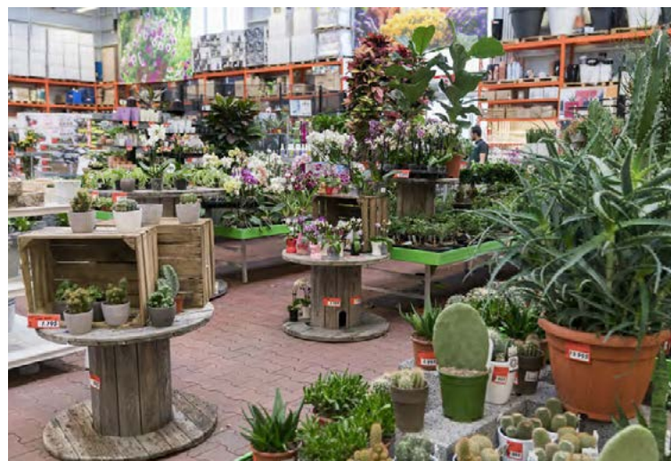
Úrval fallegra pottaplantna bæði utanhúss og innan í Bauhaus.