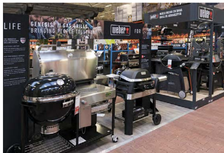
Gæðagrill fyrir sumarið í margvíslegum stærðum og gerðum.