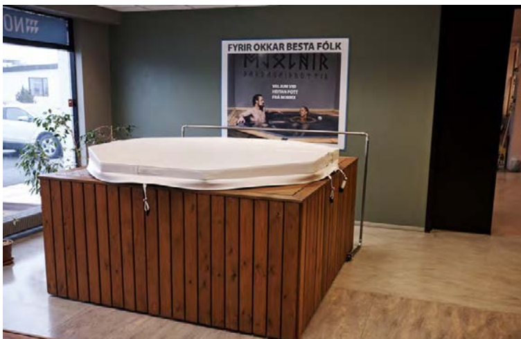
Hægt er að fá burðargrindina undir pottinn smíðaða hjá NormX. Þá selur verslunin lok og aðra fylgihluti fyrir pottinn.

ig ákveðið lag svo þægilegt er að þrifa þá.