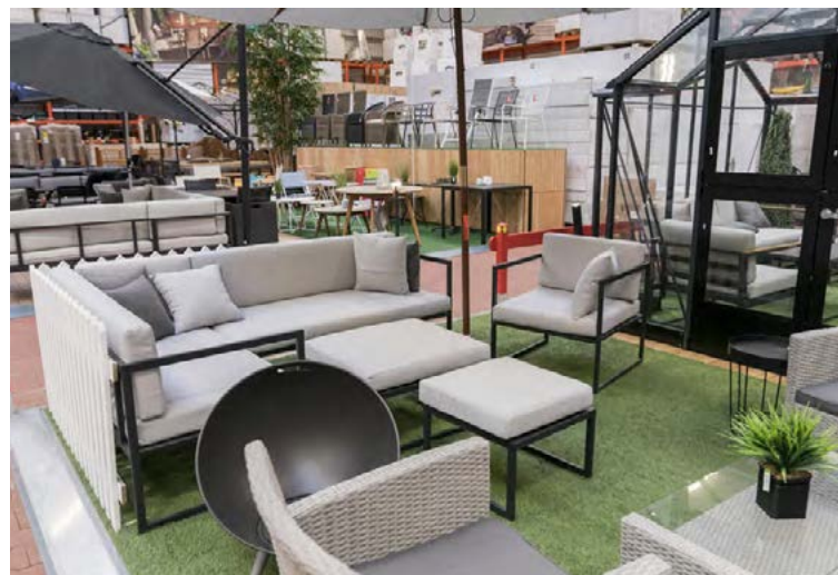
Mikið úrval er af fallegum garðhúsgögnum í Bauhaus.