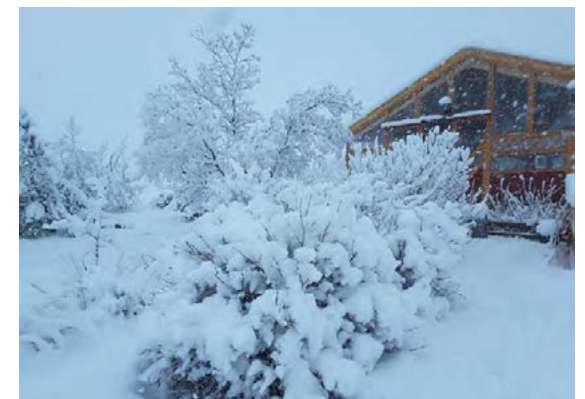
Það var snjóþungt í vetur umhverfis þústaðinn.

efni í sveitinni,“ segir Olga sem ætlar að búa áfram í þústaðnum. „Meðan ég get verið hér ætla ég að gera það.“