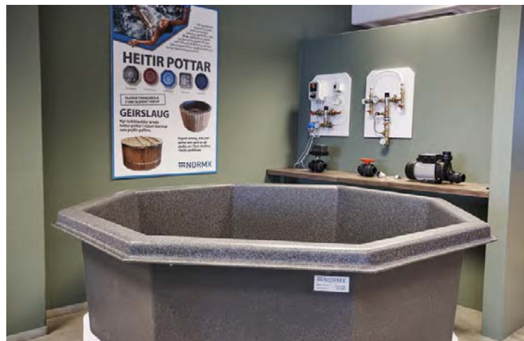
Úrval potta og fylgihluta má skoða á vefsíðunni www.normx.is .

Vatnsleysuströnd en sýningar-salur NormX er í Auðbrekku 6 í Kópavogi. Þar er hægt að skoða úrval potta og einnig vörur og búnað sem þeim tengjast, svo sem nuddbúnað, hitastýringar, lok og fleiri fylgihluti.