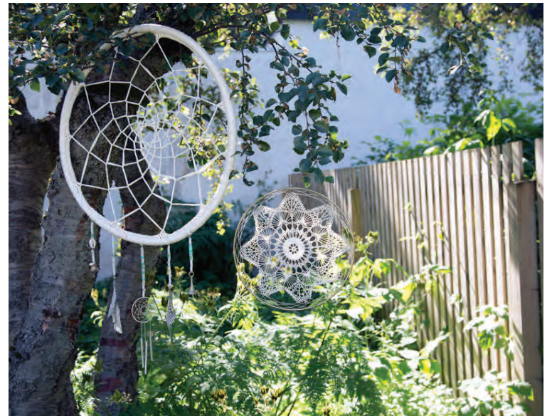
Draumafangaranámskeið Tinna hafa notið mikilla vinsælda enda bæði fallett og auðvelt handverk og falleg hugsun sem býr að baki.

Heklið virkar fyrir Tinna eins og jóga. „Þetta er endurtekning sem kemur þér inn í núvitund, gefur veliðan og tilfinningu fyrir því að hafa áorkað einhverju, skilað einhverju verki sem er bæði gagnlegt og fallett. Og svo er þetta ofboðslega skapandi og ekkert er fallett en heimagerðar gjafir.“