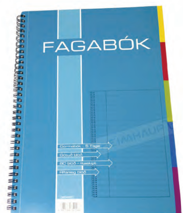
Fagbók 5 faga Verð 1.099 kr.

Birt með fyrirvara um prentvillur og myndabrengl.