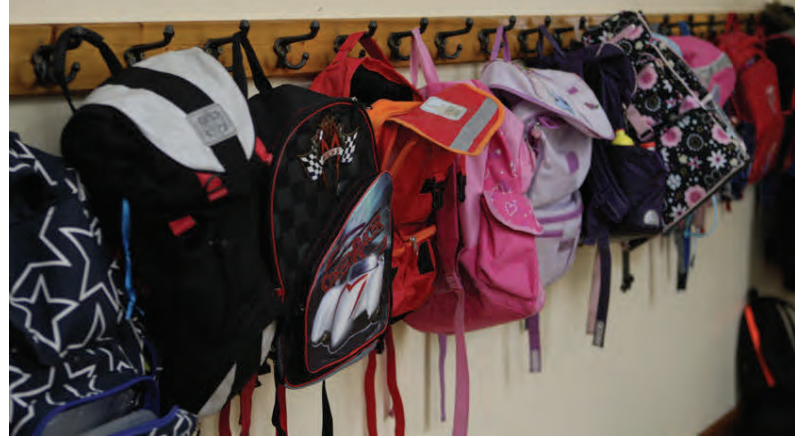
Lóan kemur með vorið en skólatöskurnar með haustið.

Starfsdagar kennara utan starfstíma nemenda eru átta.