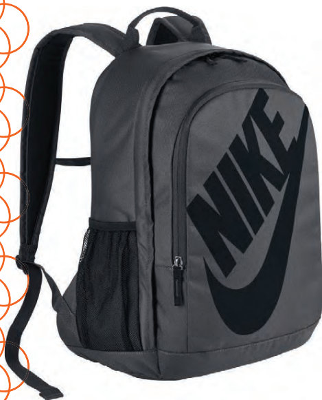
Nike bakpoki Verð 7.999 kr.