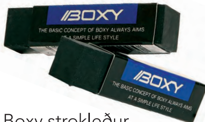
Boxy strokleður Verð 199 kr.