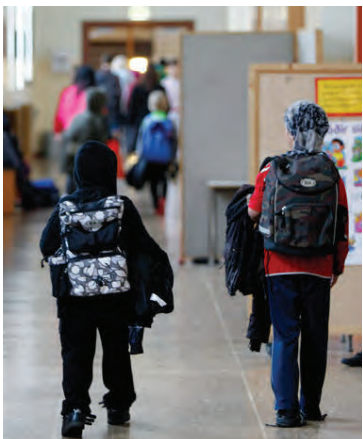
Börn með skólatöskur eru einn helsti fyrirboði haustsins.

State University of New York er fjölmennasti háskóli Bandaríkjana með rúmlega 600 hundruð þúsund nemendur og University of South-Africa er fjölmennasti háskóli Afríku með rúmlega 350 þúsund nemendur. University of Buenos Aires í Argentínu er fjölmennasti háskóli Suður-Ameríku með rúmlega 315 þúsund nemendur og Spíru Haret University í Rúmeníu telst fjölmennasti háskóli Evrópu með rúmlega 310 þúsund nemendur.