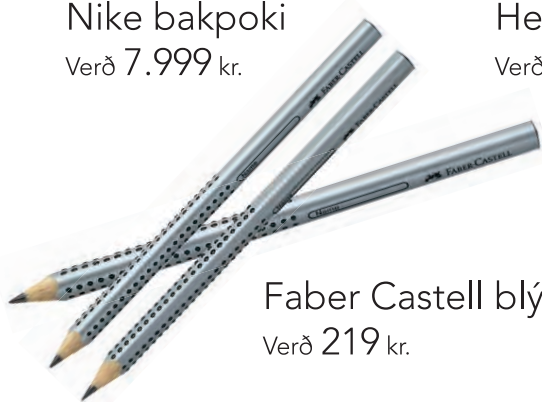
Faber Castell blýantur Verð 219 kr.