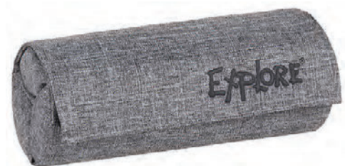
Explore pennaveski Verð 1.999 kr.