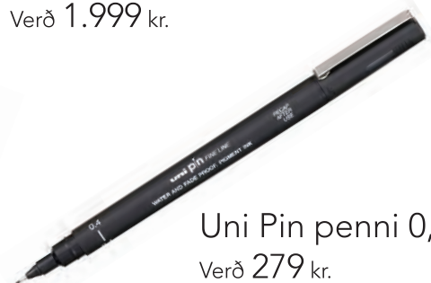
Uni Pin penni 0,4 Verð 279 kr.

Stærsti skiptibókamarkaður A4 er í Skeifunni.