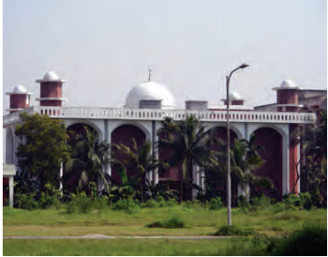
Bangladesh National University er annar fjölmennasti háskóli heims.