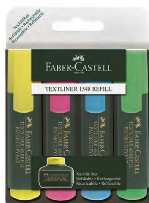
Faber Castell áherslupennar Verð 999 kr.

Tekið er á móti skiptibókum í öllum verslunum A4.