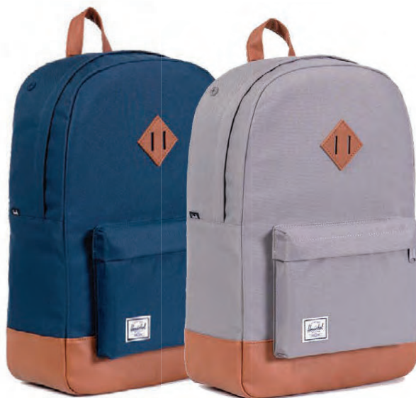
Herschel skólataska Verð 9.995 kr.