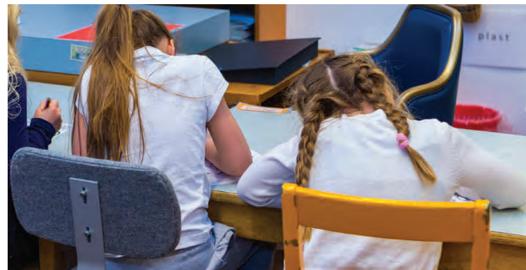
Það þarf að undirbúa sig áður en skólinn byrjar eftir gott sumarfrí.

Ræðið um komandi skólavetur og setjið ákveðnar reglur um heimanám og fritíma. Ef barnið á að byrja í nýjum skóla er gott að æfa göngu- leiðina þangað, skoda umhverfið og finna bestu og stystu leiðina. Þegar liður að því að skólinn hefjist er upplagt að fara saman í verslun og