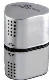
Faber Castell yddari Verð 499 kr.