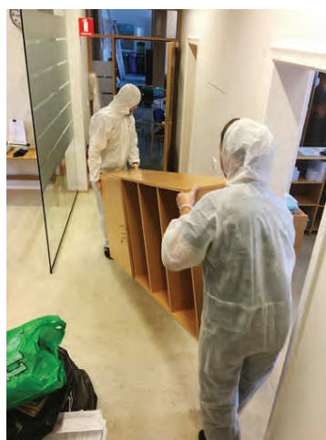
Við hreinsun er farið eftir ákveðnum verkferlum.

„Ef ekki verður vart við leka strax lifir mygla lengi í rakanum og áhrifanna verður jafnvel ekki vart fyrr en mörgum árum síðar.“