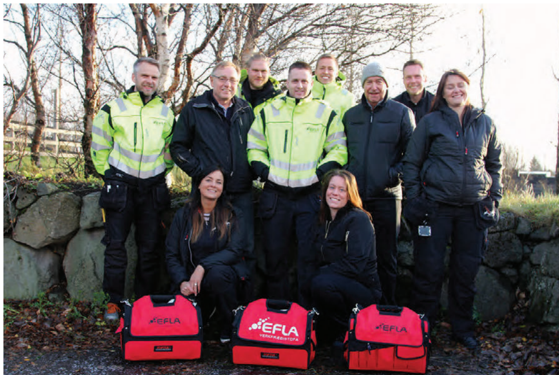
Þverfaglega teymið Hús og heilsa hjá EFLU býður upp á margvíslega þjónustu þegar kemur að rannsóknum og fyrirbyggjandi aðgerðum sem snúa að heilnæmri innivist.