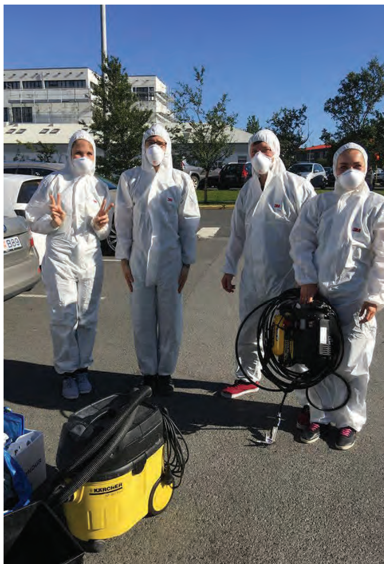
Sérverkefnadeild AP-Prifa sér um hreinsun á myglusvepp.