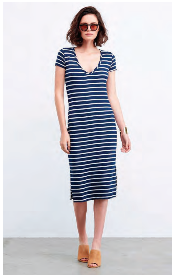
Fatnaðurinn sem boðið er upp á í netversluninni er allur úr náttúrulegum og lífrænum efnum.

Hjá Ethic.is fæst fatnaður frá Amour Vert og People Tree, en einnig hágæða leðurkvenskór frá Fortress of Inca sem eru handgerðir í Perú en einungis er notað afgangsléður úr matvælaíðnaði sem