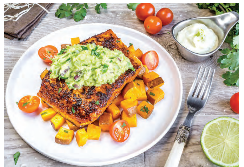
Hér má sjá steiktan lax úr paleo pakknum.

Hann segir starfsfólk Eldum rétt í beinu sambandi við birgjana og leggja mikið upp úr því að fá besta hráefni sem völ er á hverju sinni. „Við fáum inn allar pantanir fyrir miðnætti á miðvikudag og getum þannig áætlað nákvæmlega hvað við þurfum að kaupa inn. Þannig