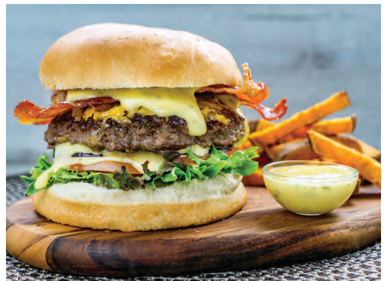
Bernaise- og beikonborgarinn tilheyrir sígilda pakknum.