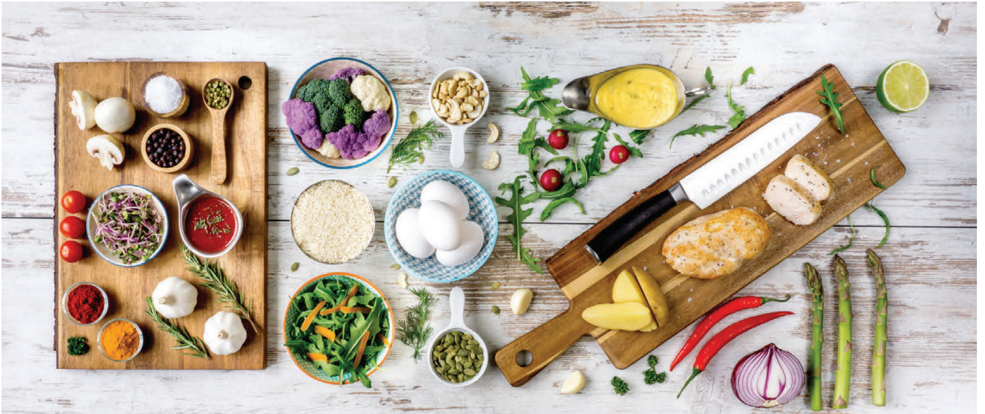
Hráefni eru skömmtuð nákvæmlega í hvern rétt og því er engu sóað.