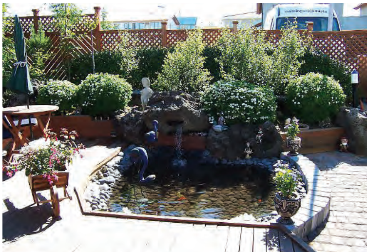
Tjörnin er skemmtileg með litlum gosbrunni.