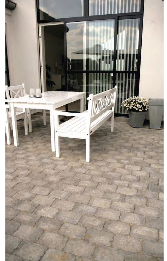
Hellurnar frá IBF henta vel íslenskum aðstæðum.