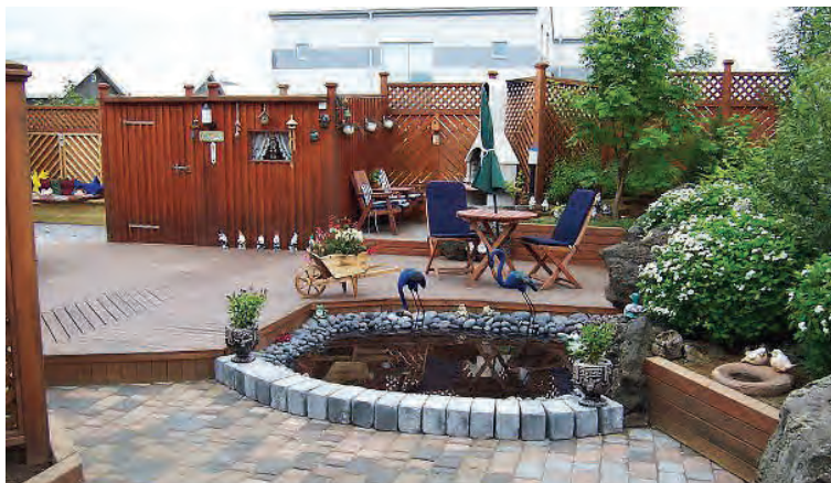
Það er allt til alls í fallega garðinum hennar Gullveigar.