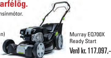
Murray EQ700X Ready Start Verð kr. 117.097,-