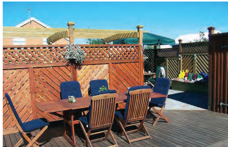
Fjölskyldan borðar úti nánast hverja helgi yfir sumartímann.