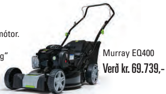
Murray EQ400 Verð kr. 69.739,-