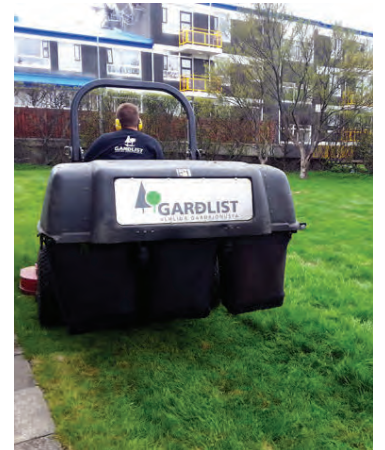
Garðlist sér um að halda garðinum fallegum allt árið.