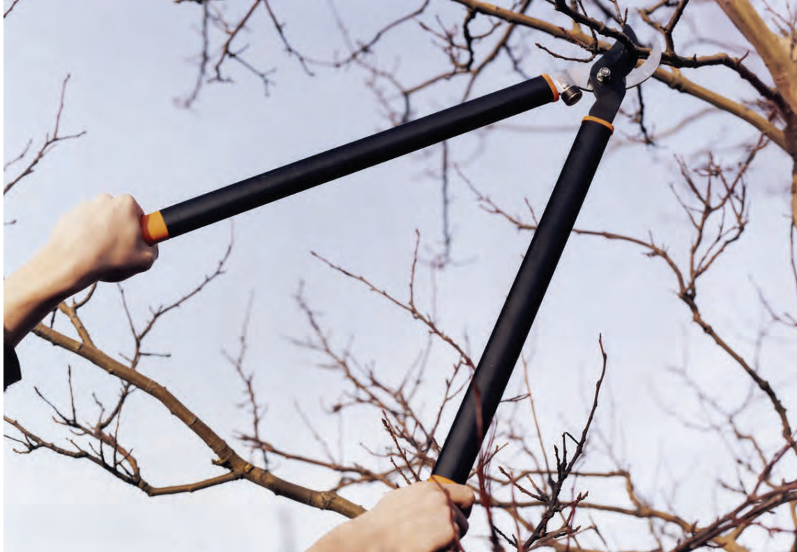
Nú er allra síðasti séns að klippa runna fyrir sumarið.

Þó enn falli snjókorð segir Vilmundur að tími vorverkanna í garðinum sé runninn upp. En hver eru þau helst? „Nú fer hver að verða síðastur ef ætlunin er að sá fyrir matjurtum og sumarblómum innandyra. Nú er líka síðasti séns að klippa tré og runna. Svo má fara