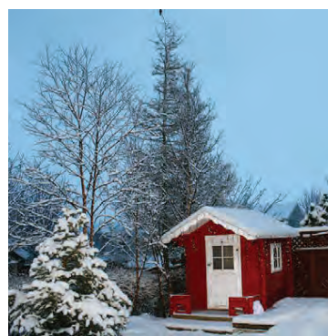
Lítið dúkkuhús er í garðinum en um jólin breytist það í jólahús.

Við höfum hannað pallana eftir því hvar sólin skín og getum sest niður á nokkrum stöðum eftir veðri. Við erum mikið úti á palli.