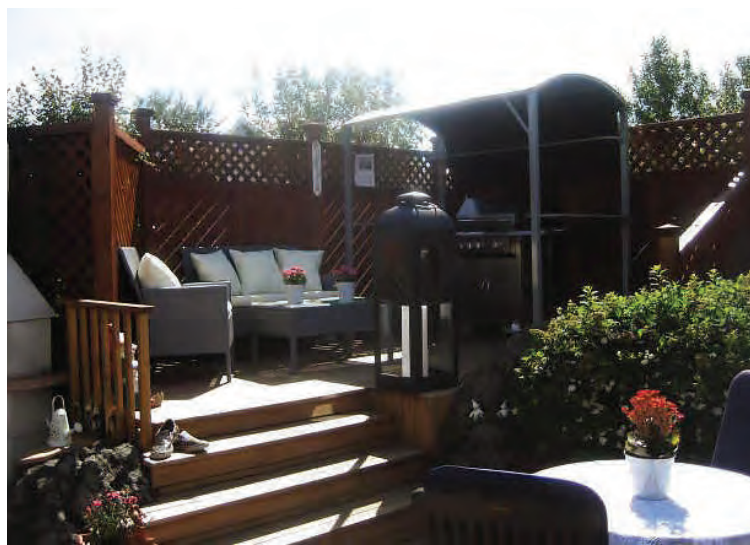
Sérstök grillaðstaða er á efri palli.