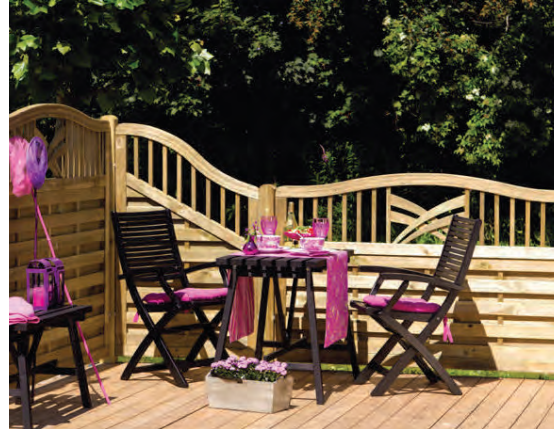
Skjólgirðingar frá Plus og pallaefni frá Frøslev mynda góða heild.