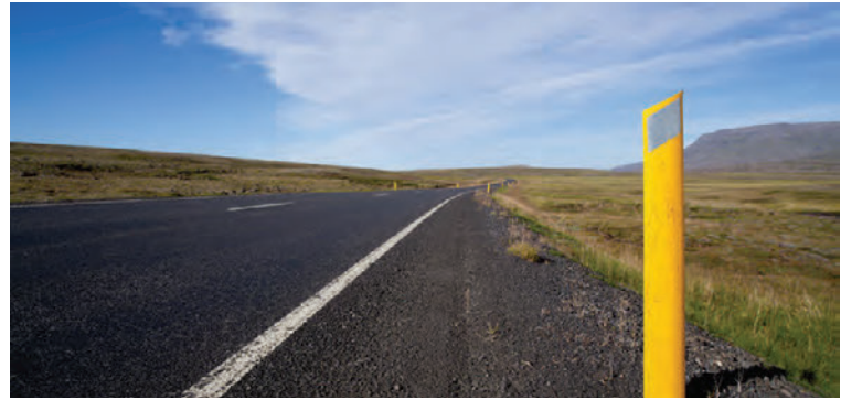
Hraðakstur eykur bensineyðslu og er ekki góður fyrir umhverfið.

Hægt er að draga úr mengun af völdum bíla á ýmsan hátt og lengja um leið endingu dekkjanna. Fá má hjólbarða sem draga úr núningsmótstöðu vegar en það þýðir minni bensineyðsla. Hraðakstur eykur bensineyðslu og er því ekki góður fyrir umhverfið. Betra er að aka á jöfnum hraða og forðast að hemla snögglega. Þegar bíllinn er notaður fyrir útréttingar er ráð að skipuleggja þær vel og stoppa heldur nokkrum sinnum frekar en að fara í margar stuttar ferðir. Loftþrýstingur í hjólbörðum ætti að vera sem næst því hámarki sem bílaframleiðandinn gefur upp, þannig minnkar bensineyðsla og dekkinn endast að auki lengur. Þá er mikilvægt að skila notuðum dekkjum í endurvinnslu.